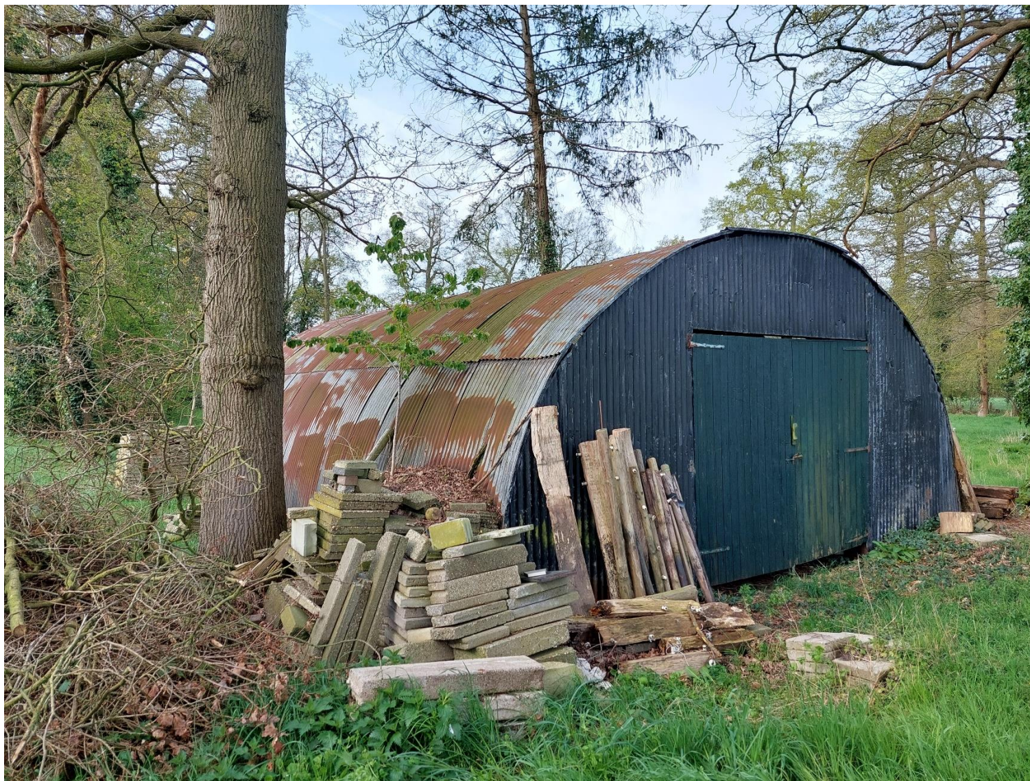
Afbeelding 6: Te verwijderen schuur, situatie op 26 april 2023.