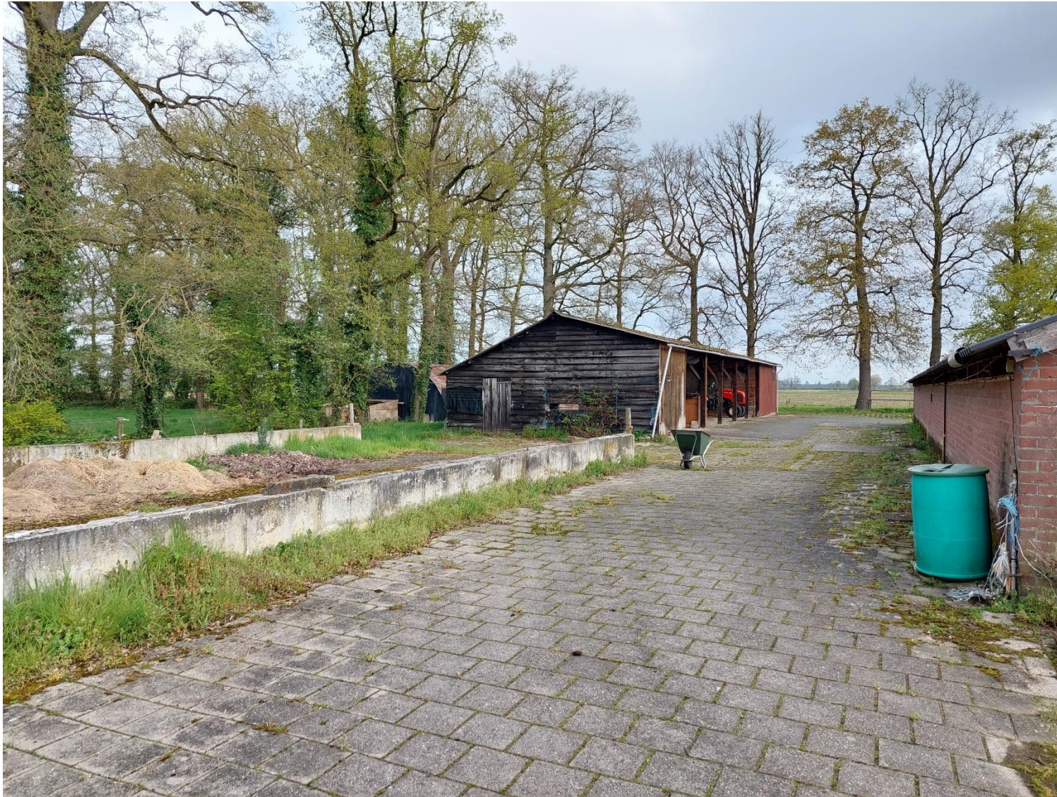
Afbeelding 4: Te verwijderen schuur en mestkelder, situatie op 26 april 2023.