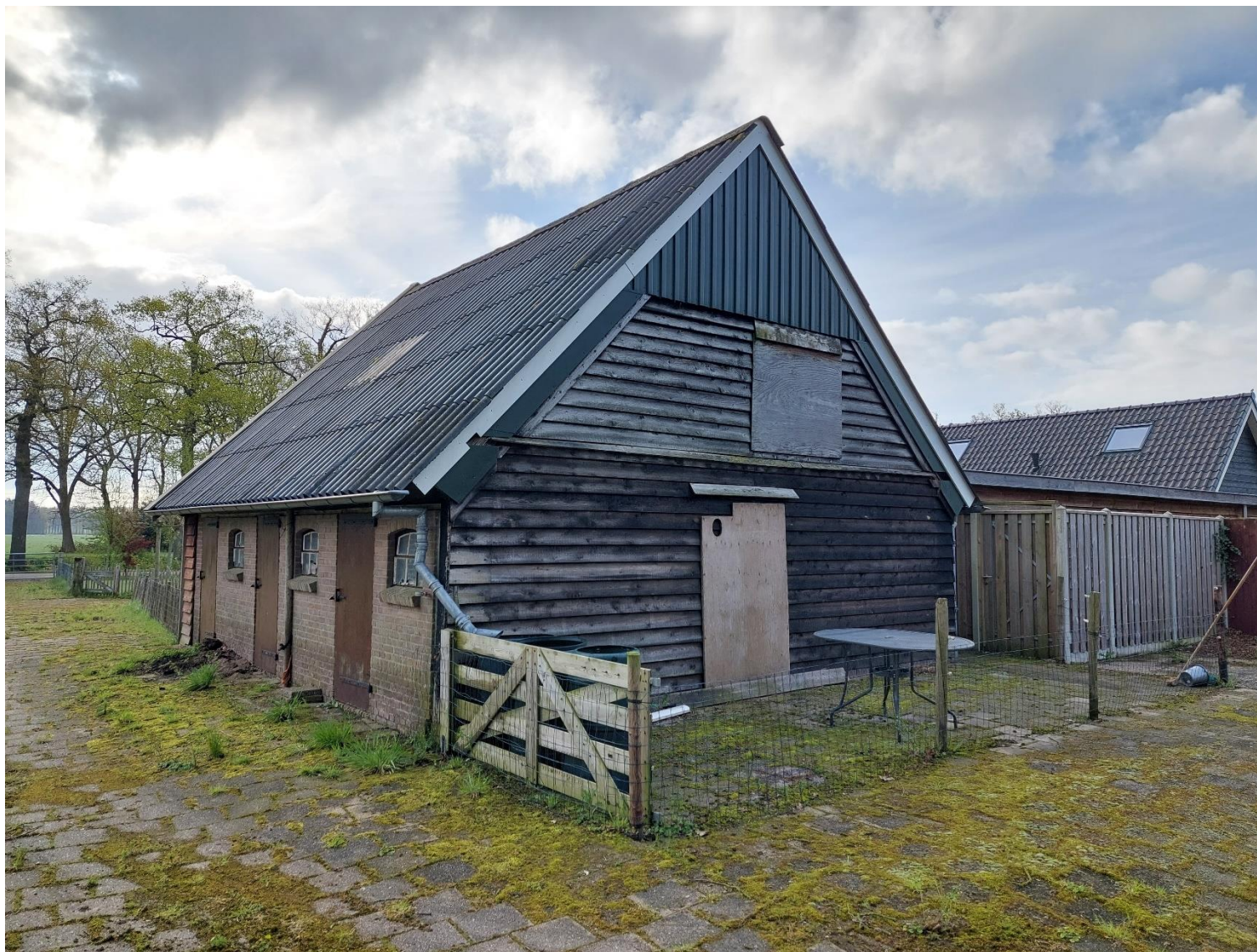
Afbeelding 5: Te verwijderen schuur, situatie op 26 april 2023.