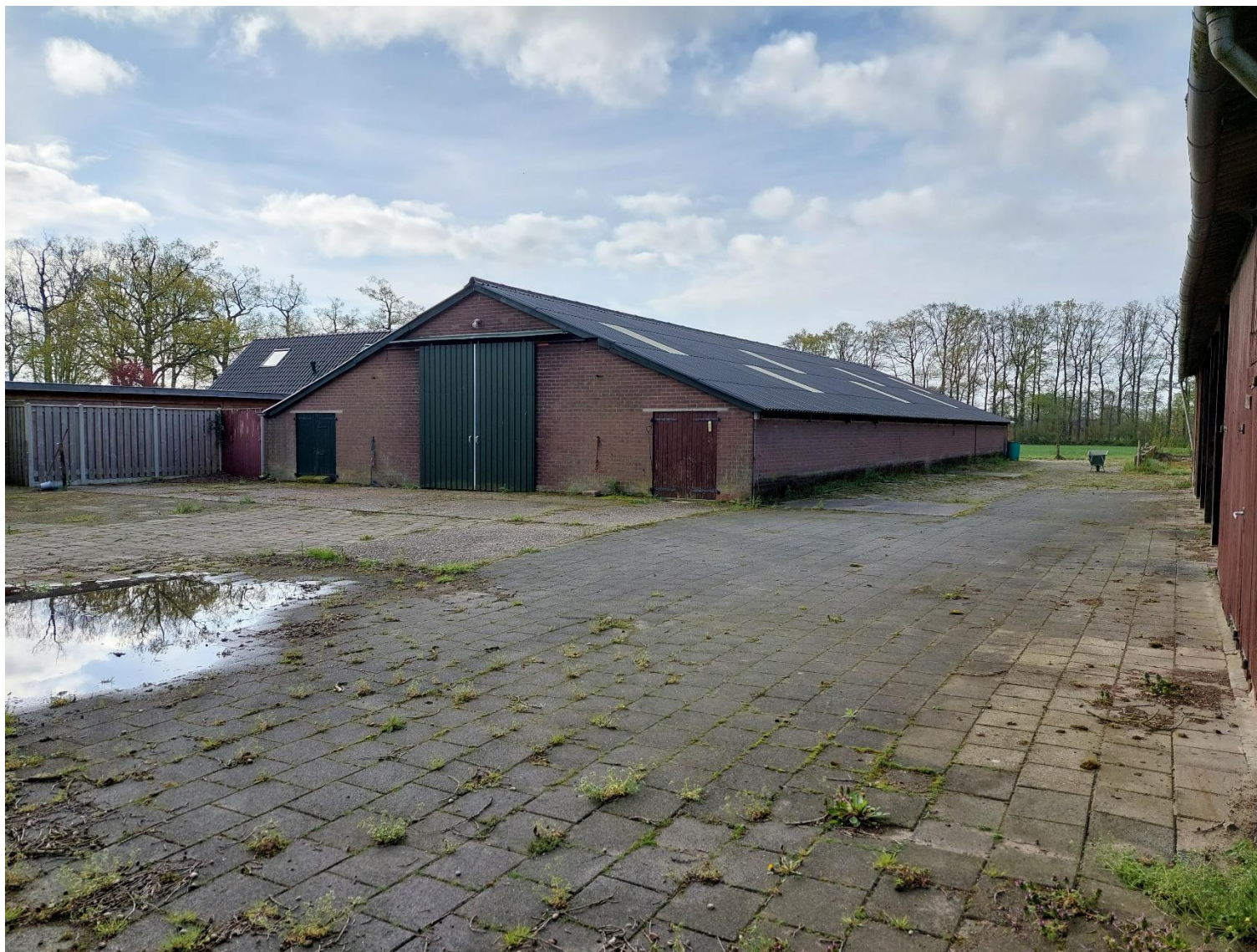
Afbeelding 3: Te verwijderen stal, situatie op 26 april 2023.