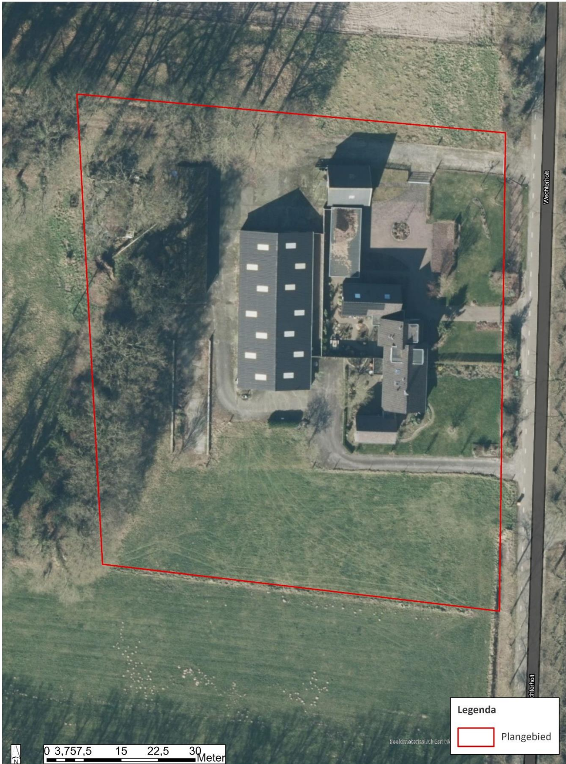
Afbeelding 2: Luchtfoto van het plangebied (ESRI, 2023).