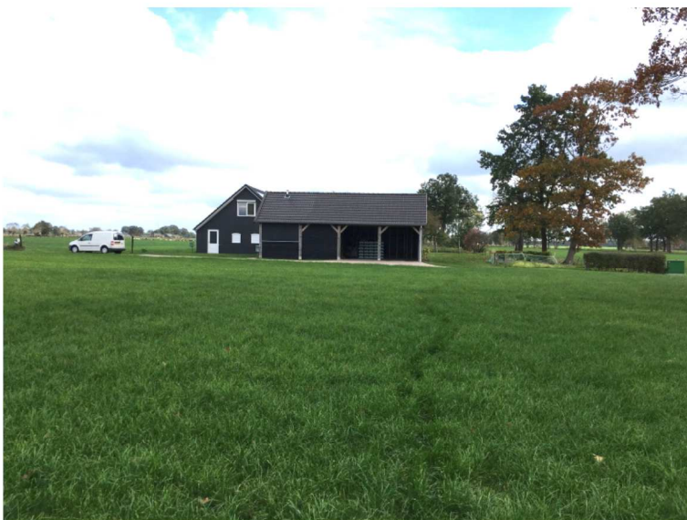
Figuur 5. Oostzijde van het plangebied met op de achtergrond het erf van nr. 9.