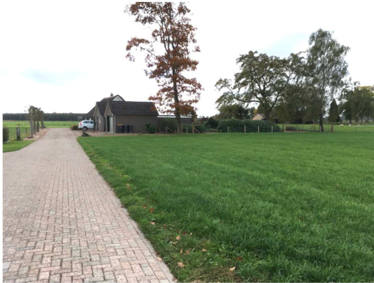
Figuur 3. Zuidkant plangebied met op de achtergrond het erf van nr. 7.