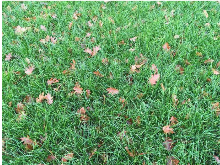
Figuur 8. Beeld van de vegetatie in het plangebied.

Het plangebied bestaat uit regulier, agrarisch grasland dat in recente jaren nieuw is ingezaaid (fig. 8). De vegetatie is zeer soortenarm. Er zijn alleen algemene grassoorten gevonden, met name Engels raaigras. Het is uitgesloten dat in het plangebied beschermde of bedreigde plantensoorten voorkomen.