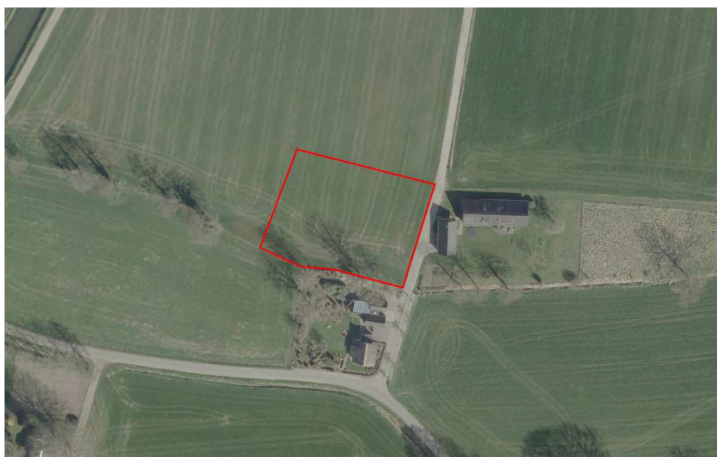
Figuur 2. Recente luchtfoto plangebied met erfgrans nieuwbouw (bij benadering).

Het plangebied (fig. 2) wordt gevormd door een deel van een groot, regulier, agrarisch graslandperceel dat in recente jaren nieuw is ingezaaid. De oppervlakte van het terrein bedraagt circa 2.300 vierkante meter. Ten zuiden en oosten van het plangebied liggen de erven van respectievelijk huisnummer 7 en 9. Het gebied rond het plangebied wordt gevormd door een grootschalig landbouwgebied met grote percelen en weinig begroeiing. Op de perceelgrens die langs de zuidkant van het plangebied staat een fragmentarische singel met oudere eiken, met name ten westen van het plangebied. Oppervlaktewater ontbreekt in en rond het plangebied. Op circa 150 meter ten westen van het plangebied loopt een brede weterring.