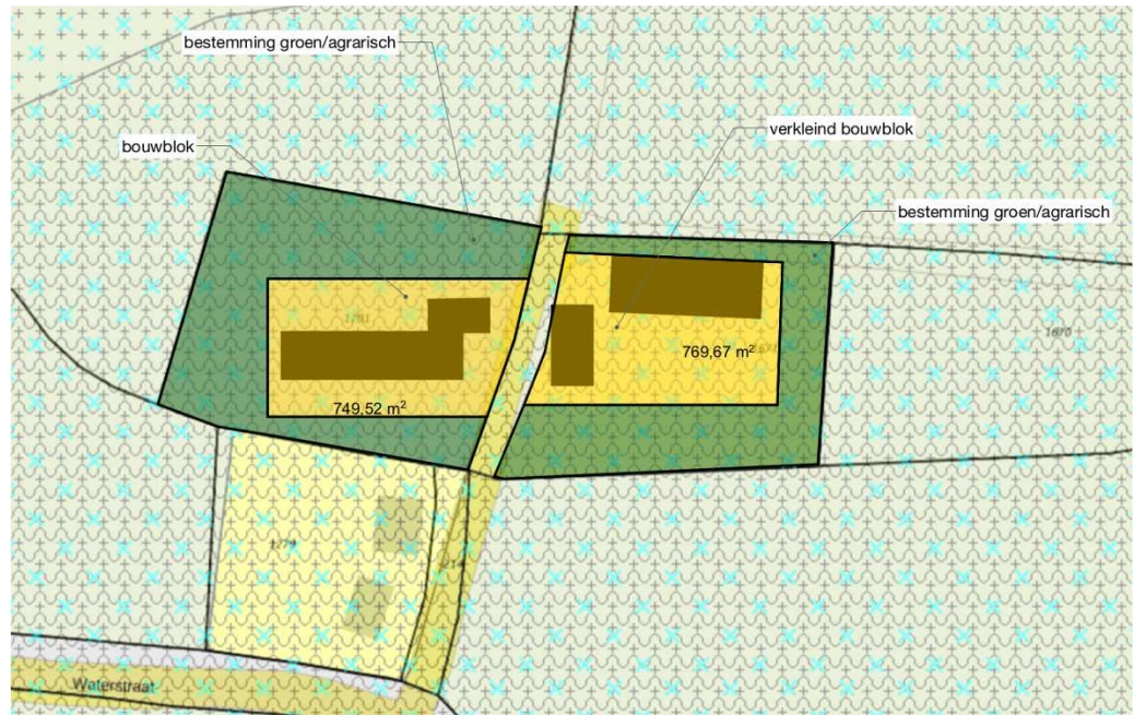
Figuur 6. Toekomstige kadastrale inrichting van het plangebied.

Het voornemen bestaat om in het plangebied een vrijstaande woning te realiseren (fig. 6). Voor de uitvoering verdwijnt geen opgaande begroeiing of oppervlaktewater. De planning van het project is niet bekend.