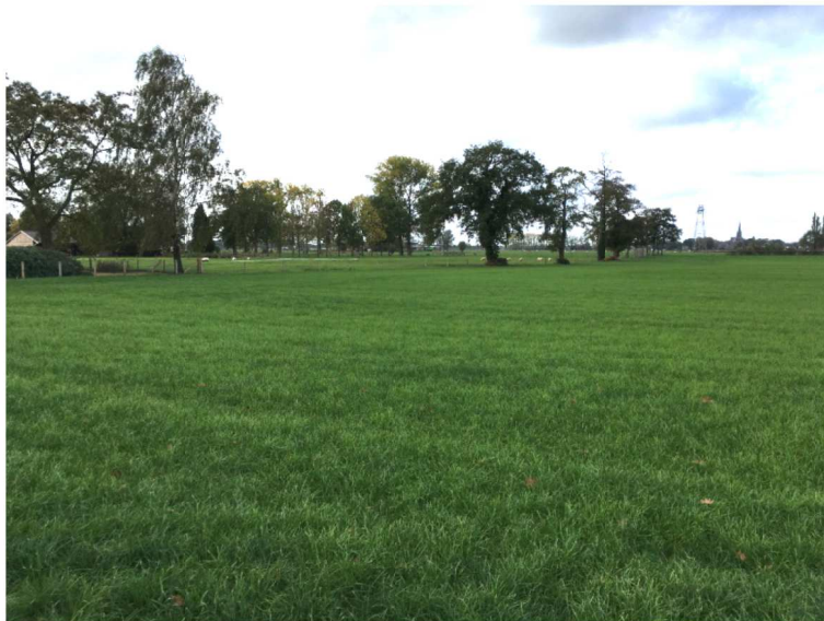
Figuur 4. Westzijde van het plangebied.