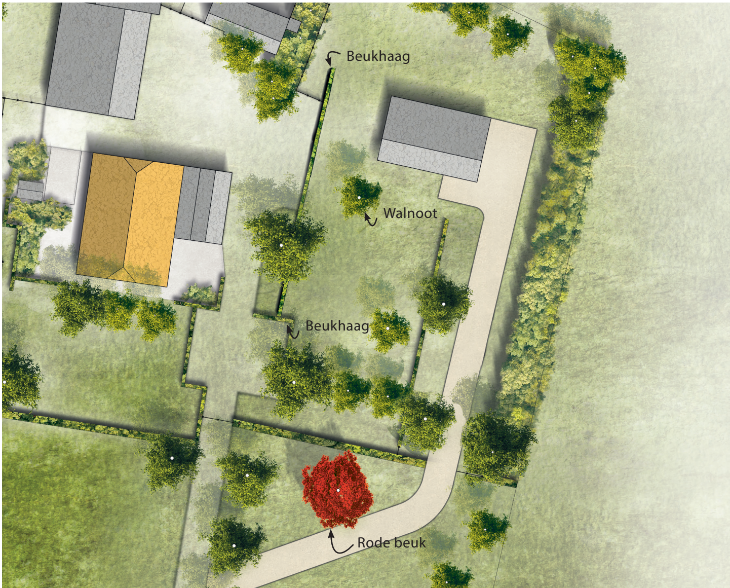
Afbeelding 25. Groene inpassing Raalterweg 25