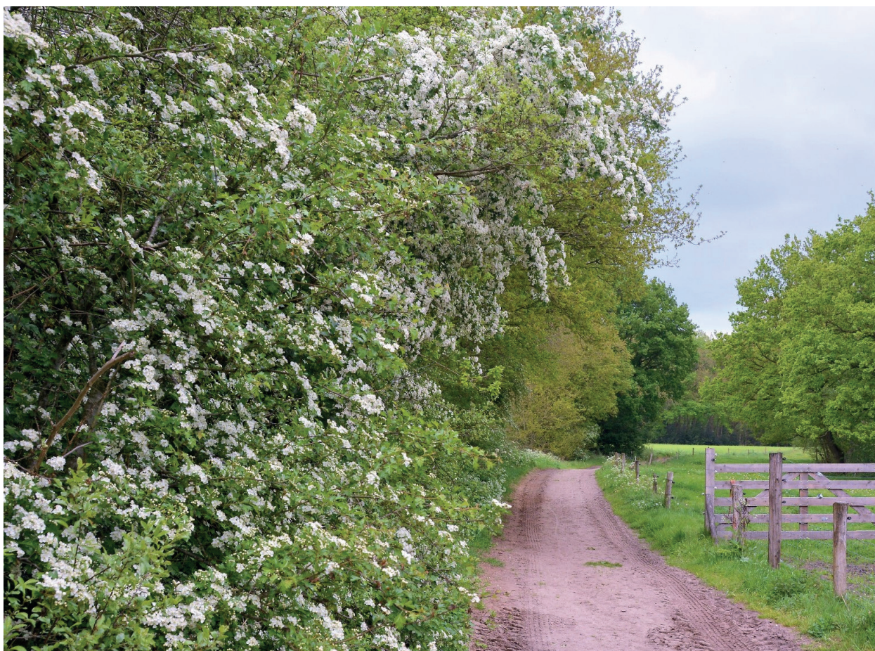
Afbeelding 24. Bosplantsoen met o.a. meidoorn langs halfverhard pad (sfeerbeeld)