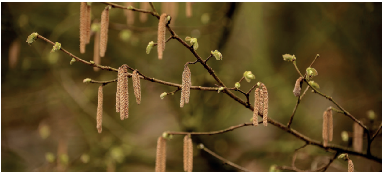
Afbeelding 23. Hazelaar