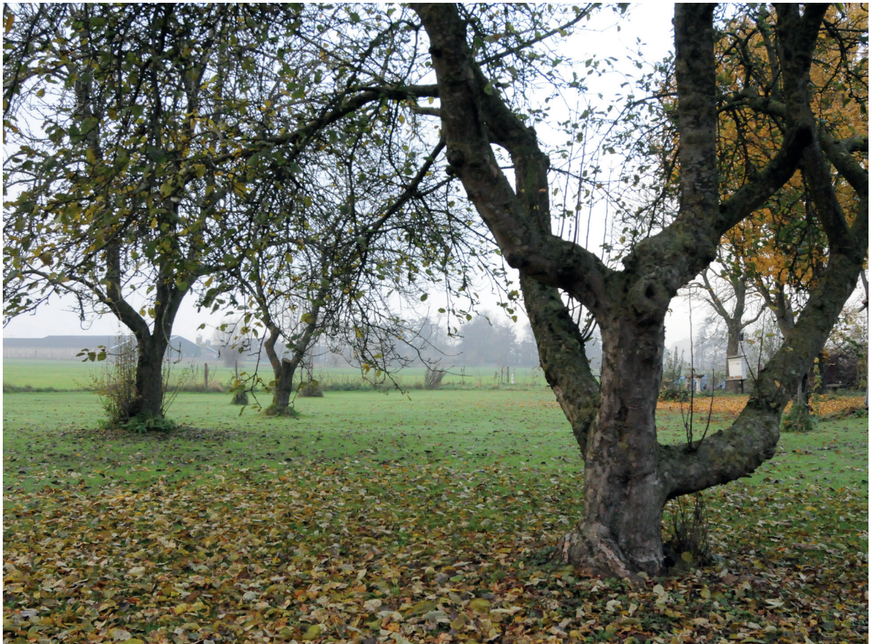
Afbeelding 21. Huidige boomgaard