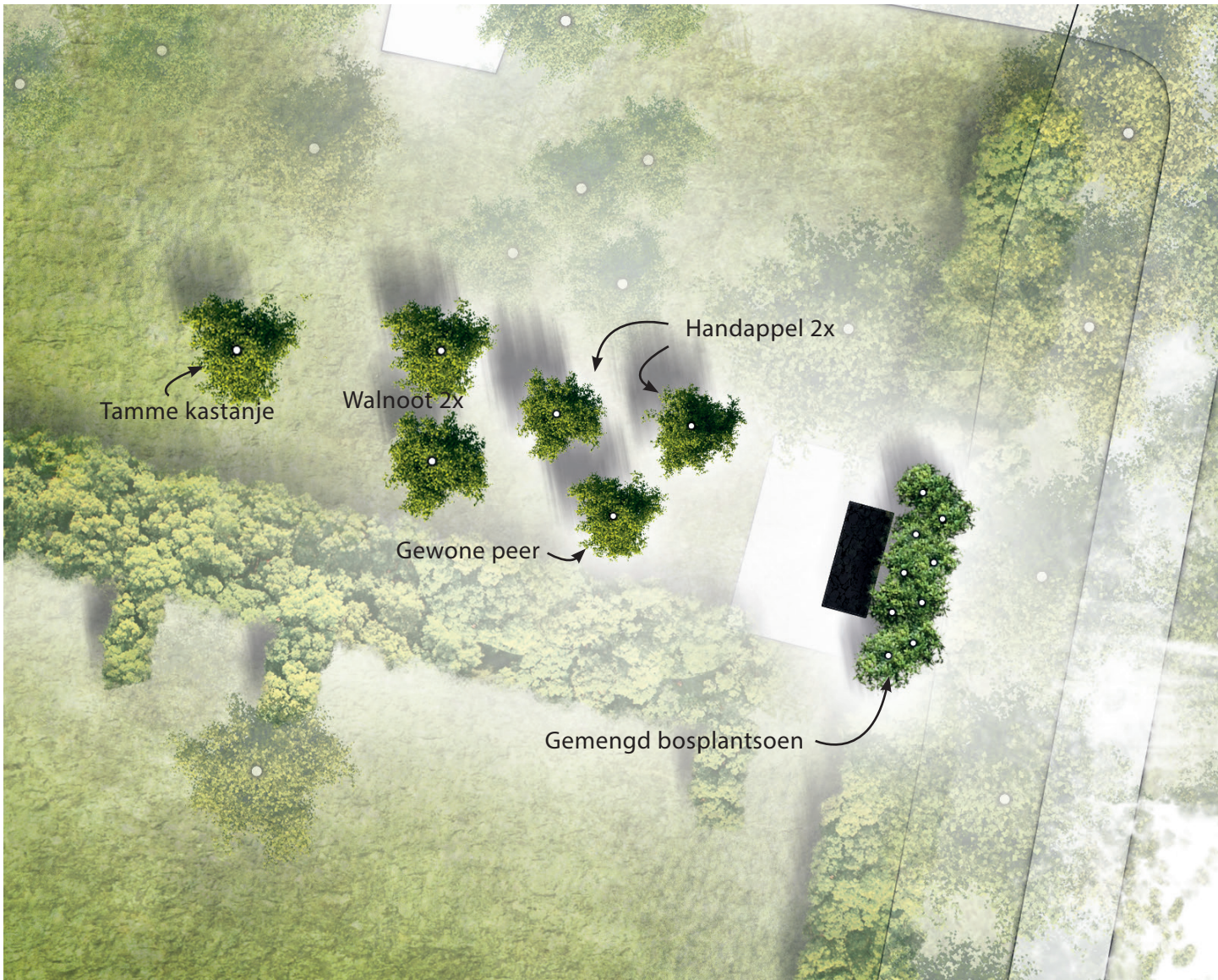
Afbeelding 22. Groene inpassing Lierderholhuisweg 9