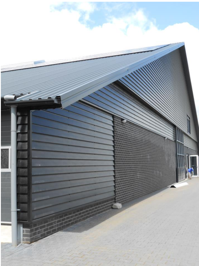
Ommen, Beerze, Marsdijk