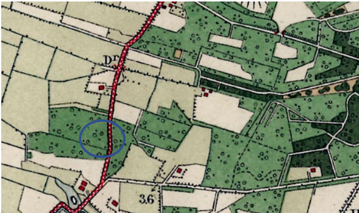
Topografische kaart ca. 1917 (Topotijdreis)