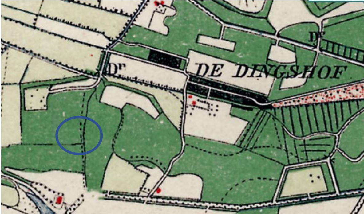
Topografische kaart voor 1916 (Topotijdreis)