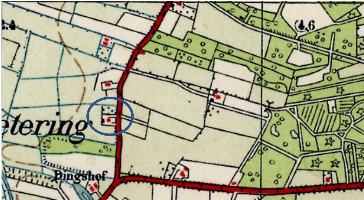
Topografische kaart ca. 1932 (Topotijdreis).