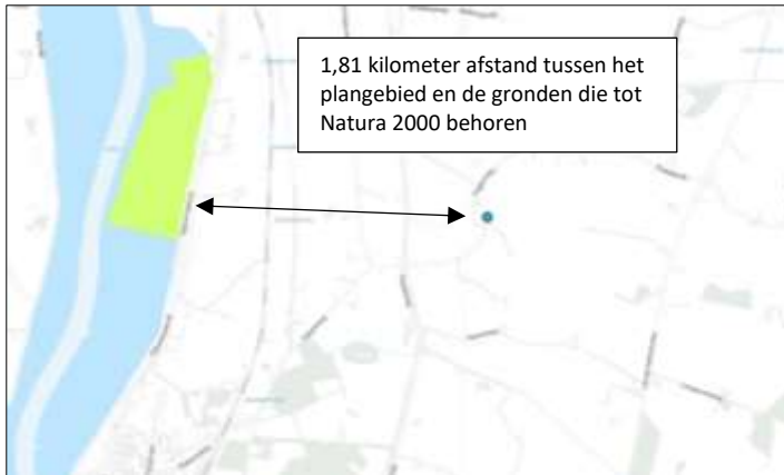
Ligging van Natura 2000-gebied in de omgeving van het plangebied. De ligging van het plangebied wordt met de blauwe marker aangeduid. Gronden die tot Natura 2000 behoren worden met de lichtgroene en lichtblauwe kleur aangeduid.