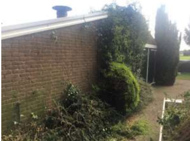
Mogelijk nestelen er jaarlijks vogels in de klimop aan de te slopen schuur.

Het plangebied behoort tot functioneel leefgebied van verschillende vogelsoorten. Vogels benutten het plangebied als foerageergebied en vermoedelijk nestelen er jaarlijks vogels in de beplanting. Vogelsoorten die mogelijk in de beplanting nestelen zijn merel, vink en roodborst. De schuur wordt niet als potentiële nestplaats voor vogels beschouwd.