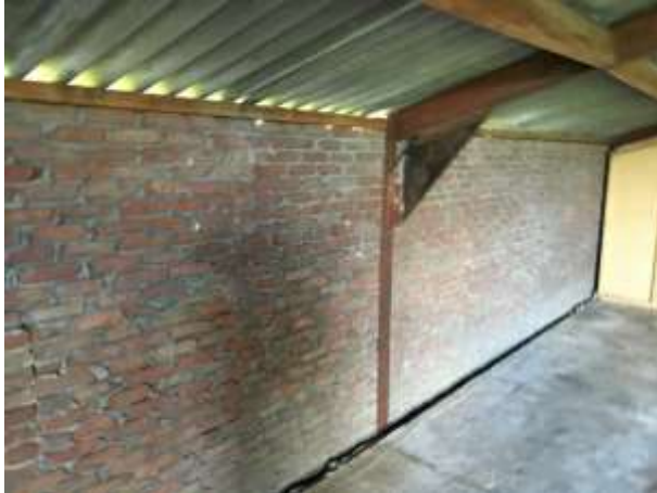
De schuur beschikt over halfsteens buitengevels zonder dakbeschot.

Er zijn tijdens het veldbezoek geen vleermuizen waargenomen en er zijn geen aanwijzingen gevonden dat vleermuizen een rust- of voortplantingsplaats in het plangebied bezetten. De schuur beschikt niet over luchtspouw. Verder zijn in het plangebied geen potentiële verblijfplaatsen van vleermuizen waargenomen, zoals een holle ruimte achter een boeiboord, windveer, loodslab, vensterluik, zonnewering of gevelbetimmering aangetroffen.