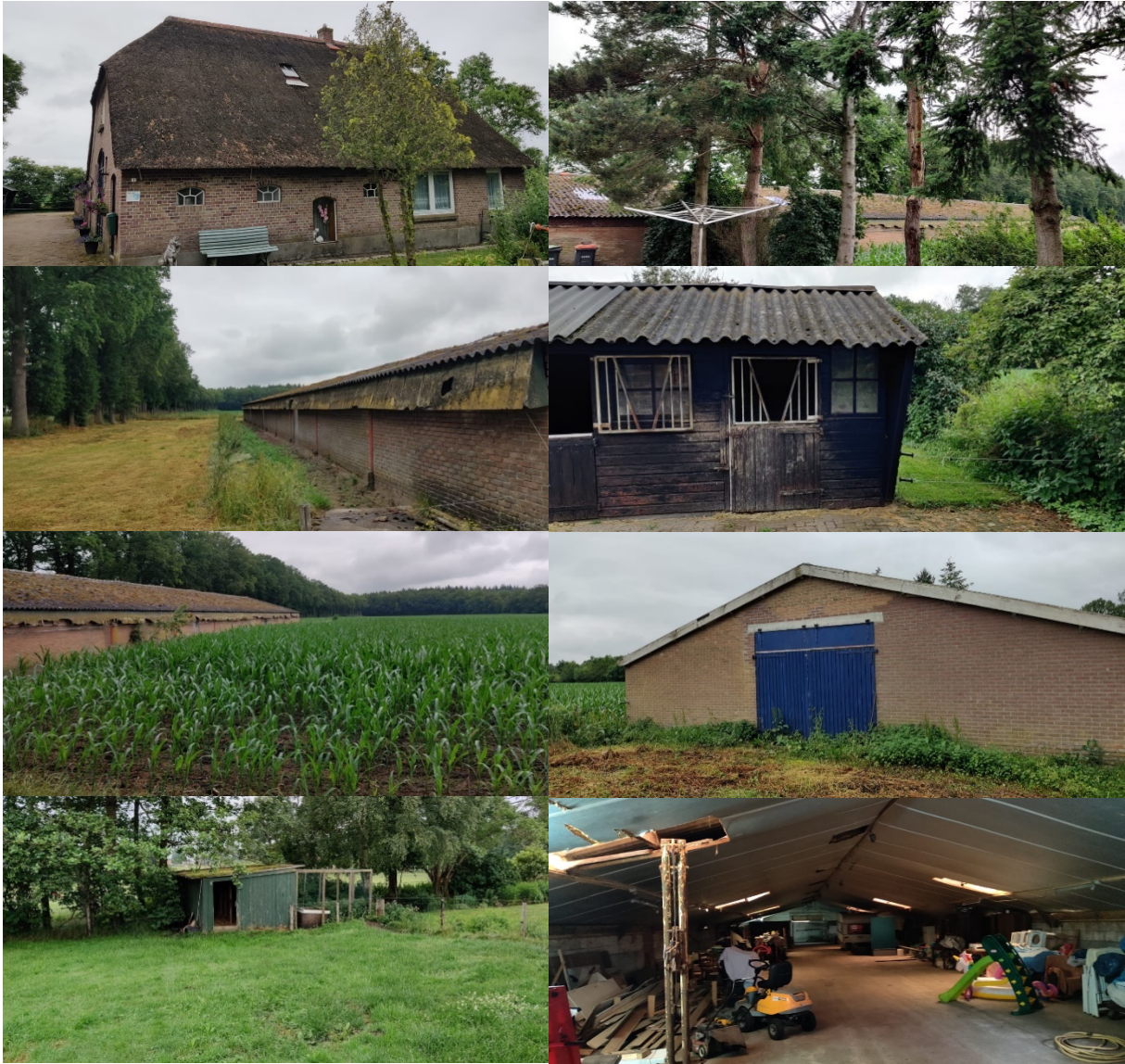
Afbeelding 2. Impressie plangebied, situatie op 30/06/2021