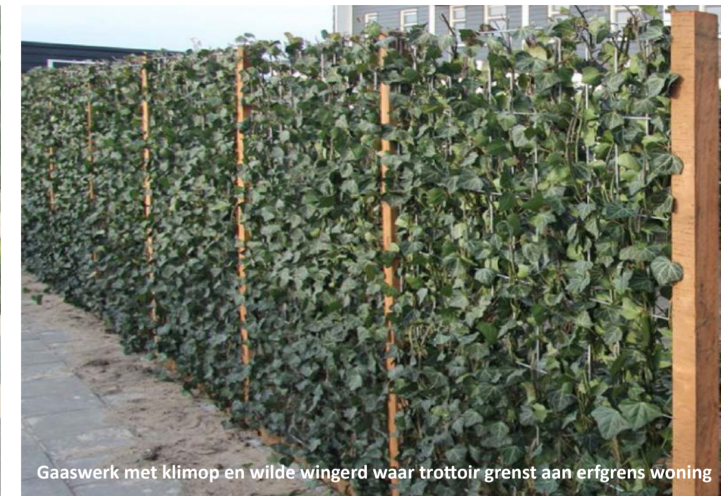
Gaaswerk met klimop en wilde wingerd waar trottoir grenst aan erfgrans woning