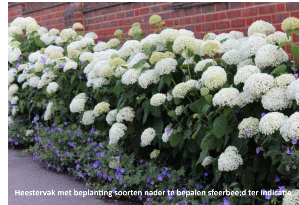
Heestervak met beplanting soorten nader te bepalen sfeerbeeld ter indicatie