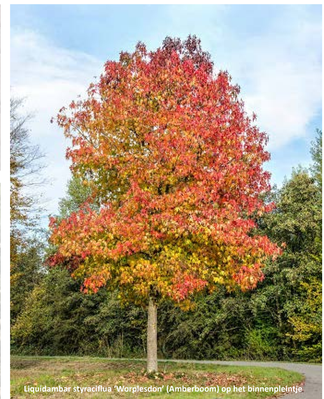
Liquidambar styraciflua 'Worplesdon' (Amberboom) op het binnenpleintje