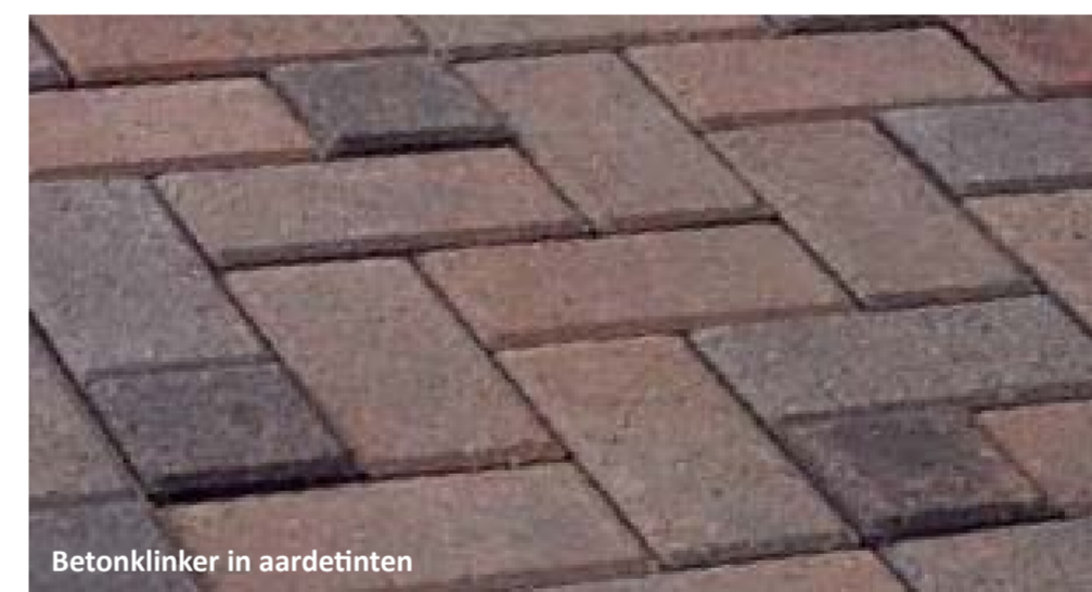
Betonklinker in aardetinten