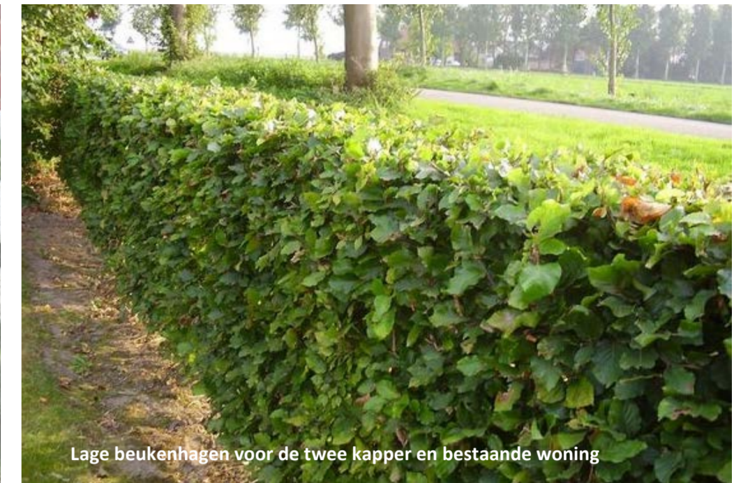
Lage beukenhagen voor de twee kapper en bestaande woning