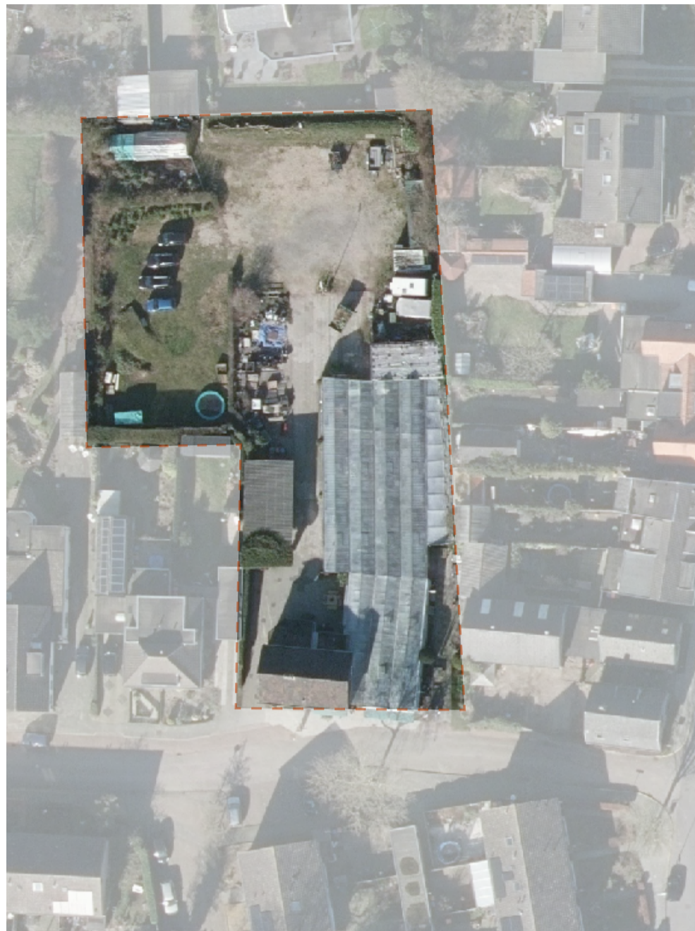
Luchtfoto met in uitsnede de locatie

De entree wordt aan de zijde van het oude tuincentrum ingeplant met een ligusterhaag waardoor het beeld hier (vrijwel) jaarrond groen is. De erfgrenzen langs de bestaande woningen worden in overleg met de bewoners aangebracht. Voor de tweekappers wordt gekozen voor een beukenhaag op de erfgrens met het woonhof. De zijde van de twee kapper en rijwoning die grenzen aan de openbare ruimte worden uitgevoerd met een gaaswerk met klimop ( Hedra helix ) en wilde wingerd ( Parthenocissus quinquefolia 'Engelmannii' ) waardoor deze niet te breed het trottoir op groeien. De boom op het hof is een amberboom ( Liquidambar styraciflua 'Worplesdon' ). Deze verdraagt goed verharding en zorgt voor een mooi herfstbeeld. Onder de boom komt een plantvak deze zal later worden ingevuld.