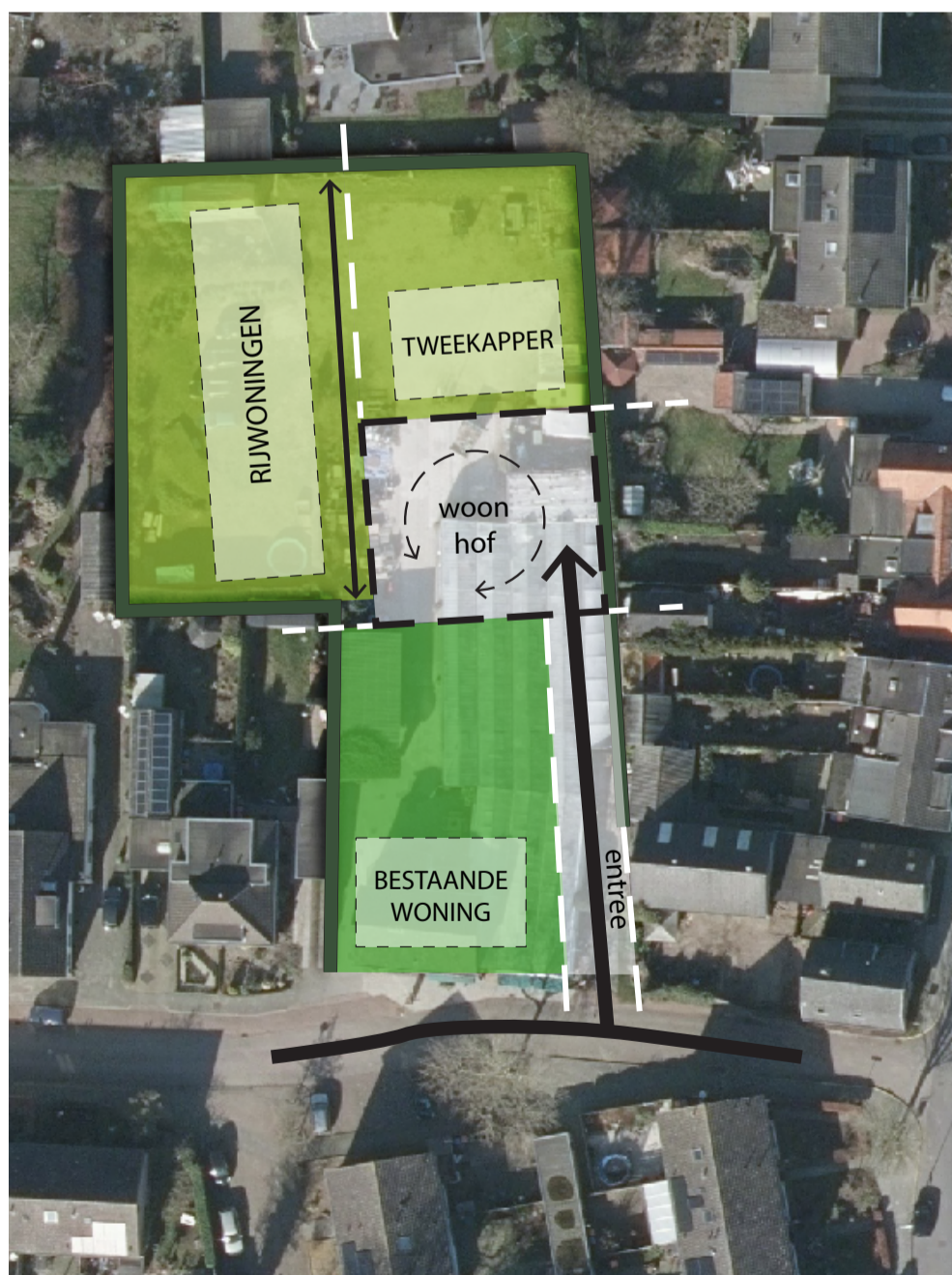
Visie kaart stedenbouwkundige opzet