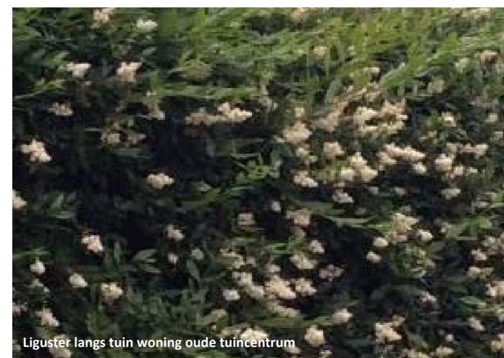
Liguster langs tuin woning oude tuincentrum