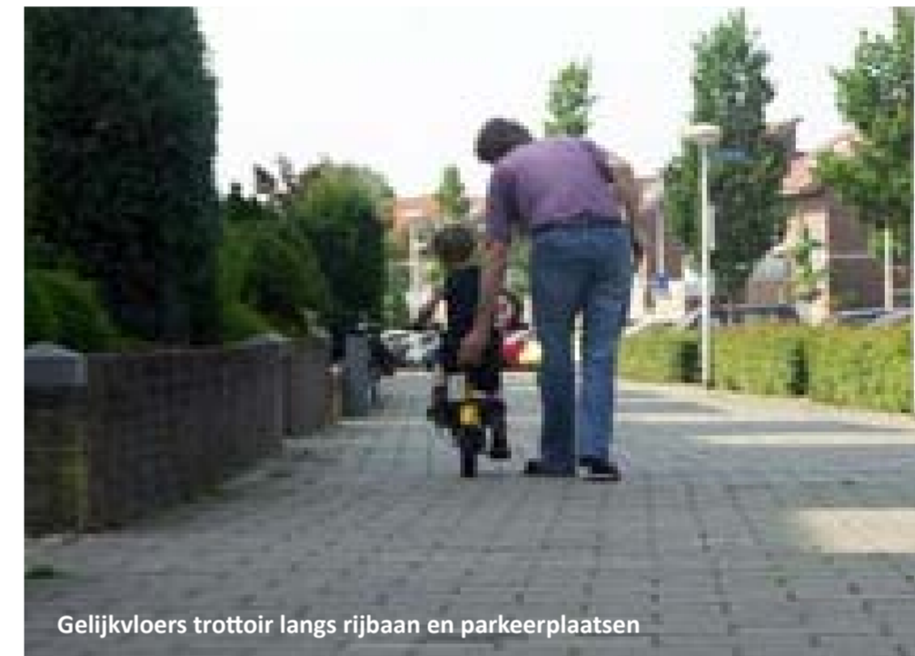
Gelijkvloers trottoir langs rijbaan en parkeerplaatsen