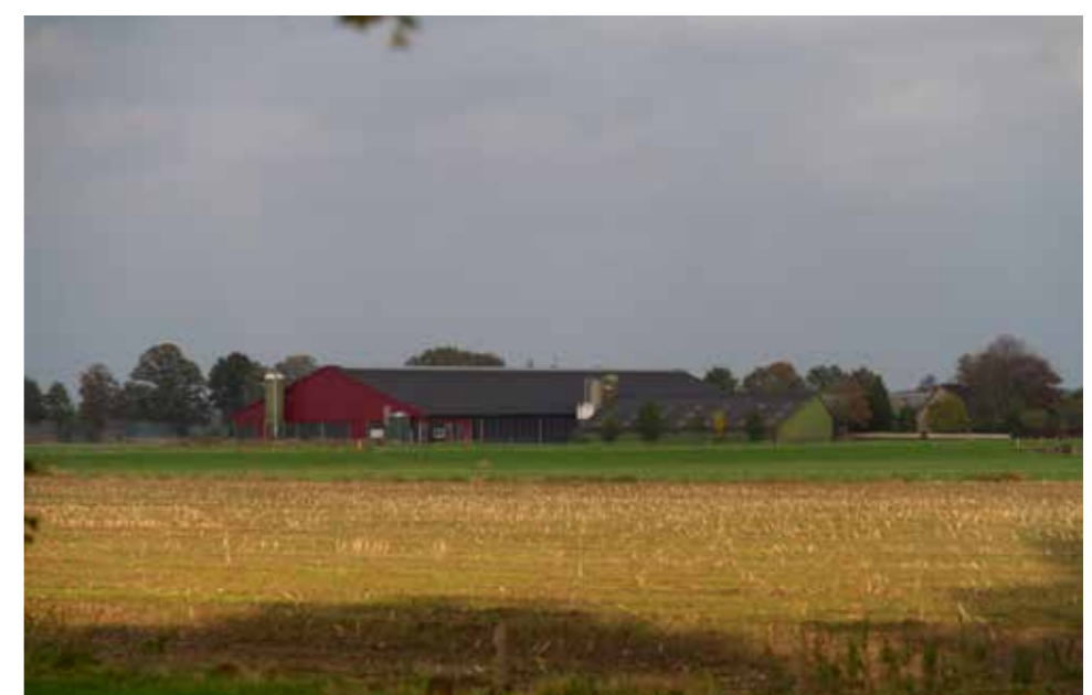
Afbeelding 8. Zicht op nieuwbouw in de omgeving, ten noorden van het erf.