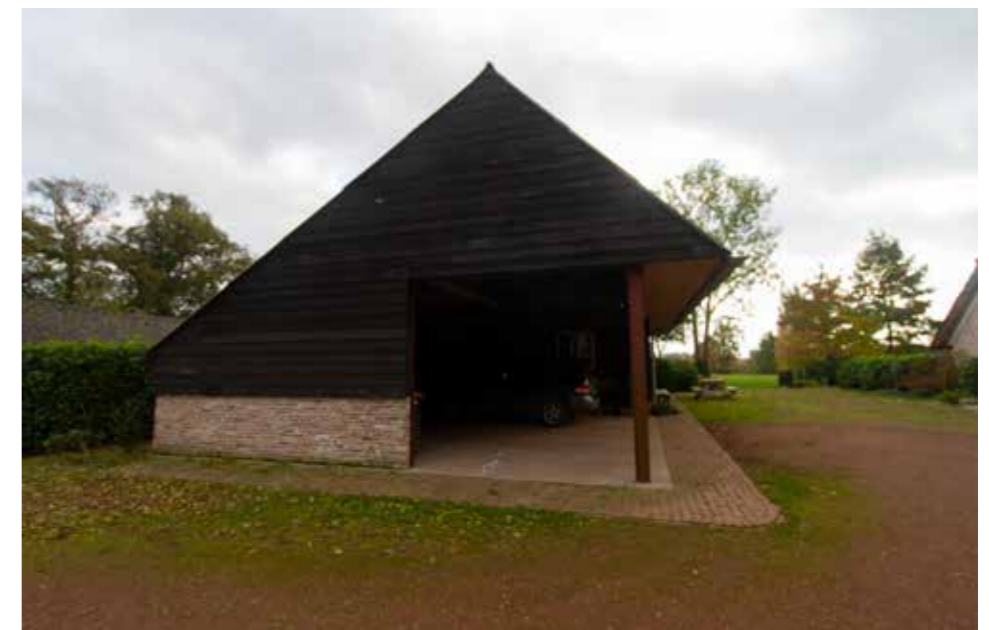
Afbeelding 3. Bij de bestaande woning te behouden kapschuur.