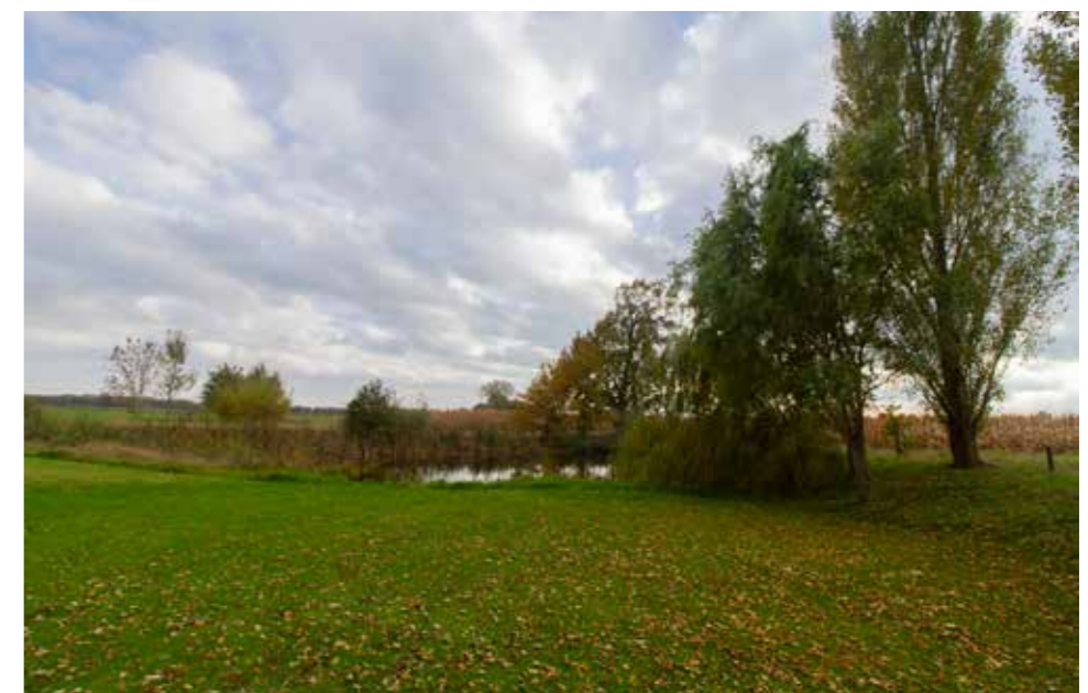
Afbeelding 16. Natuurlijke beplanting en poel op overgang naar het landschap.