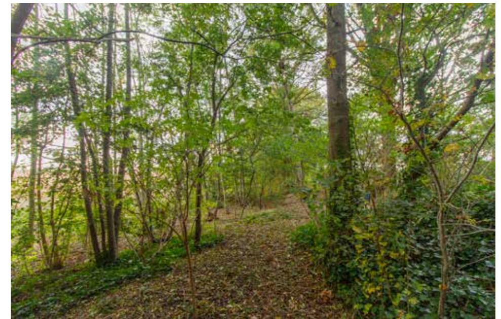
Afbeelding 11. Bestaand bos ten westen van het erf.