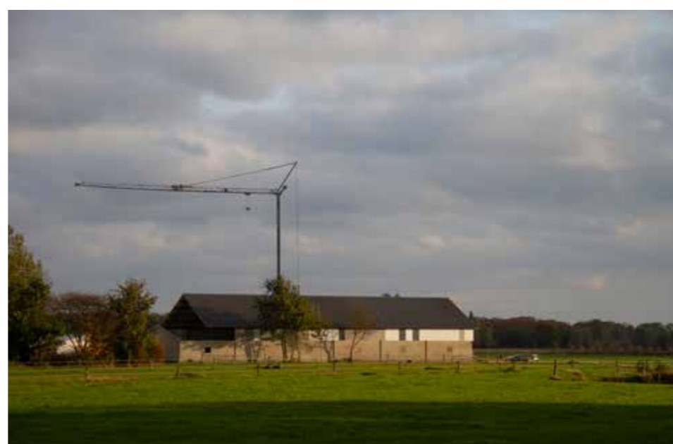
Afbeelding 7. Zicht op nieuwbouw in de omgeving, ten westen van het plangebied.