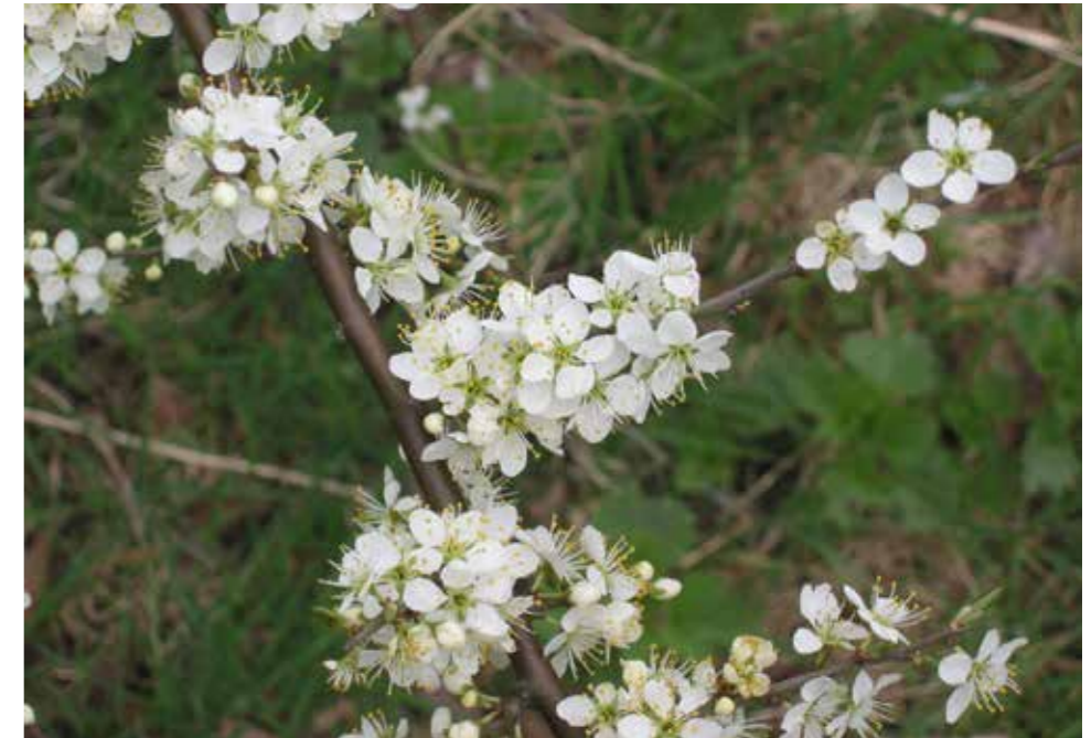
Afbeelding 28. Sleedoorn