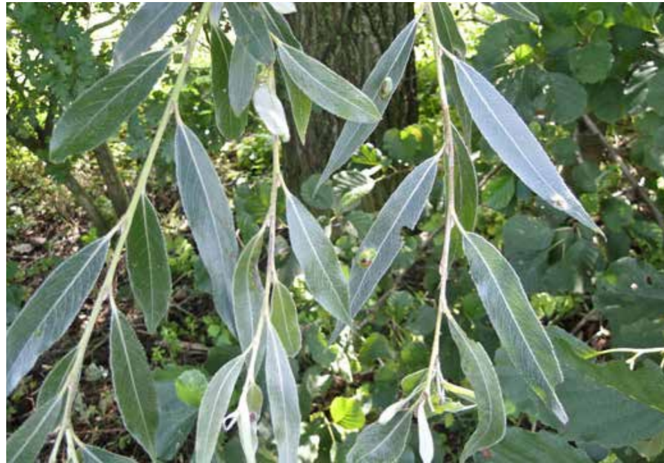
Afbeelding 25. Schietwilg

De soortkeuze is gebaseerd op de bodem en grondwaterhuishouding ter plekke. Door een breed sortiment te kiezen, een plantafstand van circa 1 meter en de soorten per 5 tot 7 stuks van eenzelfde soort te mengen is de kans groter dat voldoende planten aanslaan en een dichte, gezonde en gevarieerde vegetatie ontstaat waardoor het gewenste eindbeeld wordt behaald. Voor het bos op het voorerf (bomen en struiken) en het aanvullen van de houtwal (struiken onder bestaande bomen) worden inheemse soorten gekozen. De solitaireren kunnen van dit sortiment afwijken om zo in de toekomst een in het oog springend element te vormen. Voor de fruitgaard worden enkele hoogstam fruitbomen geplant. Zowel bij de solitaireren als de fruitbomen is het aan te bevelen grondverbetering toe te passen, aangezien deze over het algemeen door het type boom en de grotere plantmaat meer van de bodem vragen. Het bloemrijk grasland kan worden ingezaaid met bijvoorbeeld mengsel G1 (voor lichtere gronden) van de Cruydt-Hoeck of vergelijkbaar. DE soorten en maten zijn uitgewerkt in de tabel op de volgende pagina.