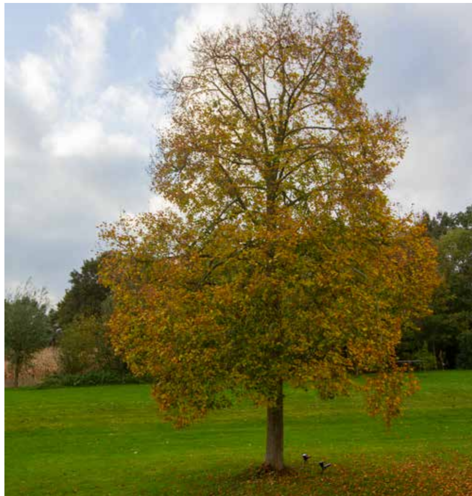
Afbeelding 14. Solitaire boom