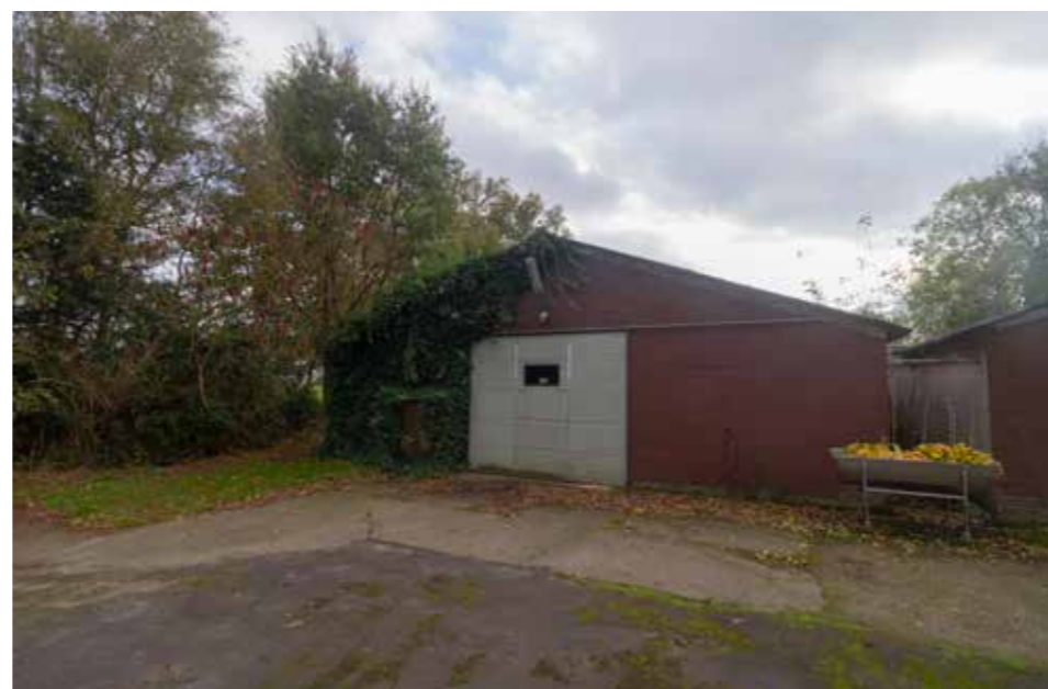
Afbeelding 4. Te slopen oostelijke stal.