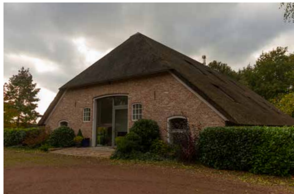
Afbeelding 2. De recent gerestaureerde woning.