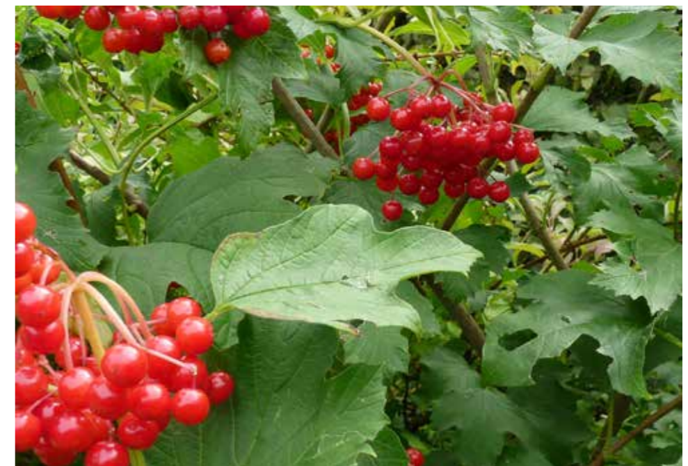
Afbeelding 30. Gelderse roos