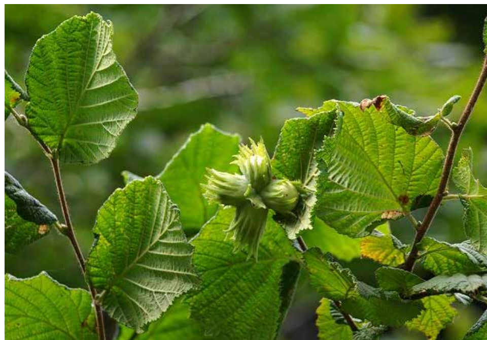
Afbeelding 27. Hazelaar