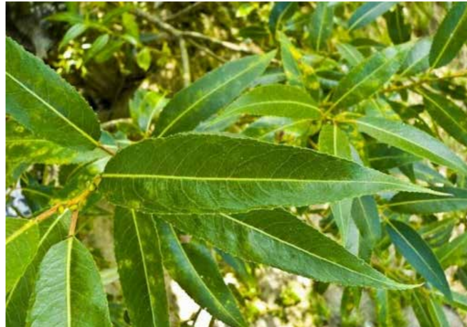
Afbeelding 26. Kraakwilg