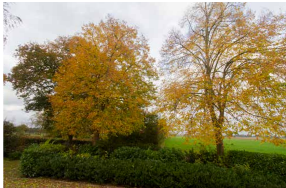
Afbeelding 10. Het huidige erf is aangekleed met volwassen beplanting.