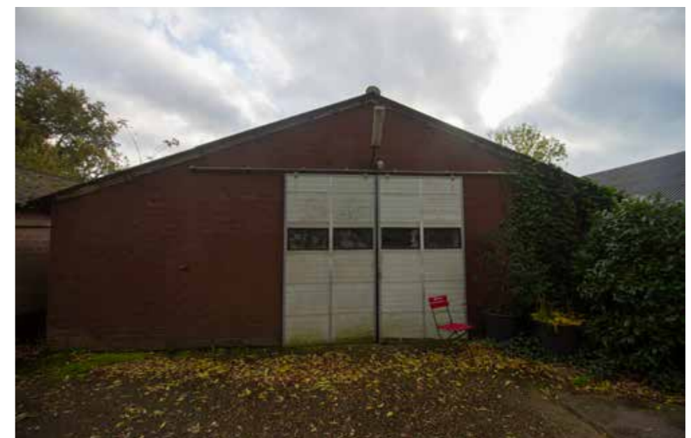
Afbeelding 5. Te slopen westelijke stal.