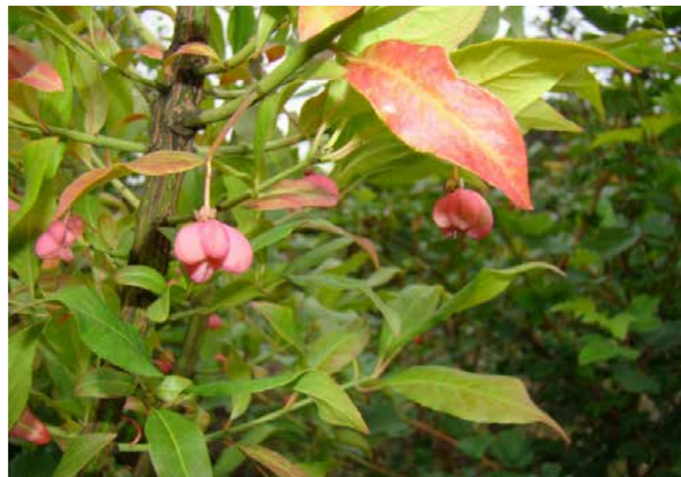
Afbeelding 29. Kardinaalsmuts