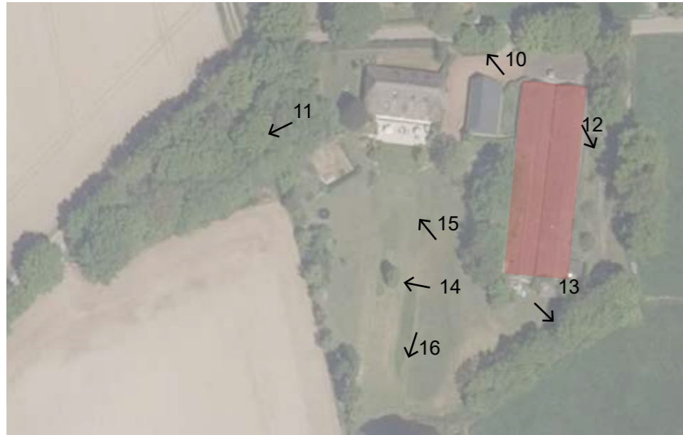
Afbeelding 9. Luchtfoto Plangebied en aanduiding foto's