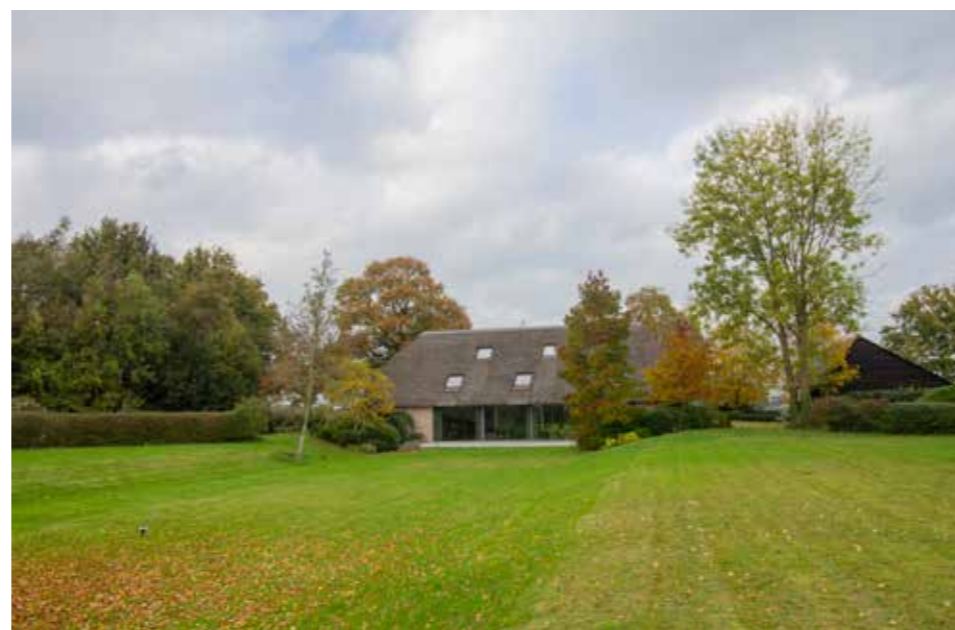
Afbeelding 15. Bestaande erf landschappelijk zeer fraai ingericht.