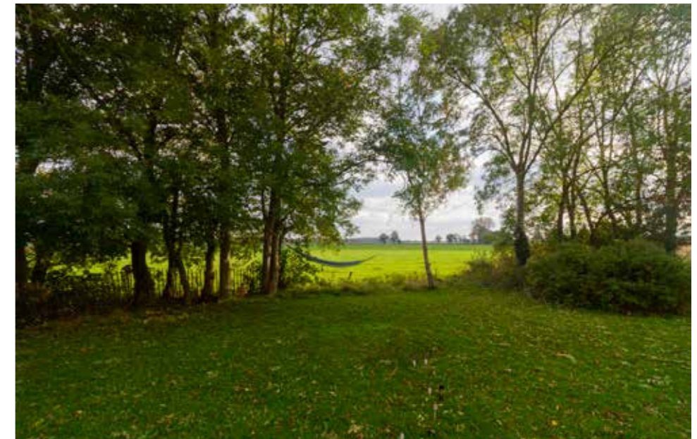
Afbeelding 13. Zicht op het achterliggende land.