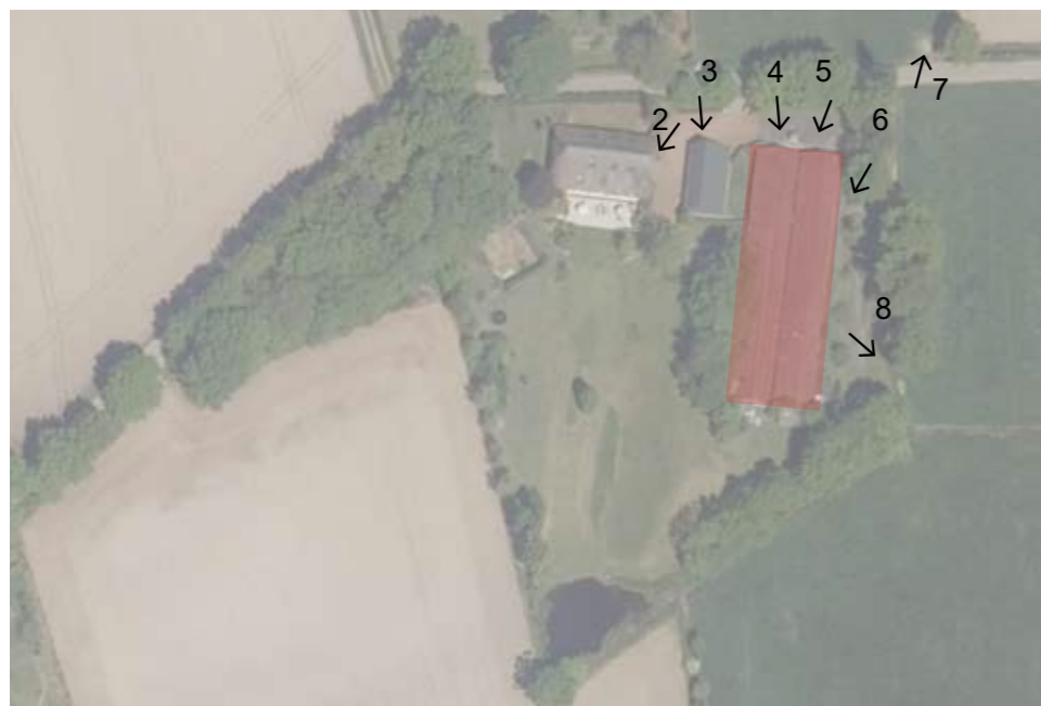
Afbeelding 1. Luchtfoto Plangebied en aanduiding foto's en te slopen stallen.

De initiatiefneemster heeft enkele jaren geleden de woning op het erf gerenoveerd en het landschap verbeterd. Als volgende stap wil zij ook de oude stallen op het erf slopen en in ruil hiervoor een woning met bijgebouw realiseren. Het erf is op enkele kleine punten na, zoals je het zou wensen vanuit landschap en biodiversiteit. Wat het meest in het oog springt zijn de ongebruikte stallen. Door deze te vervangen door een nieuwe woning met bijgebouw wordt de grootste kwaliteitswinst behaald. Daarnaast zijn nog enkele landschappelijke ingrepen mogelijk die het al fraaie erf afmaken.