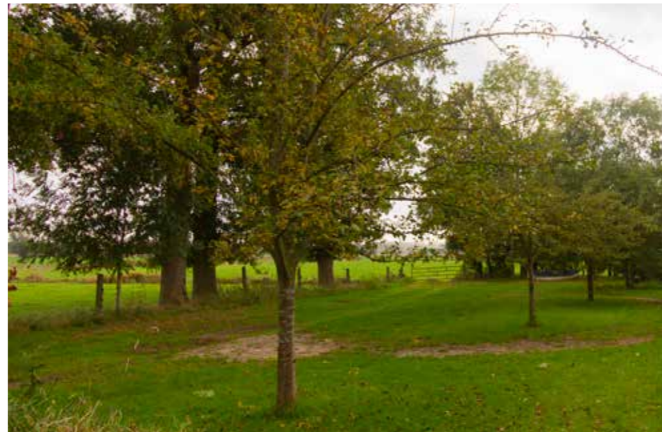
Afbeelding 12. Bestaande boomgaard verdient wat extra aandacht.