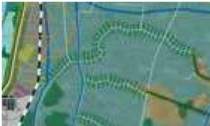
Afbeelding 23. Uitsnede visiekaart LOP Salland plangebied en omgeving