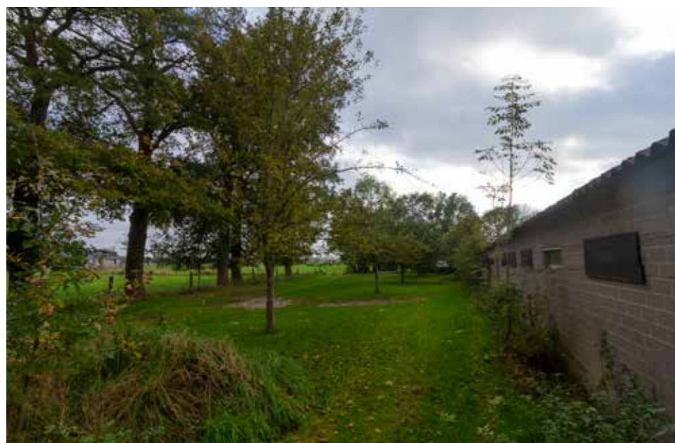
Afbeelding 6. Te slopen voormalige stal.