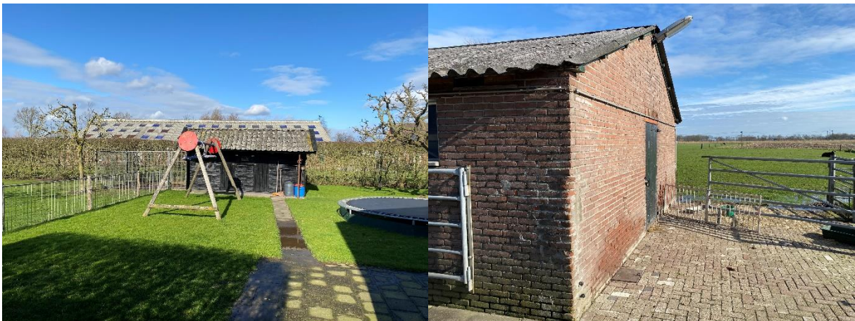
Afbeelding 5. Het tuinhuisje met pannendak (links) en de schuur met asbestdak (rechts).