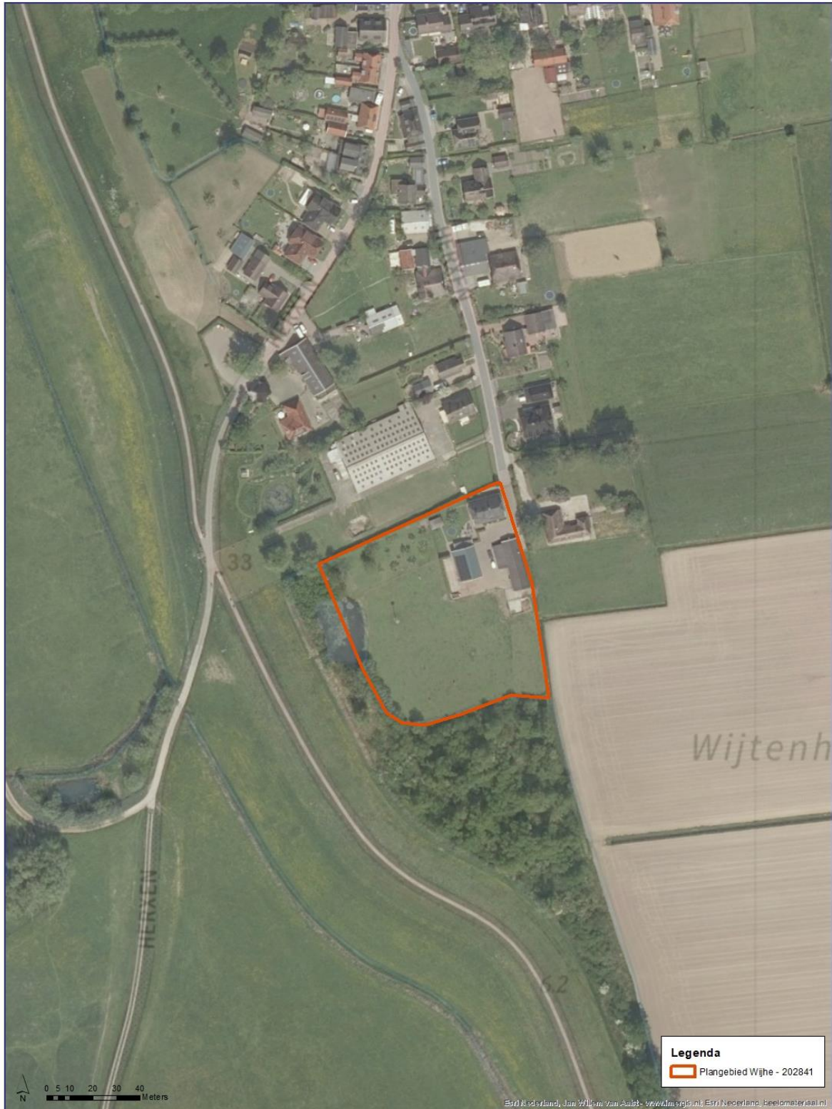
Afbeelding 2. Luchtfoto van het plangebied en de directe omgeving (ESRI, 2022).