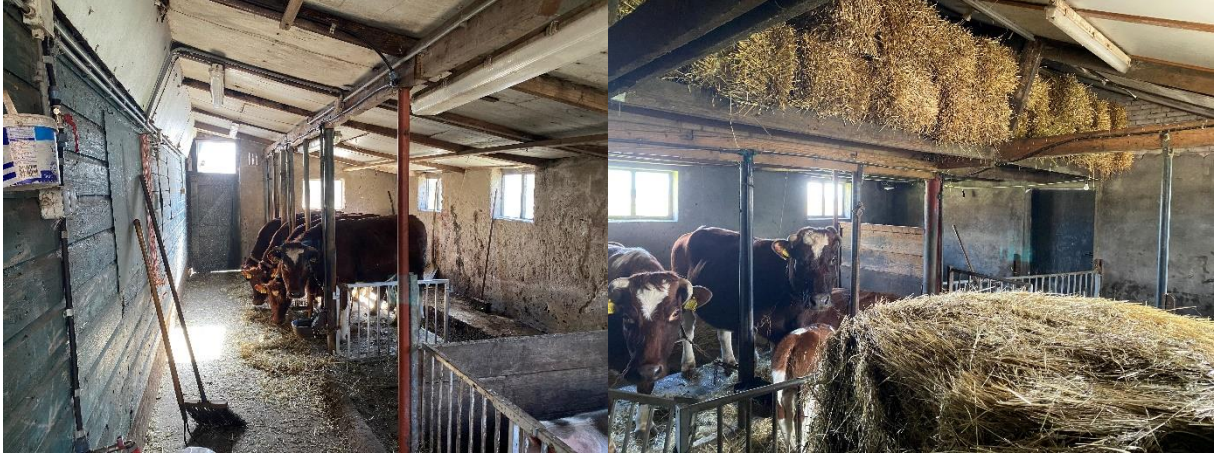
Afbeelding 6. Binnenzijde van het westelijke deel van de asbestschuur (links) en het oostelijke deel van de asbestschuur (rechts).