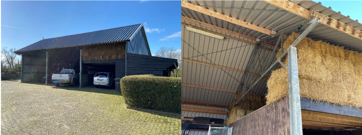
Afbeelding 3. Overzicht van de te slopen kapschuur (links) en hooizolder in de te slopen kapschuur (rechts).