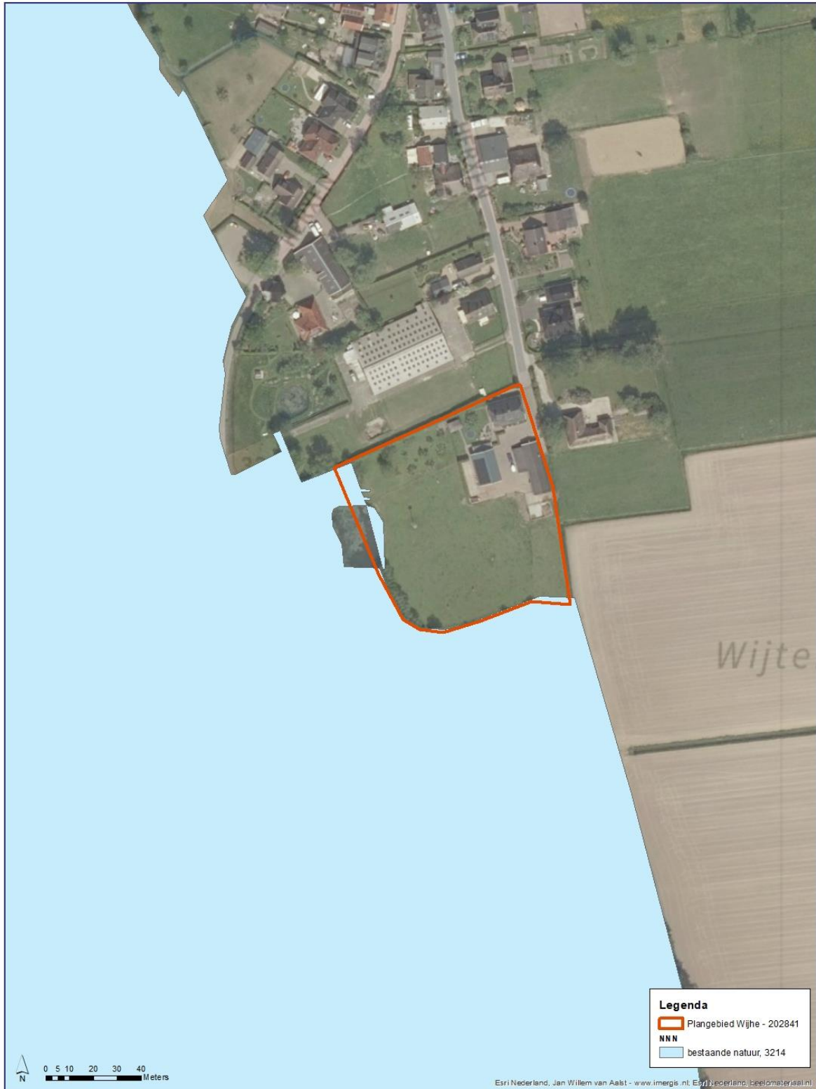
Afbeelding 8. Luchtfoto van het plangebied ten opzicht van het Natuurnetwerk Nederland (ESRI en Geoportaal Overijssel, 2022).