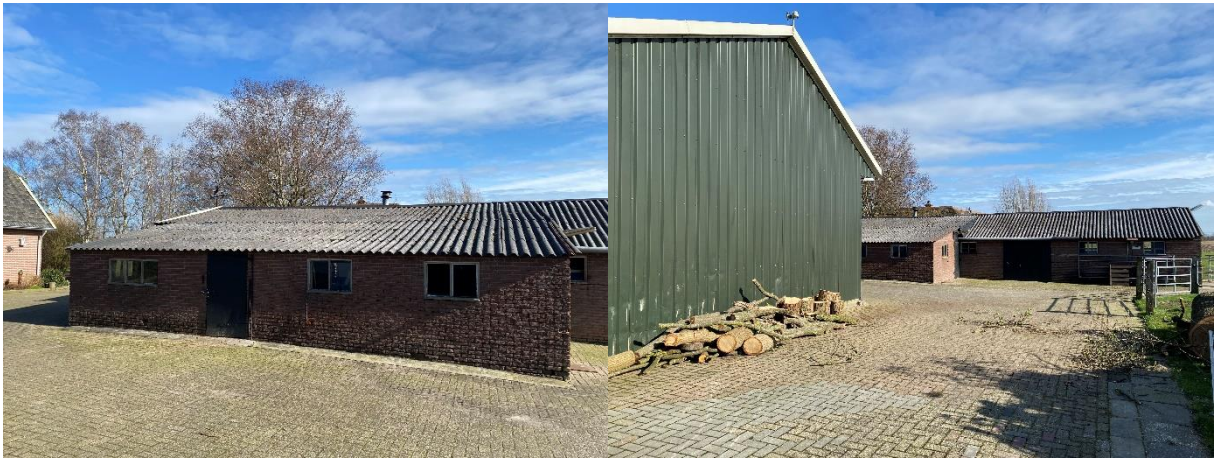
Afbeelding 4. De schuur met asbestdak met het woonhuis in de achtergrond (links) en de kapschuur en asbestschuur gezien vanuit het westen (rechts).