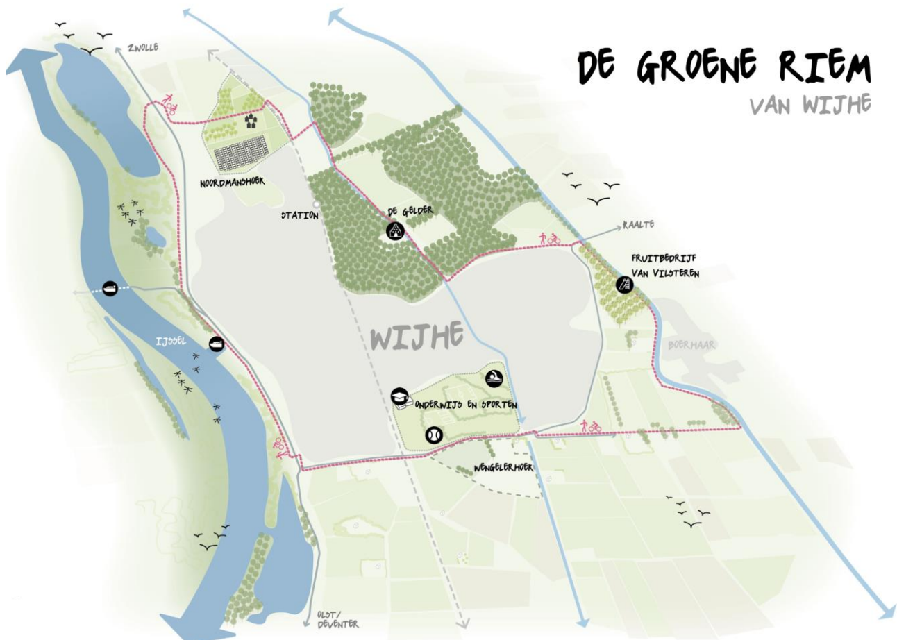
De groene riem van Wijhe

De specifieke keuze voor Wengelerhoek komt voort uit de directe aansluiting op het sportpark, de scholen (het nieuwe kindcentrum) en de ontsluitingsweg Omloop. De nabijheid van deze voorzieningen en infrastructuur maakt Wengelerhoek extra geschikt. Ook zijn er op de huidige agrarische gronden weinig waardevolle landschappelijke kenmerken aanwezig die verloren zouden gaan bij een uitbreiding. De ontwikkeling van Wengelerhoek biedt juist mogelijkheden om waardevolle landschappelijke kenmerken uit het verleden terug te brengen in het gebied.