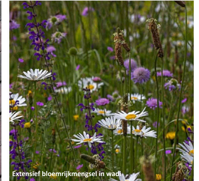
Extensief bloemrijkmengsel in wadi