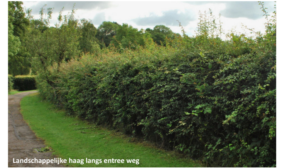
Landschappelijke haag langs entree weg