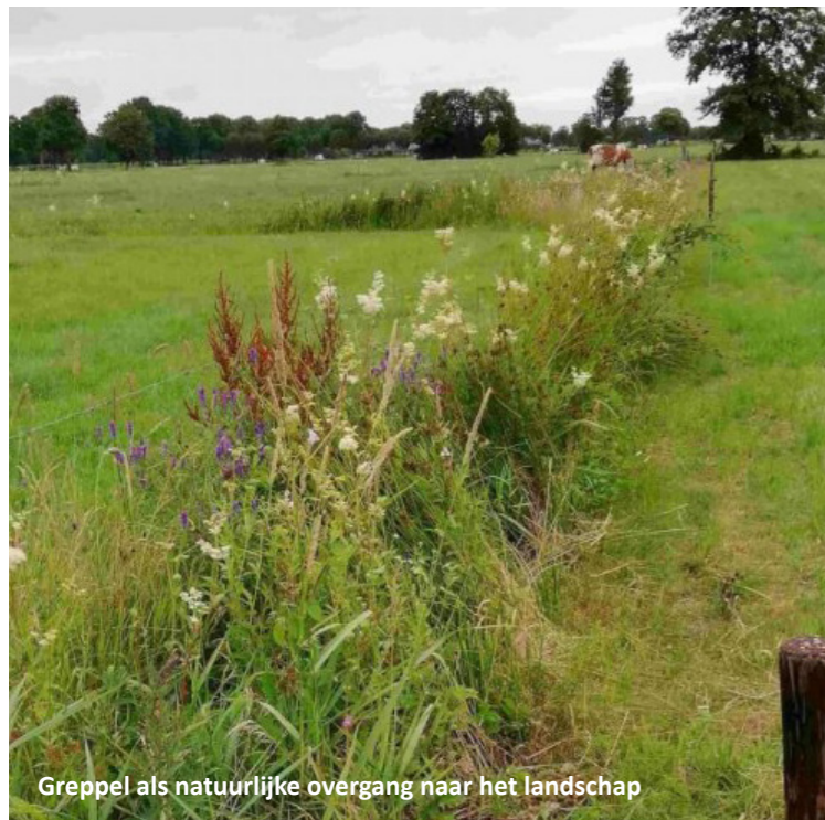
Greppel als natuurlijke overgang naar het landschap