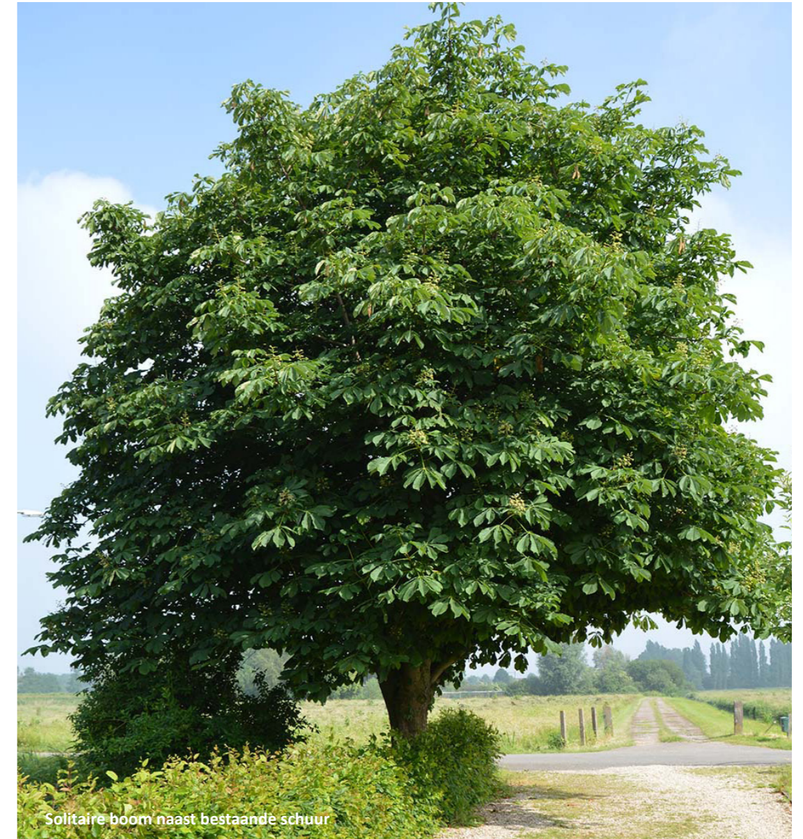
Solitaire boom naast bestaande schuur