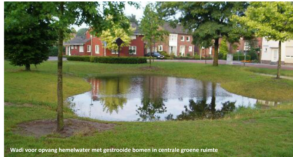
Wadi voor opvang hemelwater met gestrooide bomen in centrale groene ruimte