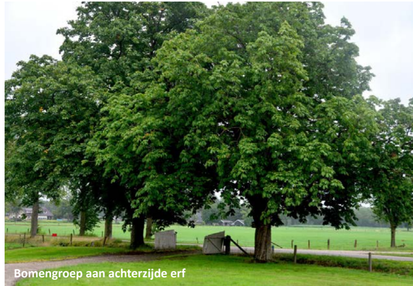
Bomengroep aan achterzijde erf