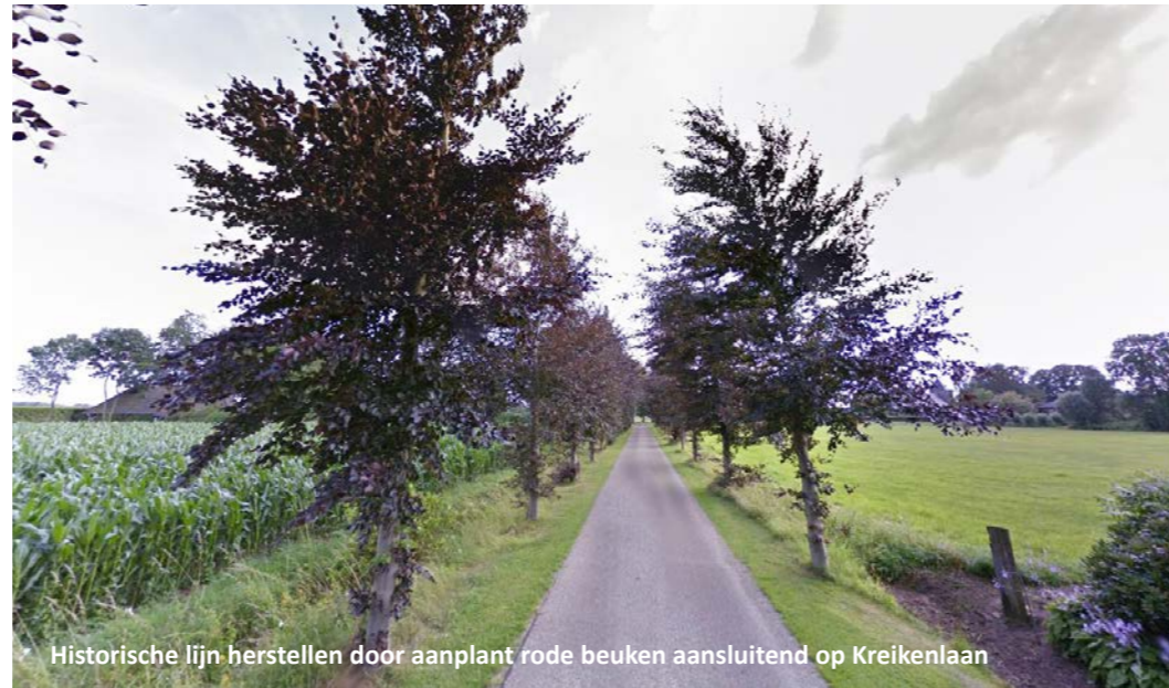
Historische lijn herstellen door aanplant rode beuken aansluitend op Kreikenlaan