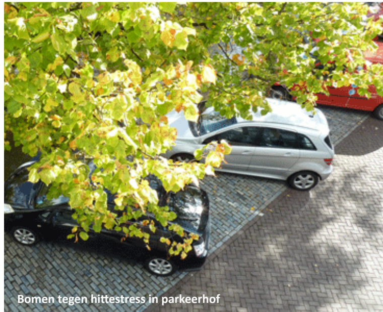
Bomen tegen hittestress in parkeerhof