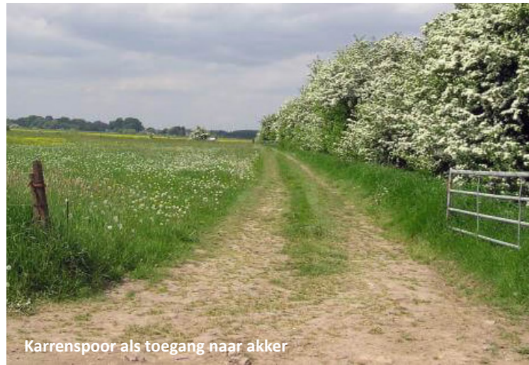
Karrenspoor als toegang naar akker