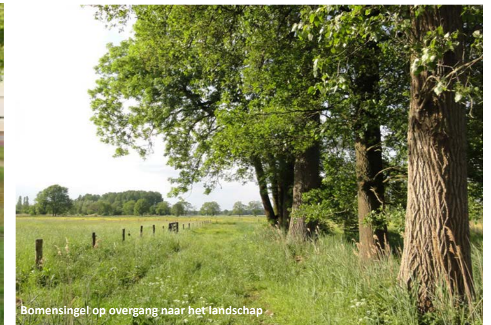
Bomensingel op overgang naar het landschap