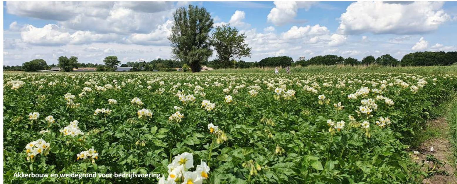
Akkerbouw en weidegrond voor bedrijfsvoering