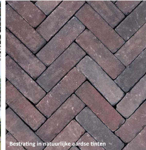
Bestrating in natuurlijke aardse tinten