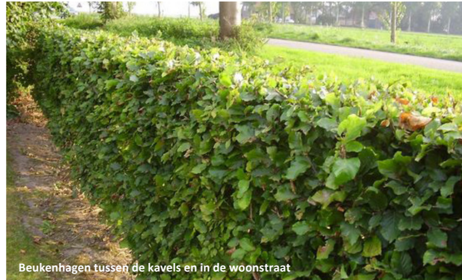
Beukenhagen tussen de kavels en in de woonstraat