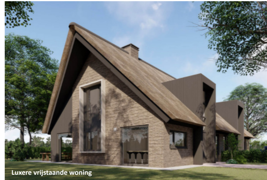
Luxere vrijstaande woning