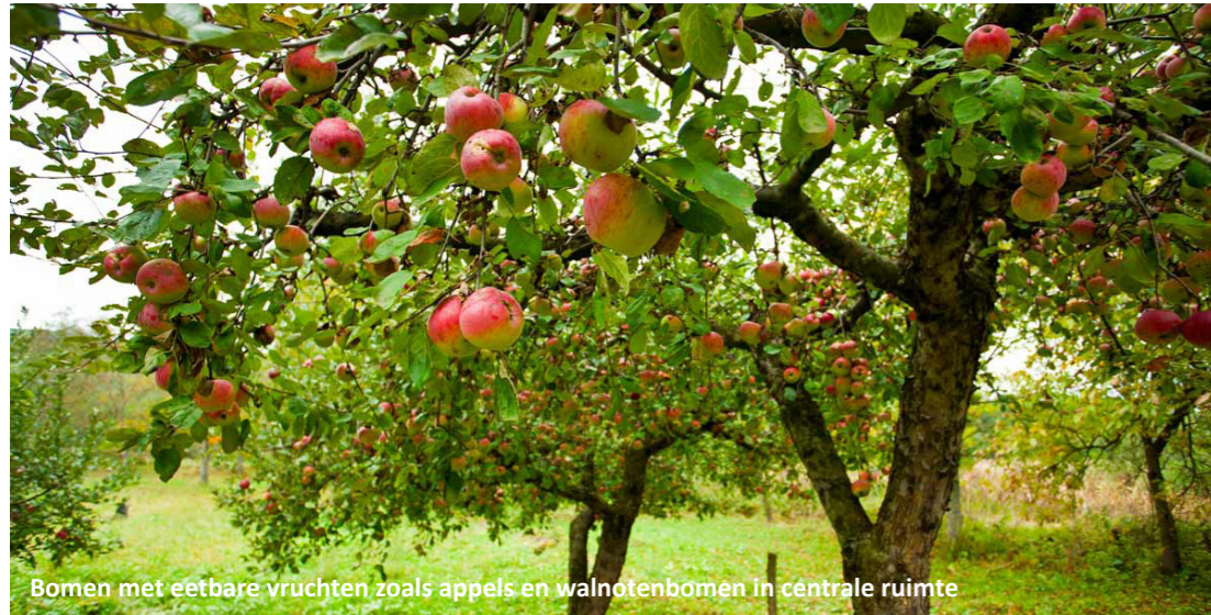
Bomen met eetbare vruchten zoals appels en walnotenbomen in centrale ruimte