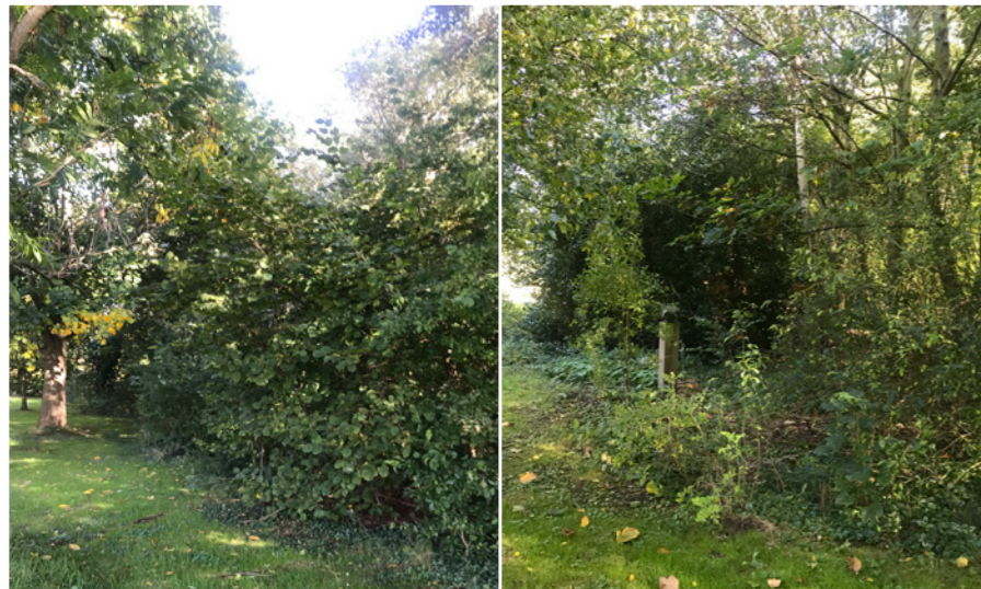
Huidige situatie bosschage.

Aan de zuidzijde van het perceel is een bosschage aangelegd. De bosschage is uitgegroeid tot een dicht beplante rand die tot aan de kavelgrens loopt. Achter de bosschage ligt een watergang welke buiten het eigendom van de grondeigenaar ligt. In de bosschage zijn verschillende soorten en maten plantgoed opgenomen. Belangrijk is om deze variatie te behouden met voornamelijk inheems plantmateriaal. Om er voor te zorgen dat de bosschage vitaal blijft is het van belang om tijdig dunning uit te voeren. Hierdoor blijft de bosschage verjongen en wordt grootschalige uitval voorkomen. Bij dunning is het van belang dat de bodem voldoende licht krijgt om nieuwe uitlopers groeiruimte te geven. Ook kunnen jonge boompjes weer verder uitgroeien tot grotere exemplaren. Door het realiseren van een kruidenrijk gazon ontstaat er aan de voorzijde van de bosschage een kruidenlaag wat ervoor zorgt dat hier een vorm van mantel-zoom vegetatie ontstaat in combinatie met de huidige beplanting.