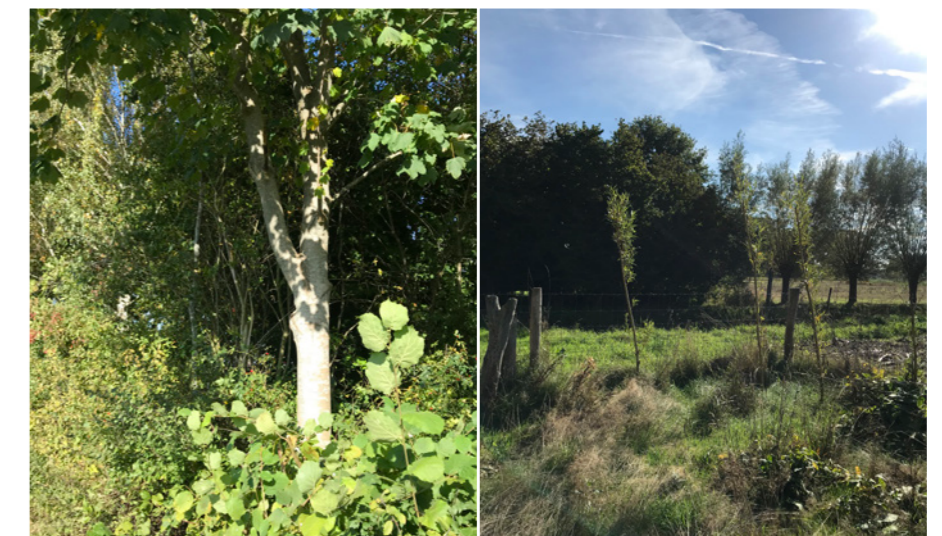
Belangrijk om bomen goed op te kronen om takbreuk te voorkomen.