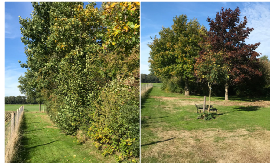
Huidige situatie westzijde dicht.

De westzijde van het perceel grenst aan een agrarisch perceel. Middels een lage transparante afrastering wordt de scheiding gemaakt tussen de kavel en het agrarische perceel. De westzijde heeft een gevarieerd aanzicht van open en gesloten. De noordwestzijde is gesloten met een bosschage van verschillende soorten en maten plantmateriaal. Deze dient behouden en goed beheerd te blijven. Wanneer de bosschage gedunt moet worden, worden eerst de uitheemse en/of minder vitale bomen gekapt. Daarnaast is het belangrijk om er voor te zorgen dat alle kronen van de bomen goed worden gesnoeid om de veiligheid te waarborgen. De zuidwestzijde heeft een wat meer open karakter. Verschillende solitaire bomen geven een klein doorkijkje richting het agrarische landschap met bosrand. De solitaire bomen bestaan uit verschillende soorten zowel inheems als uitheems. Bij uitval dienen enkel inheemse soorten, passend bij de bodem, teruggeplaatst te worden.