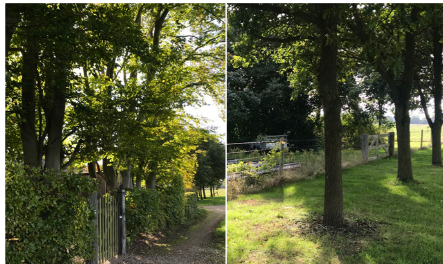
Huidige haag met uitgegroeide beuken.