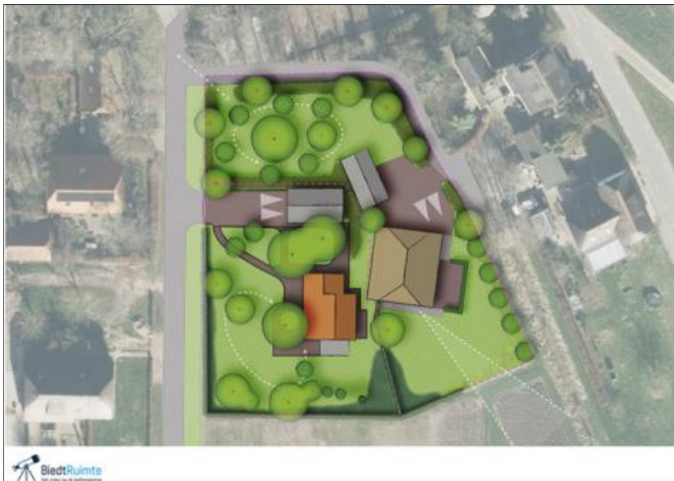
Verbeelding van het wenselijke eindbeeld.

Het voornemen bestaat de historische boerderij te verbouwen tot woning. Deze verbouwing vindt geheel inpandig plaats, al zullen de kozijnen mogelijk ook vervangen worden. Bestaande dakbedekking en windveren worden niet aangetast. Ten noorden van de huidige en beoogde nieuwe woning, worden twee bijgebouwen (garages) gebouwd. Om de bouw van deze garages mogelijk te maken, dient wat tuinbeplanting verwijderd te worden. daarbij gaat het hoofdzakelijk om struiken en vaatplanten, maar mogelijk dient een jonge tamme kastanje gerooid te worden. Beide woningen worden ontsloten via een nieuw aan te leggen erfoprit naar de Veldweg. Op onderstaande afbeelding wordt het wenselijke eindbeeld weergegeven.