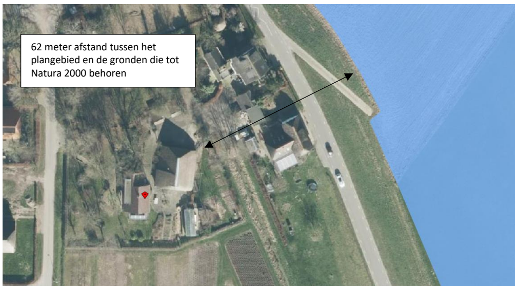
Ligging van Natura 2000-gebieden in de omgeving van het plangebied. De ligging van het plangebied wordt met de blauwe marker aangeduid. Gronden die tot Natura 2000 behoren worden met de okergele en groene kleur aangeduid.