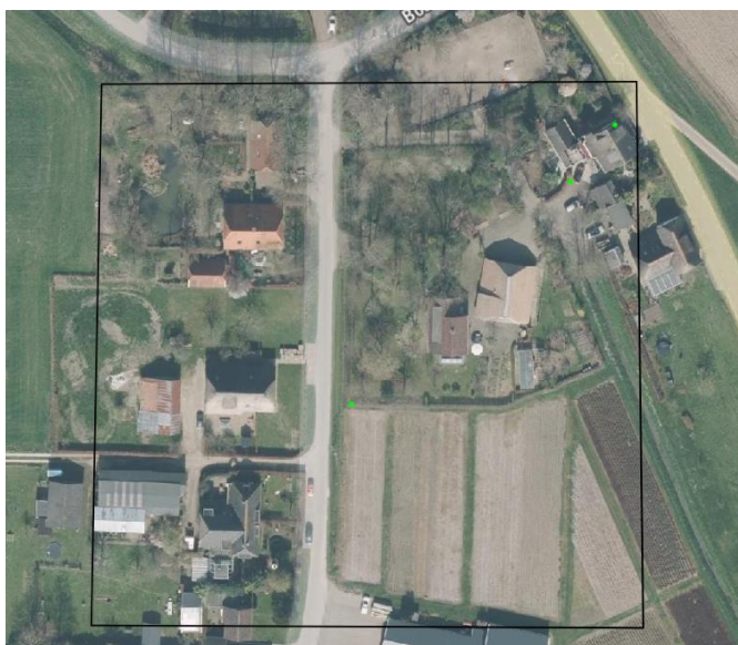
Verspreiding van alle bekende records (groene stip) in en rond het plangebied (bron: NDFF).

Op 20 februari 2023 is de NDFF geraadpleegd en is gekeken of waarnemingen van beschermde planten en dieren in en naast het plangebied aanwezig zijn in de databank. Uit de bureaustudie (bronnenonderzoek & NDFF) zijn geen veldbiologische gegevens naar voren gekomen die bruikbaar zijn voor deze studie. Er zijn in de NDFF geen waarnemingen bekend die een relatie hebben met het plangebied. Wel zijn drie waarnemingen opgenomen van vogels (2 waarnemingen) en vaatplanten (1 waarneming). Een uitputtende opsomming van alle waargenomen beschermde planten en dieren, in een ruimer zoekgebied wordt niet noodzakelijk geacht voor deze studie.