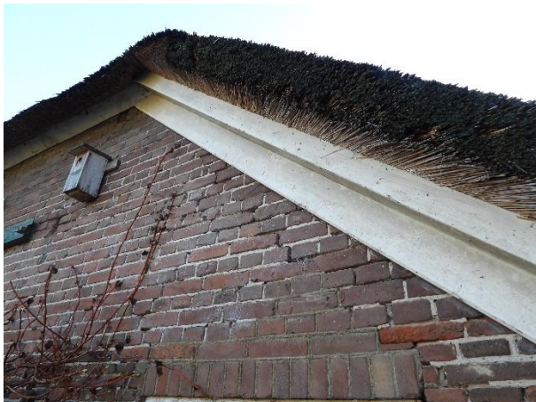
Nestkast aan historische boerderij. Potentiële nestplaats voor onder andere koolmees, pimpelmees en bonte vliegenvanger.

Het plangebied behoort tot functioneel leefgebied van verschillende vogelsoorten. Vogels benutten het plangebied als foerageergebied en vermoedelijk nestelen er jaarlijks vogels in het plangebied. Vogels kunnen een nestlocatie bezetten in de bebouwing, bomen, struiken, dichte vegetatie op de grond en in nestkasten.