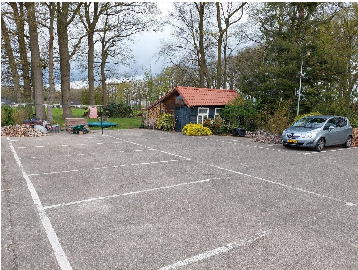
Afbeelding 3: Te saneren parkeerplaats, situatie op 26 april 2023.