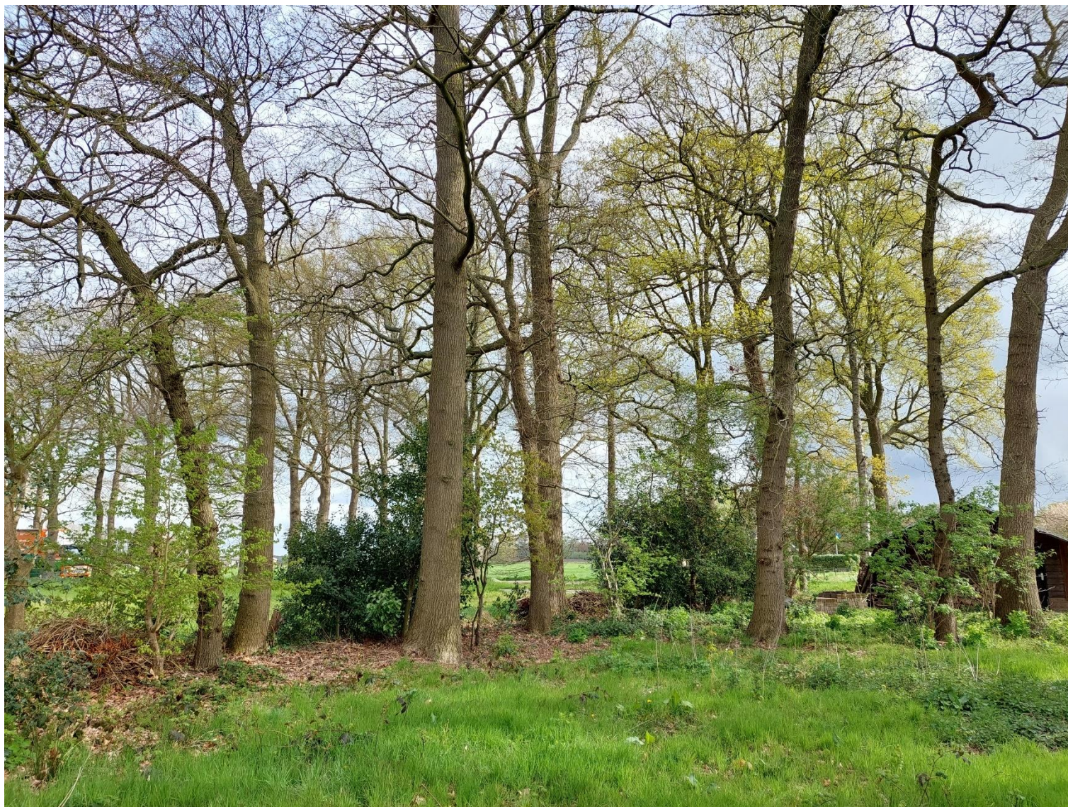
Afbeelding 4: De aanwezige houtsingel, situatie op 26 april 2023.