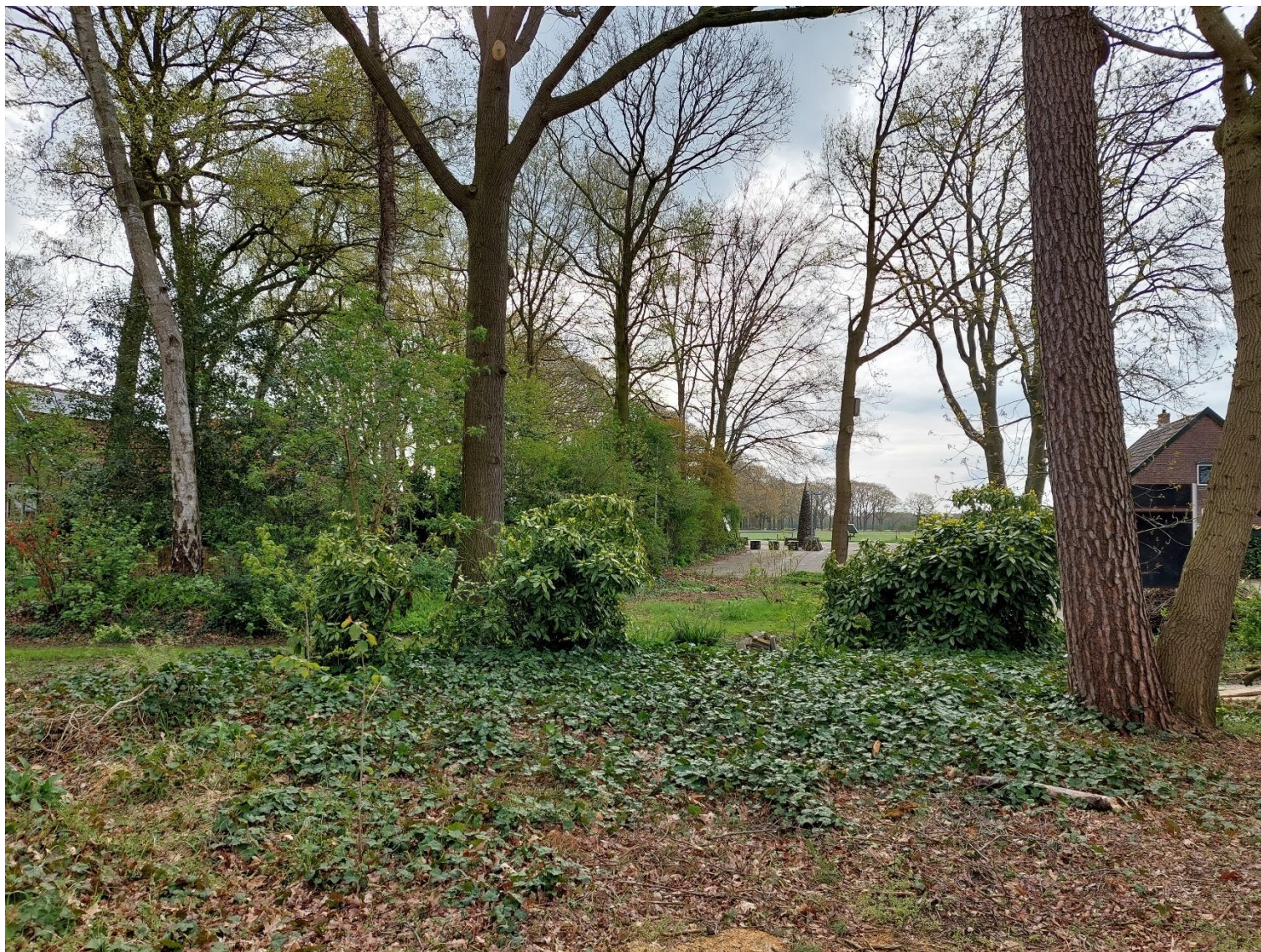
Afbeelding 5: De aanwezige houtsingel, situatie op 26 april 2023.