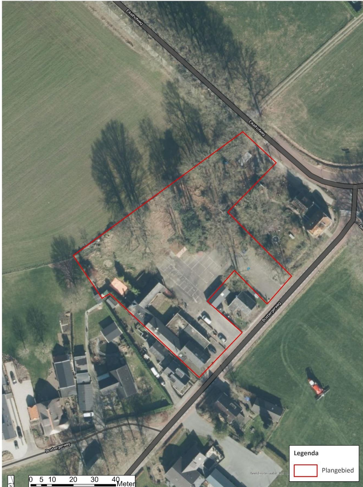
Afbeelding 2: Luchtfoto van het plangebied (ESRI, 2023).