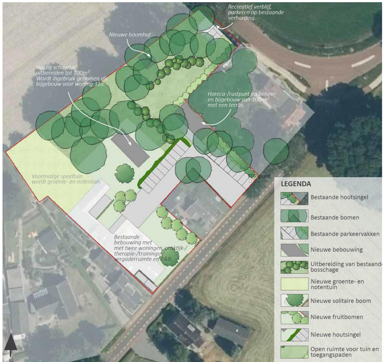
Afbeelding 6: Weergave van de beoogde ontwikkelingen.

Doordat het erf op een andere manier wordt ingedeeld en een andere functie aanneemt dan het voormalige horecabedrijf De Lepelaar zijn een aantal voorzieningen overbodig. De initiatiefnemer is voornemens de betonnen speelplaats, een gedeelte van de geasfalteerde parkeerplaatsen en een gedeelte van het verharde erf te verwijderen. Het is de wens van de initiatiefnemer om de recreatieve functie op een kleinschaliger niveau te behouden. De beoogde ontwikkelingen staan weergegeven in Afbeelding 6. Verder worden er binnen het plangebied geen opgaande beplanting (bomen of struiken) weggehaald. Tevens worden er geen wijzigingen doorgevoerd aan de verlichting van het plangebied.