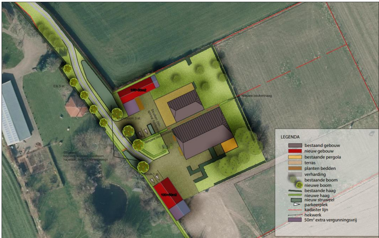
Verbeelding van het wenselijk eindbeeld.

Het voornemen bestaat om twee nieuwe bijgebouwen in het plangebied te realiseren en de bestaande schuur te slopen. Er wordt geen beplanting of verharding verwijderd. Het plangebied wordt nadien landschappelijk ingepast, middels aanplant van nieuwe bomen (linde en beuk), struweel en een nieuwe haag. Op onderstaande afbeelding is een verbeelding van het wenselijk eindbeeld weergegeven.