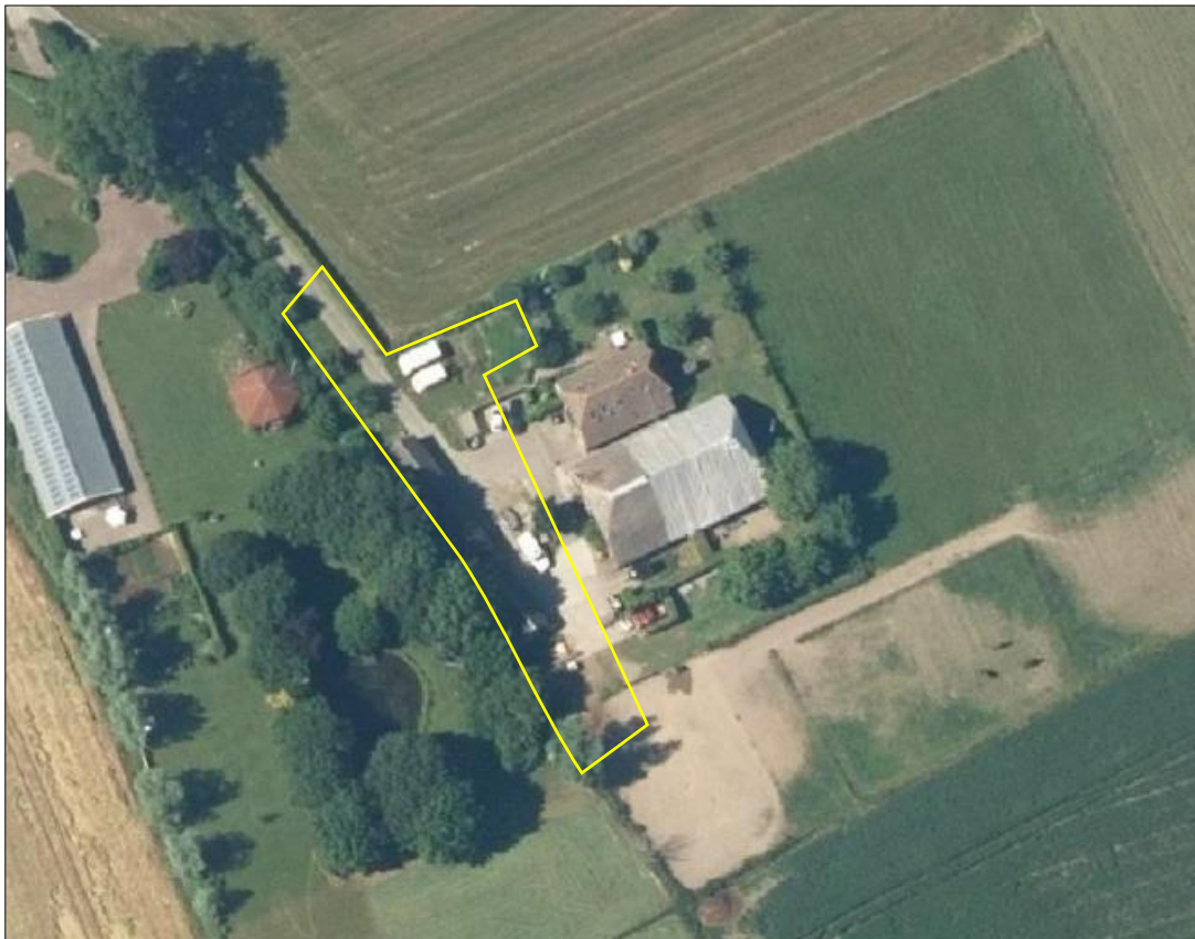
Begrenzing van het plangebied; deze wordt met de gele lijn aangeduid.

Het plangebied bestaat uit een kapschuur, beplanting, verharde weg, gazon en erfverharding. De kapschuur vormt afsluitbare garageboxen en een binnenverblijf voor paarden en is volledig van hout en gedekt golfplaten. De beplanting bestaat uit enkele loofbomen, welke aan de overzijde van de weg staan t.o.v. het erf. In het plangebied liggen spullen/materialen verspreid in de buitenruimte (o.a. pallets, stenen en plastic). Op onderstaande luchtfoto is de begrenzing van het plangebied aangegeven. Voor een verbeelding van de huidige situatie wordt verwezen naar de fotobijlage.