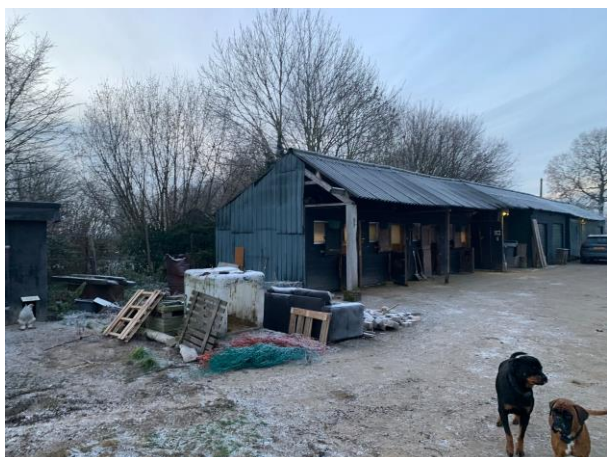
Amfibieën kunnen een (winter)rustplaats bezetten onder spullen/materialen in de buitenruimte.

Tijdens het veldbezoek zijn geen amfibieën waargenomen, maar gelet op de inrichting en het gevoerde beheer, wordt het plangebied als functioneel leefgebied voor sommige algemene en weinig kritische amfibieënsoorten beschouwd. Amfibieën als bruine kikker en gewone pad benutten het plangebied als foerageergebied en mogelijk bezetten ze er een (winter)rustplaats. Deze soorten kunnen een (winter)rustplaats bezetten onder spullen/materialen verspreid in de buitenruimte. De kapschuur is voor amfibieën toegankelijk maar wordt niet beschouwd als geschikte (winter)rustplaats. De kapschuur vormt een binnenverblijf voor paarden en er liggen geen spullen/materialen o.i.d. in verspreid welke een geschikte (winter)rustplaats vormen. Het plangebied wordt niet als functioneel leefgebied van zeldzame amfibieënsoorten als kamsalamander, rugstreepad of poelkikker beschouwd. Geschikt voortplantingsbiotoop ontbreekt in het plangebied.