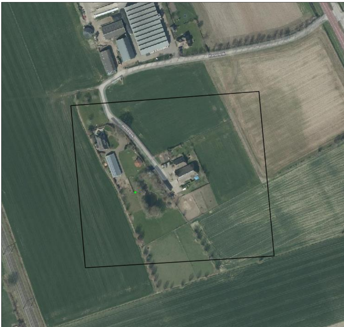
Verspreiding van alle bekende records in het plangebied.

Op 23 juni 2023 is de NDFF geraadpleegd en is gekeken of waarnemingen van beschermde planten en dieren aanwezig zijn in de databank. In een ruime begrenzing van het zoekgebied rondom het plangebied, is 1 waarneming bekend in de NDFF. Voor de verspreiding van de waarnemingen, zie luchtfoto onder.