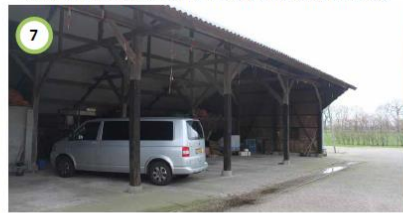
Huidige houten kapschuur handhaven en splitsen voor de twee te creëren woningen in de bestaande boerderij.