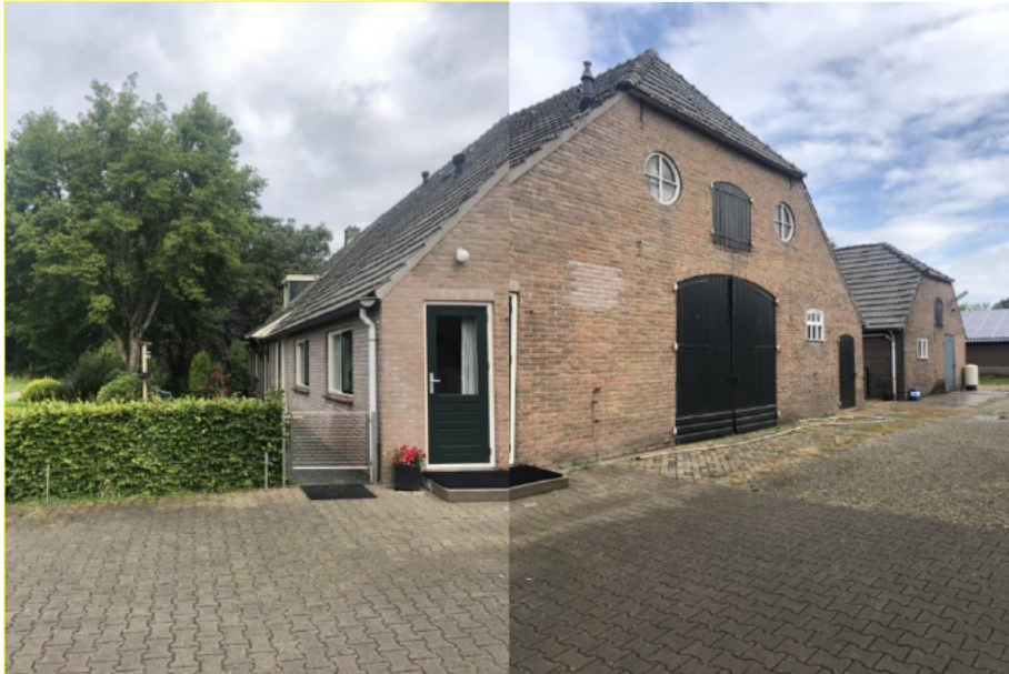
Afbeelding 3. Tweedelige woonboerderij, situatie 26-07-2023