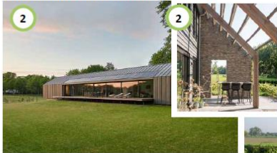
Vlonderterras aan de zijkant van de woning met uitzicht over het landschap.