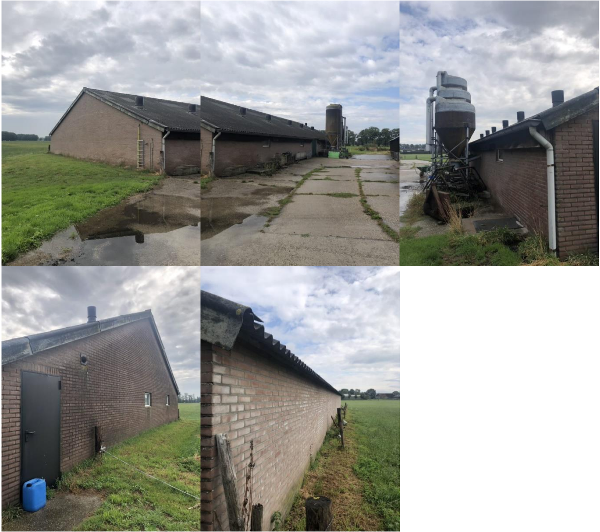
Afbeelding 6. Varkensschuur aan oostkant van het erf, situatie op 26-07-2023.