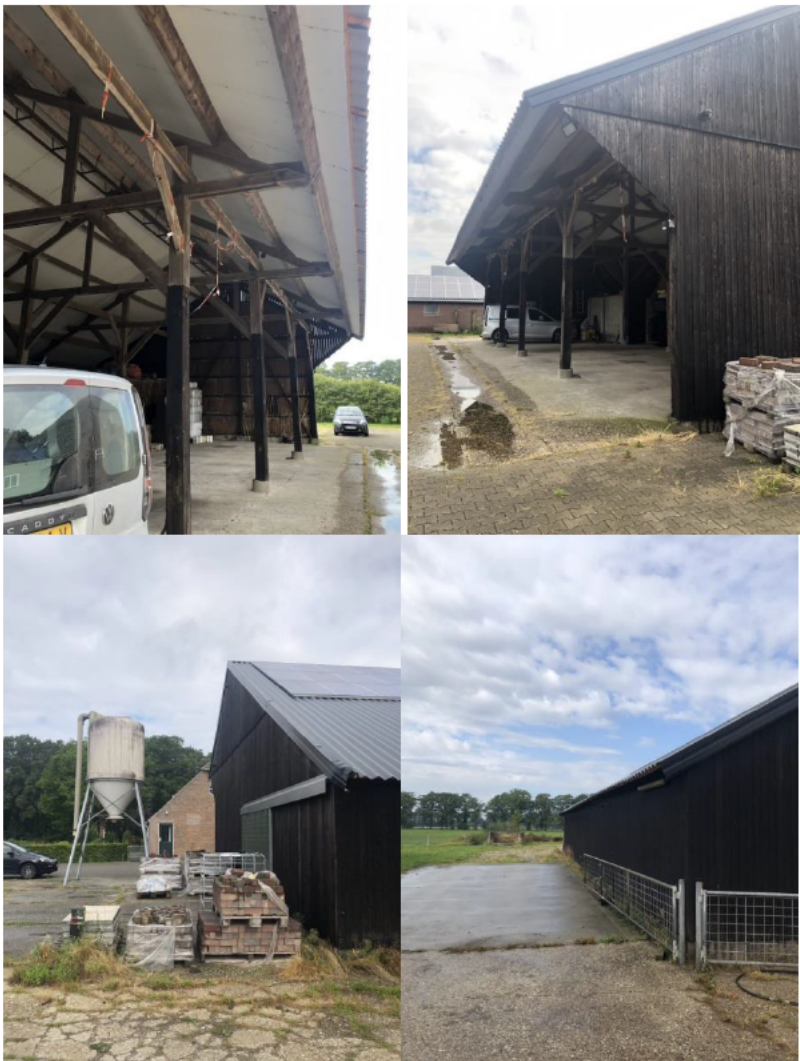
Afbeelding 4. Te behouden kapschuur, situatie 26-07-2023.