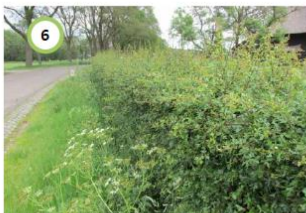
Bestaande siertuin in voortuin in stand houden en eventueel nieuwe meidoornhaag rondom aanplanten voor afscherming.