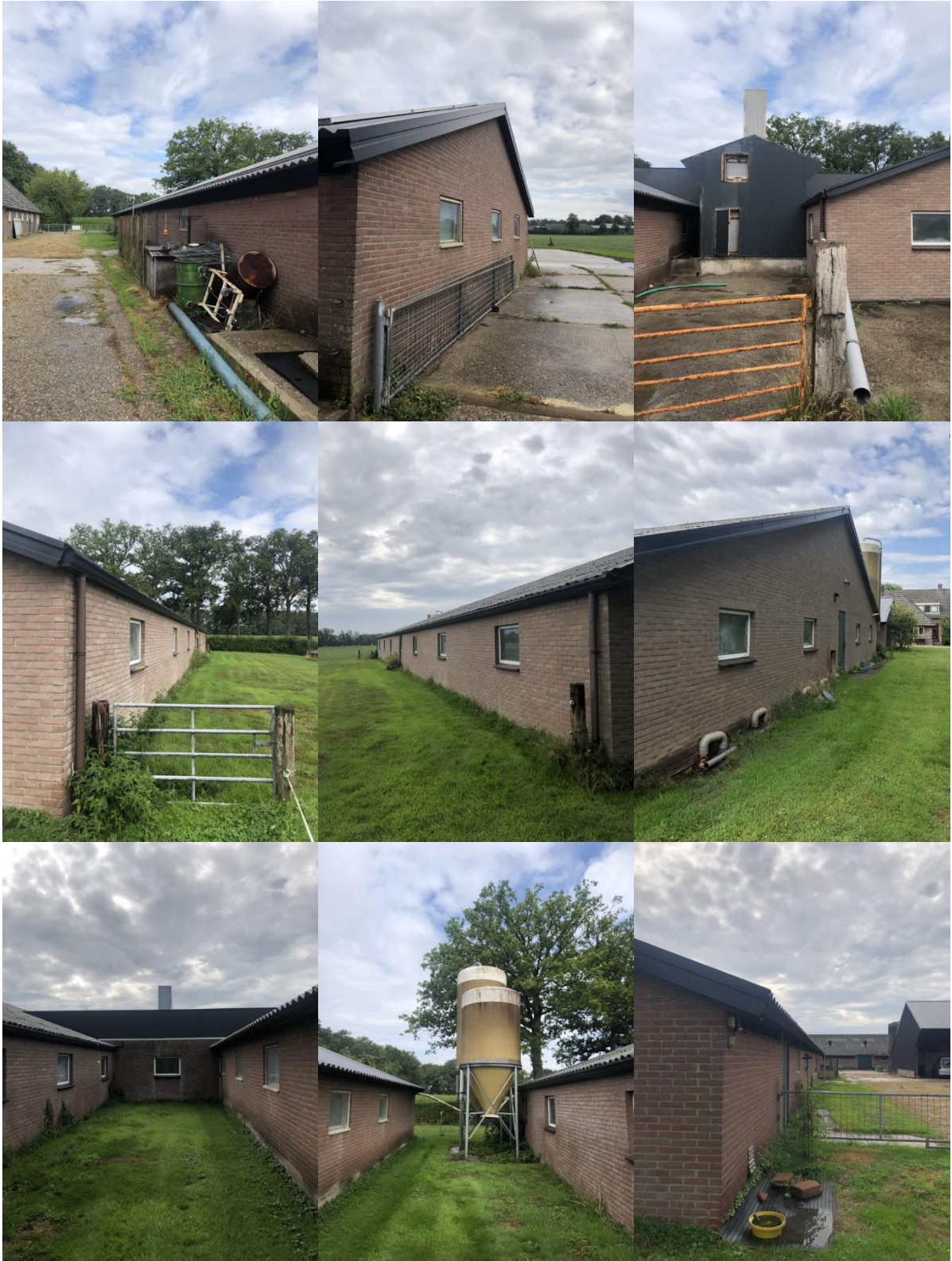
Afbeelding 5. Tweedelige varkensschuur, situatie op 26-07-2023.