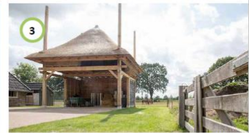
Nieuwe hooischuur functioneerd als carport voor stalling auto's van nieuwe woning.