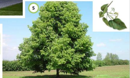
Aanplant markante solitaire koningslinde bij nieuwe woning.