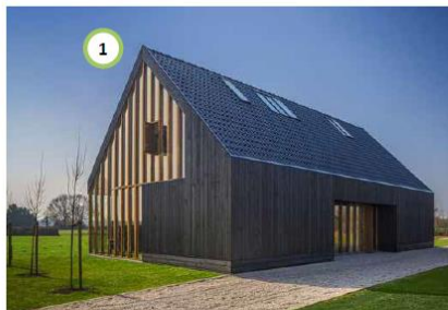
Nieuwe schuurwoning eventueel met rieten kap.