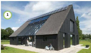
Nieuwe schuurwoning met veranda terras en zicht op de dijk.