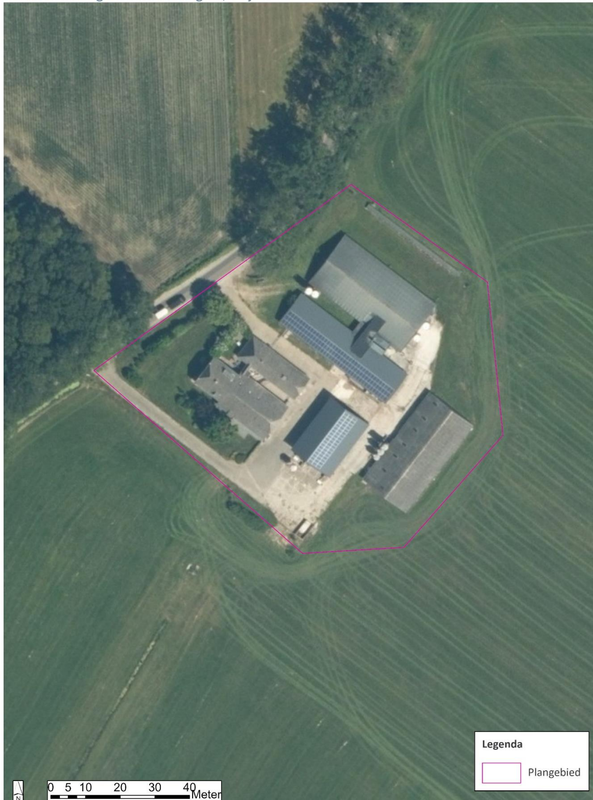
Afbeelding 2. Luchtfoto plangebied.