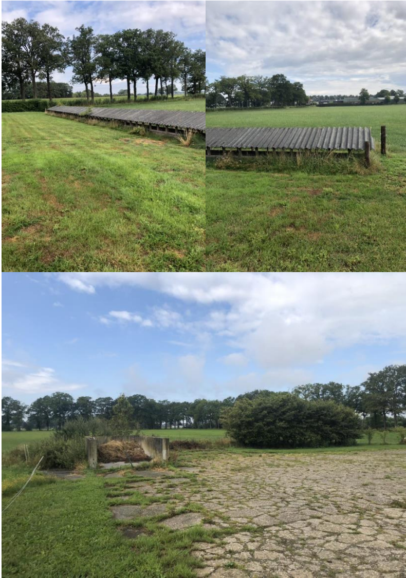
Afbeelding 7. Overige objecten op het erf, situatie op 26-07-2023.