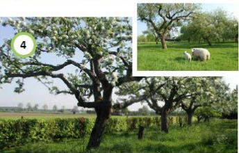
Aanleg hoogstamfruitbomgaardje met haag in voortuin nieuwe woning.