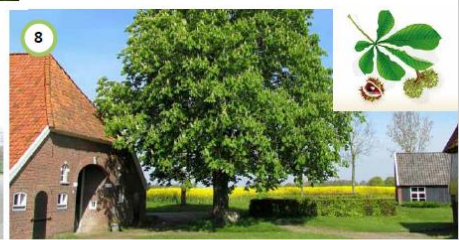
Nieuwe paardenkastanje bij entree en aan de rand van het erf. Landschappelijke inpassing De Wenberg 3 te Wijhe | Eelerwoude | 5