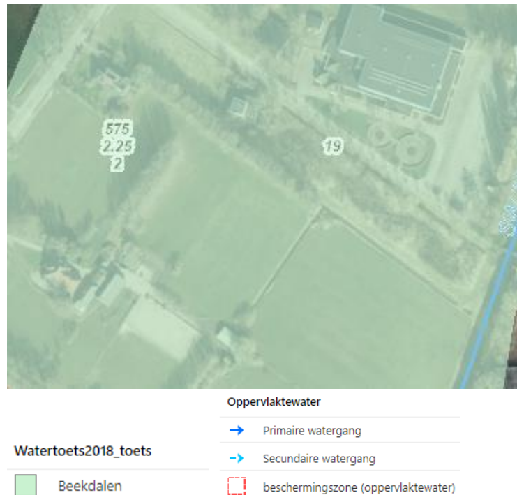
Figuur 1 - Kaartbeeld bestaande waterhuishouding rond het plangebied.

Het plan ligt in het (deel)stroomgebied Sallandse Weteringen. Rond het plangebied liggen A WATERGANGEN die WDO Delta beheert. Het peilgebied bevat één peilvak(ken) en heeft een maximumpeil van NAP 2.25 m. Dit peil is de instelhoogte bij een peilscheidend kunstwerk. Lokaal kunnen er verschillen optreden in het peil, afhankelijk van de afstand tot de instelhoogte.