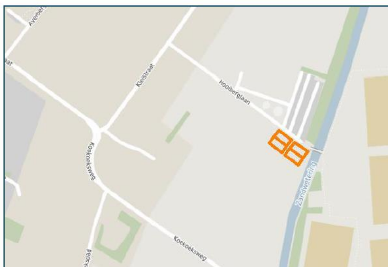
Figuur 1 Ligging locatie Hooiberglaan te Olst

Door de gemeente Olst-Wijhe is een woonbehoefteonderzoek uitgevoerd, mede naar aanleiding van de uitspraak van het College voor de Rechten van de Mens waarin is aangegeven dat lokale overheden de cultuur van woonwageneigenaren dienen te beschermen. Gemeenten moeten hun woonwageneigenaren binnen redelijke termijn helpen aan een standplaats, als uit onderzoek blijkt dat hieraan behoefte bestaat. Het woonbehoefteonderzoek toonde destijds aan dat die behoefte er is onder de zogenaamde spijtoptanten; woonwageneigenaren die terug willen keren naar een woonwagen in de gemeente Olst-Wijhe, maar waarvoor nu geen standplaats beschikbaar is. In totaal is behoefte aan acht standplaatsen. Er is nog één bestaande standplaats beschikbaar. Daarnaast worden er twee locaties ontwikkeld. Vier nieuwe standplaatsen bij de Hooiberglaan te Olst en een uitbreiding met drie standplaatsen bij Het Anem te Wijhe.