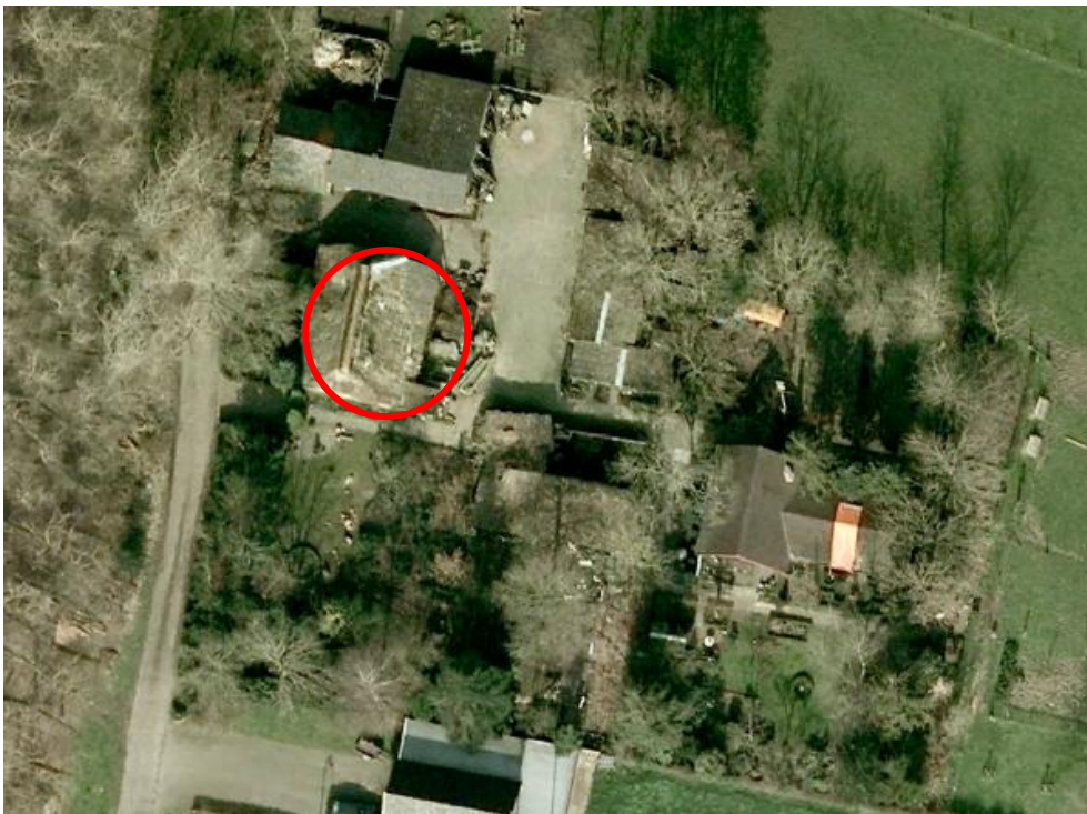
Figuur 2. Luchtfoto plangebied met situering karakteristieke gebouw

Op het perceel is een aantal schuren en een woning aanwezig. Het karakteristieke gebouw dat verbouwd gaat worden tot woning is gesitueerd ten noorden van de bestaande woning.