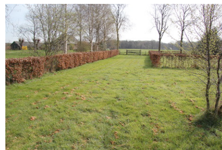
Figuur 1-4. Erf van de Wechterholt 35 met rechtsom de achterzijde van de boerderij, het interieur van de deel, de beoogde tweede oprit aan de noordzijde en de beoogde locatie voor de schuur in de noordwesthoek.