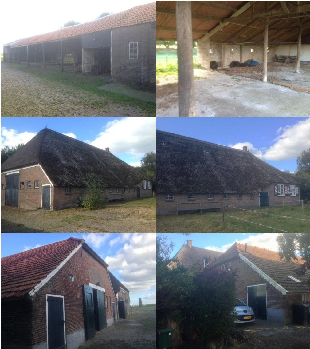
Afbeelding 2. Foto's impressie plangebied