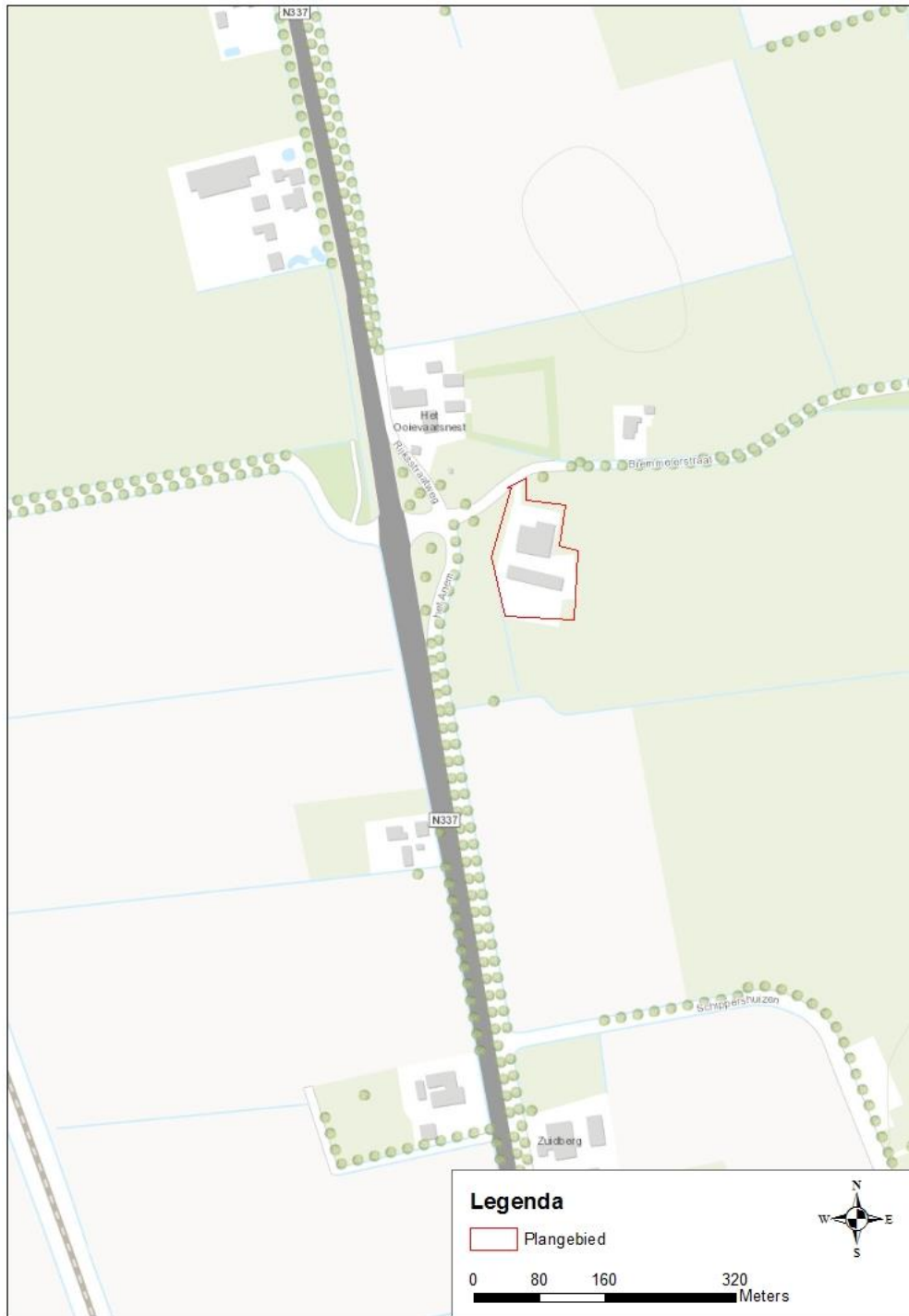
Afbeelding 1. Ligging plangebied