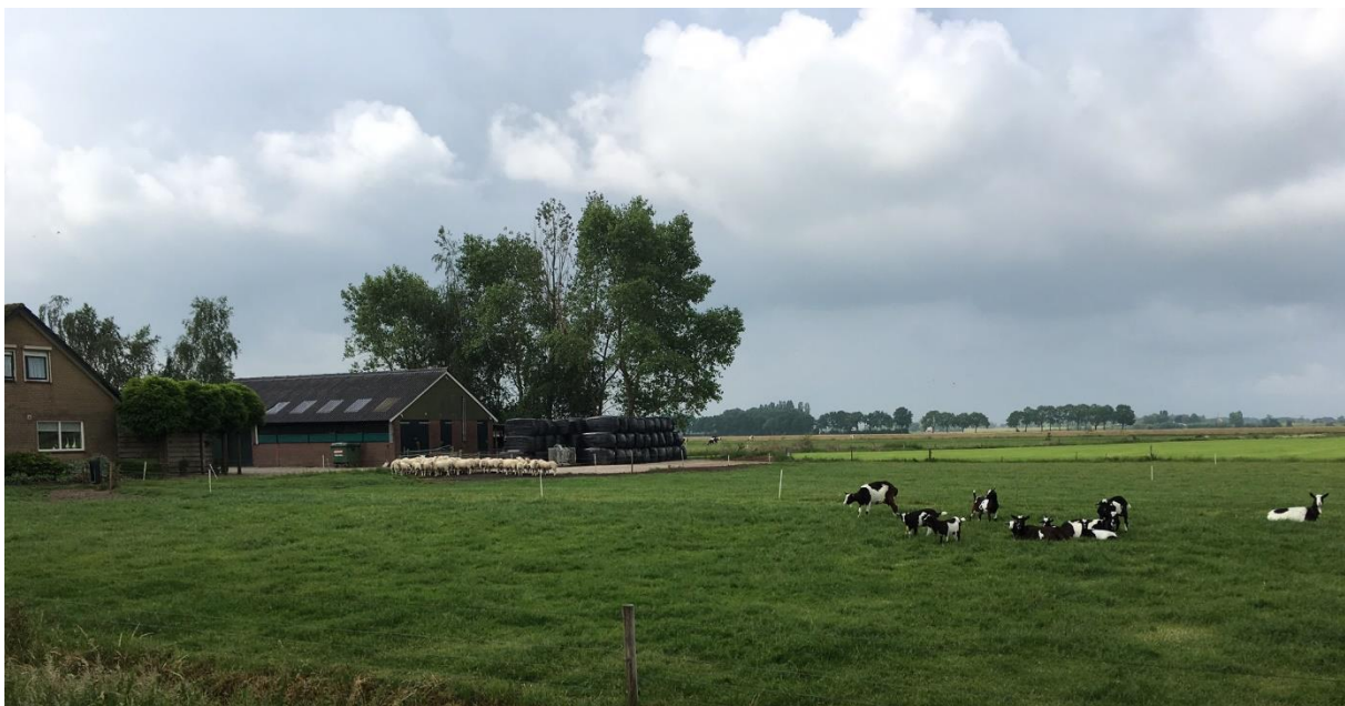
Foto van de bestaande huisvesting en ruwvoeropslag