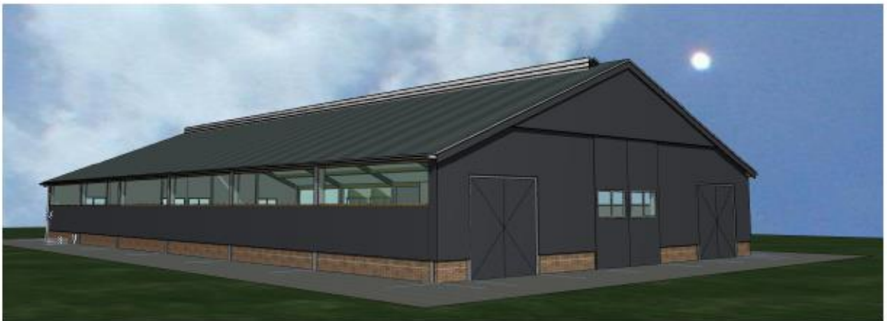
Ontwerp nieuwe stal (bron: Bouwtektuur Schetsontwerp Bouw veestal; 01.07.2016)