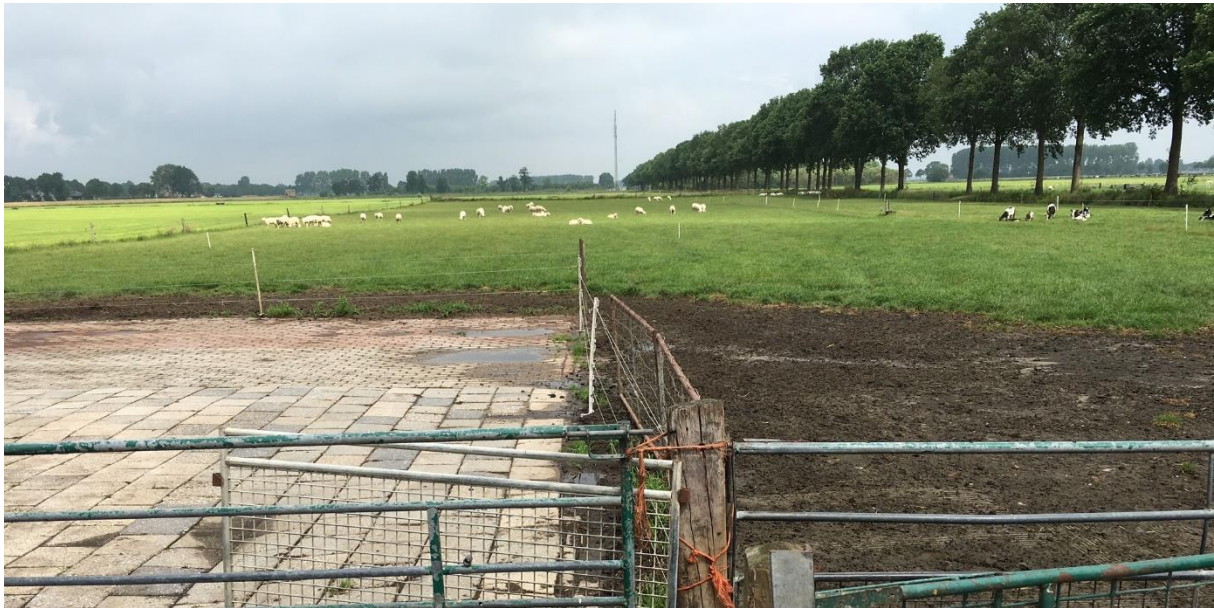
Foto: aanwezige grond voor de schapen