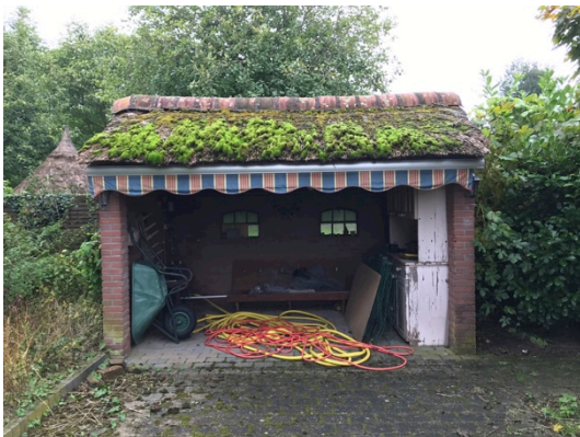
Overkapping met opslag