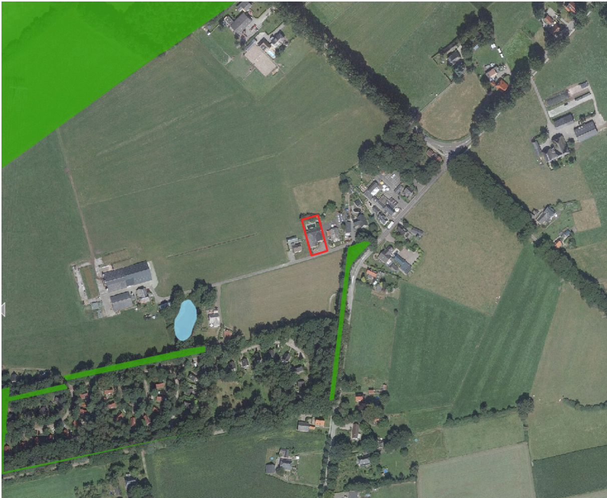
Afbeelding 2, Plangebied: rood, NNN: groen

Het is niet te verwachten dat de ruimtelijke ontwikkeling een negatief effect heeft op de NNN. Een negatief effect is op voorhand uit te sluiten.