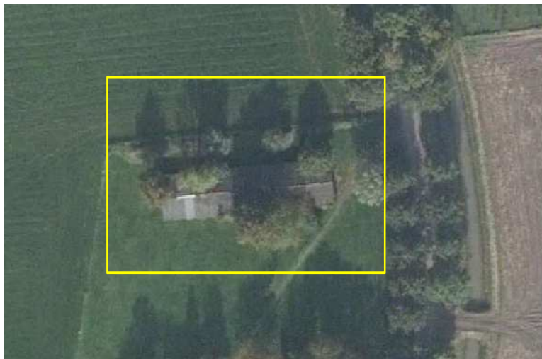
Detailweergave en begrenzing van het plangebied. De begrenzing van het plangebied wordt aangeduid met de gele lijn.

Het plangebied vormt een deel van een bestaand erf en bestaat uit bebouwing, opgaande beplanting, gazon en agrarische cultuurgrond. De agrarische cultuurgrond was tijdens het veldbezoek in gebruik als grasakker en wordt intensief agrarisch gebruikt. De vegetatie bestaat uit een monocultuur van raigras. In het plangebied staat een bakstenen stal welke gedekt is met golfplaten. De stal beschikt niet over een spouw of muurisolatie. Ook beschikt de stal niet over dakisolatie. De stal is gedeeltelijk overwoekerd door heder (klimop). Aan weerszijde van de stal staan enkele loofbomen, waaronder enkele zomereiken, en hoogstam fruitbomen.