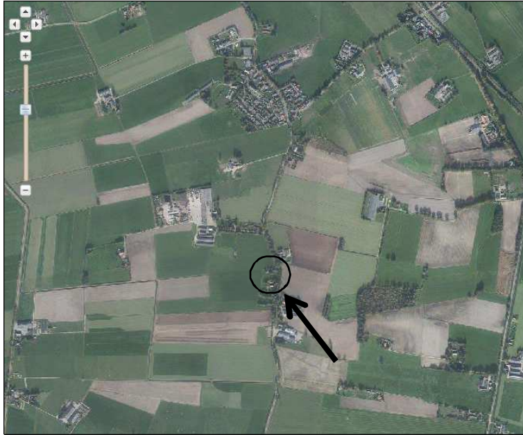
Globale ligging van het plangebied. De ligging van het plangebied wordt met de cirkel aangeduid.

Het plangebied is gesitueerd aan de Lierderholthuisweg 11 te Wijhe. Het ligt in het buitengebied, circa 650 meter ten zuiden van de woonkern Lierderholthuis. Op onderstaande uitsnede van de topografische kaart wordt de globale ligging van het plangebied aangeduid met de cirkel.