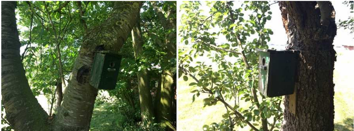
Enkele vogelnestkastjes in het plangebied.

Indien de stal gesloopt wordt en de beplanting gerooid wordt tijdens de voortplantingsperiode, worden mogelijk bezette vogelnesten beschadigd en vernield. De functie van het plangebied als foerageergebied wordt door uitvoering van de voorgenomen activiteiten niet aangetast.