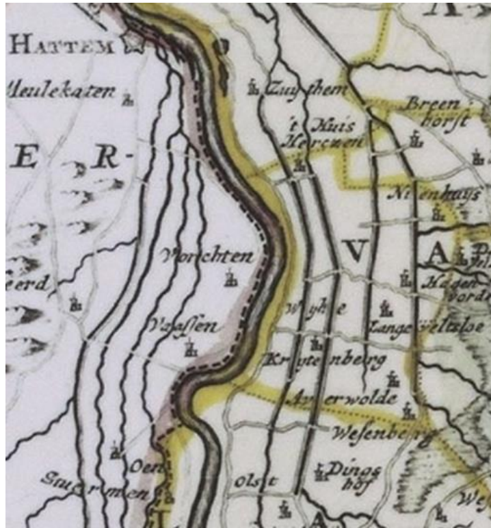
Uitsnede historische kaart Salland 1757

Het landschap ter plaatse kenmerkt zich door openheid. In de jaren vijftig tot zeventig van de vorige eeuw waren veel percelen in gebruik voor fruitteelt. Tegenwoordig zijn er afwisselend melkvee houderijen en burgerwoningen. Waarschijnlijk heeft er voor de boerderij een formele omhaagde tuin gelegen. De typische erfelementen zoals de moestuin siertuin en fruitgaard zijn niet meer aanwezig. Aan de oostzijde bevindt zich een aantal (knot)wilgen welke mogelijk zijn voortgekomen uit de teelt van wilgentenen welke werden gebruikt voor het maken van manden en korven. De boerderij bevindt zich op een natuurlijk ontstane terp. Het is een open gebied met prachtige vergezichten. De hoge ligging met relatief weinig hoge beplanting benadrukt dit.