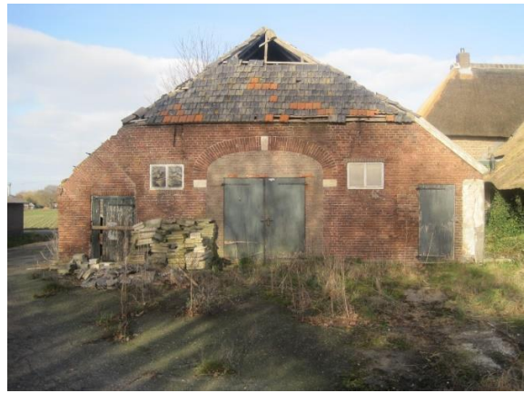
Foto, te slopen en her te bouwen schuur