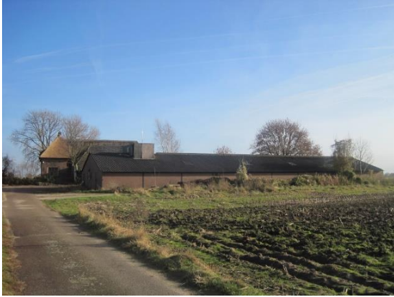
Foto, te slopen ligboxen stal