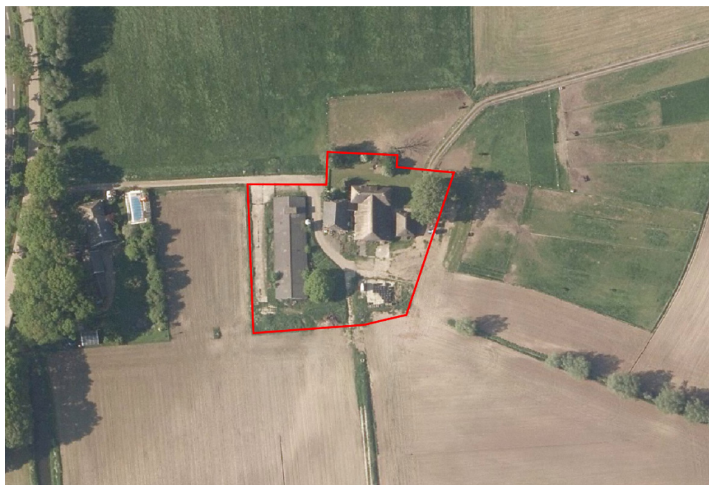
Figuur 2. Luchtfoto plangebied met erfgrrens (rood).

Het plangebied wordt gevormd door het erf van een voormalig agrarisch bedrijf (fig. 2). Op het erf staan een boerderij met deel en een geschakelde stal uit 1920. De geschakelde stal verkeert in slechte staat en is deels ingestort. Ten oosten van de woning staat een schuur/garage van recente datum. Aan de westzijde van het erf staat een ligboxenstal uit 1970 met daarnaast een mestkelder die bovengronds de verschijning heft van een lange betonplaat. Aan de zuidkant van het erf ligt een verharding die de fundering vormden van een verdwenen schuur. Ten noorden van de woning is het erf ingericht als reguliere tuin. De rest van het erf is verhard of begroeid met ruigte. Opgaande begroeiing is schaars. In de tuin is enig struweel en jonge bomen aanwezig en ten oosten van de woning staan twee oudere populieren. Langs de oostzijde van de ligboxenstal staan enkele jonge bomen en struiken en een oudere eik. Het erf wordt omringd door maisakkers en grasland. Op het erf is geen oppervlaktewater aanwezig. Ten zuidwesten van het erf liggen op enige afstand ervan twee kleine kavelsloten.