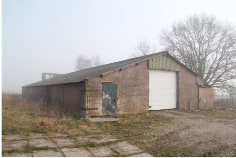
Fig. 3. Te slopen ligboxenstal aan de westzijde van het erf.