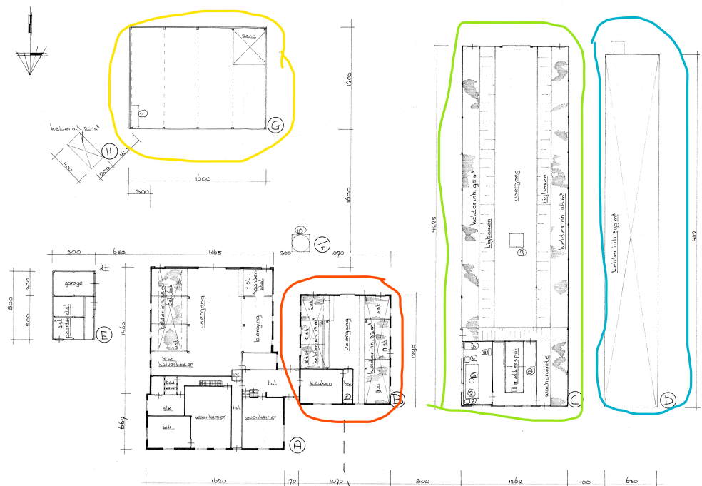
Fig. 6. Te slopen onderdelen met in geel de fundering van een voormalige schuur, in rood de jongveestal, in groen de ligboxenstal en in blauw de mestkelder.

Het voornemen bestaat om het erf in drieën te splitsen. Hiervoor worden in de bestaande woning twee wooneenheden gecreëerd en op de locatie van de ligboxenstal een derde (nieuwbouw)woning met bijgebouw gerealiseerd (zie bijlage II). De bedrijfsgebouwen worden gesloopt (fig. 6).