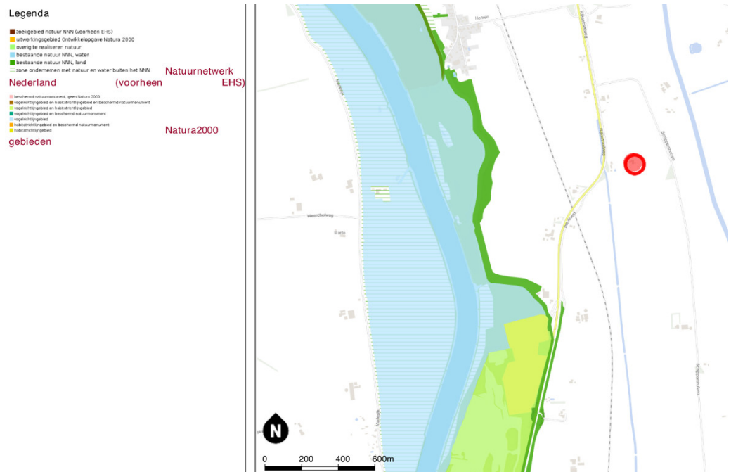
Fig. 7. Ligging plangebied (rood) t.o.v. beschermde natuurgebieden.

Het plangebied ligt in het buitengebied van Wijhe en is geen onderdeel van beschermde gebieden (fig. 7). Het buitendijkse gebied van de IJssel is onderdeel van het Nederlands Natuurnetwerk (NNN) en Natura 2000-gebied Rijntakken. De kortste afstand tot de gebieden bedraagt circa 800 meter.