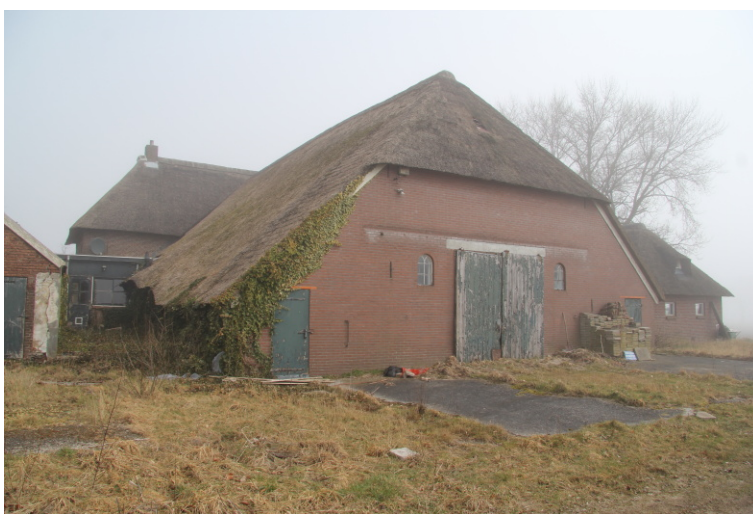
Fig. 5. Te verbouwen deel van de woning.