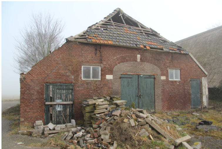
Fig. 4. Te slopen jongveestal naast de woning.