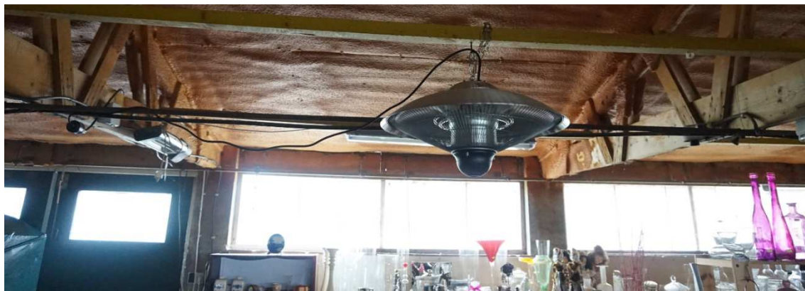
Figuur 5.1 Met isolatieschuim afgewerkt plafond (rechtstreeks tegen golfplaten) in kringloop schuur.

In de omgeving van het plangebied zijn in de NDFF waarnemingen bekend van gewone dwergvleermuis, ruige dwergvleermuis en laatvlieger. Verblijfplaatsen van deze of andere gebouwbewonende soorten worden ter plaatse niet verwacht. De daken van de te slopen schuren zijn geheel afgewerkt met een laag isolatieschuim (zie ook figuur 5.1). De muren zijn voorzien van isolatie in de vorm van isolatiekorrels en het ontbreekt verder aan invliegopeningen.