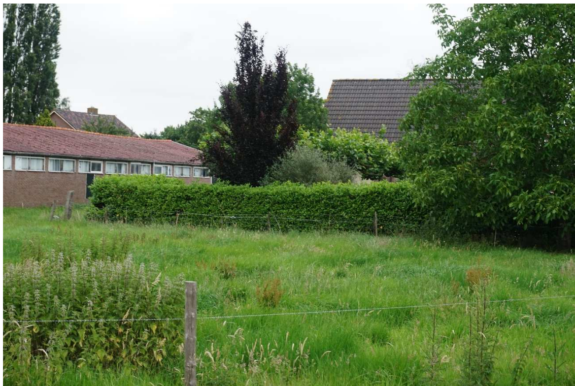
Figuur 2.4 Weilandje achter woning, noordelijke schuur op achtergrond.