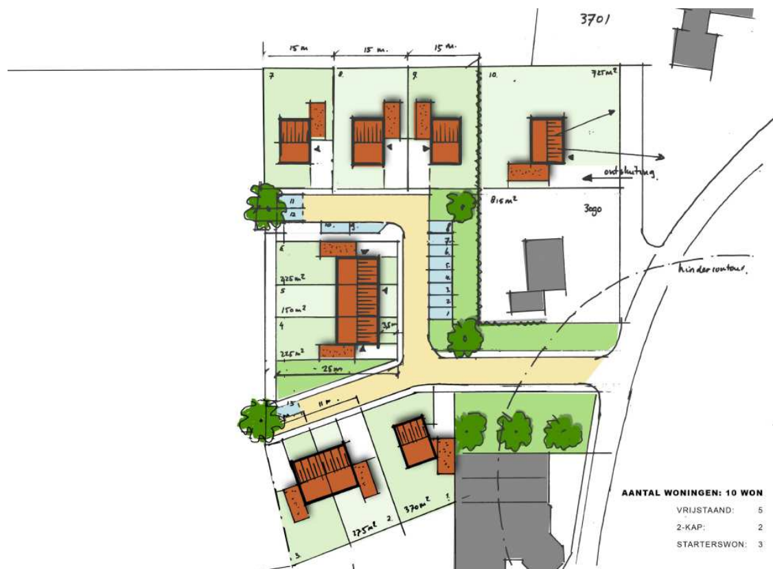
Figuur 2.6 Stedenbouwkundig plan.

De opdrachtgever is voornemens om de twee voormalige pluimveeschuren te slopen. Het erf wordt verder geheel ontmanteld en ter plaatse worden woningen gerealiseerd (zie ook figuur 2.6). De bestaande bedrijfswoning en een deel van de achtertuin worden in het nieuwe plan ingepast en blijven derhalve gehandhaafd.