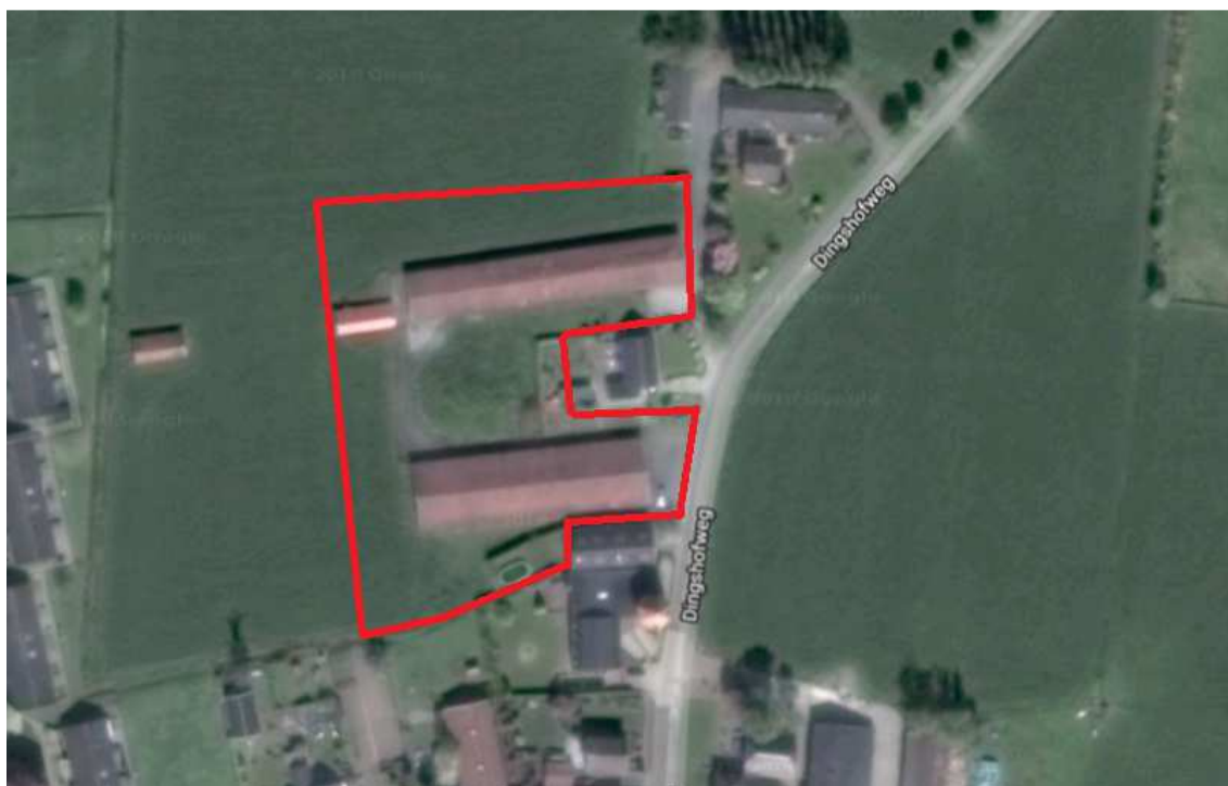
Figuur 2.1. Plangebied rood omlijnd

Rond de bebouwing is sprake van grotendeels onverhard terrein bestaande uit weiland en tuin behorende bij de woning. Aan de straatzijde is sprake van enige verharding in de vorm van asfalt en straatwerk. De omgeving bestaat uit weiland, agrarische bedrijven en woningen.