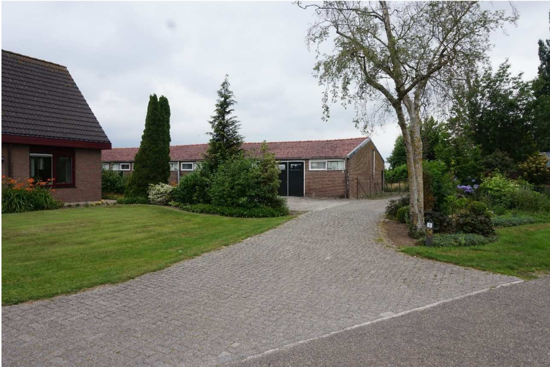
Figuur 2.2 Overzicht vanaf Boskamp met op achtergrond noordelijke schuur (kringloopwinkel).