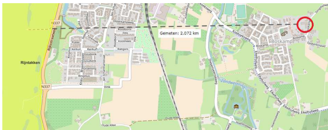
Figuur 2.7 De afstand tussen de onderzoekslocatie en het dichtstbijzijnde Natura 2000-gebied

Gelet op de afstand tot het gebied, de aard van het tussenliggende gebied (bebouwde kom Olst, provinciale weg en agrarisch terrein), de kernopgave van het Natura 2000-gebied en de aard van de geplande ingreep wordt geen onderzoek in het kader van gebiedsbescherming binnen de Wet natuurbescherming uitgevoerd (zie ook paragraaf 1.2 scope).