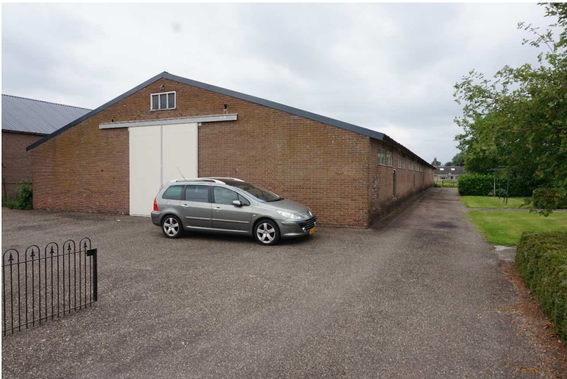
Figuur 2.3 Zuidelijke schuur (caravanstalling) met omliggende asfaltverharding.