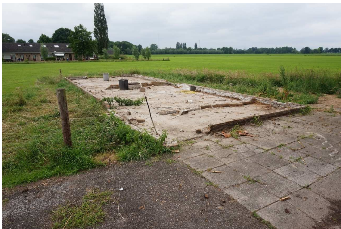
Figuur 2.5 Locatie reeds gesloopte schuur aan westzijde terrein.