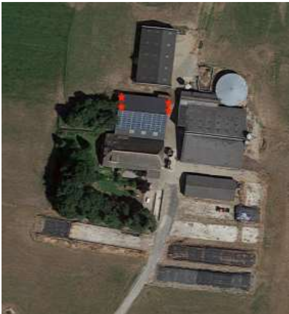
Afbeelding: Rood nestlocaties huismussen

Op 4 april en 16 april 2019 zijn veldonderzoeken op en om de planlocatie uitgevoerd. Beide keren werden op de planlocatie 8 tot tien huismussen foeragerend aangetroffen. Ook werden vier nesten aangetroffen.