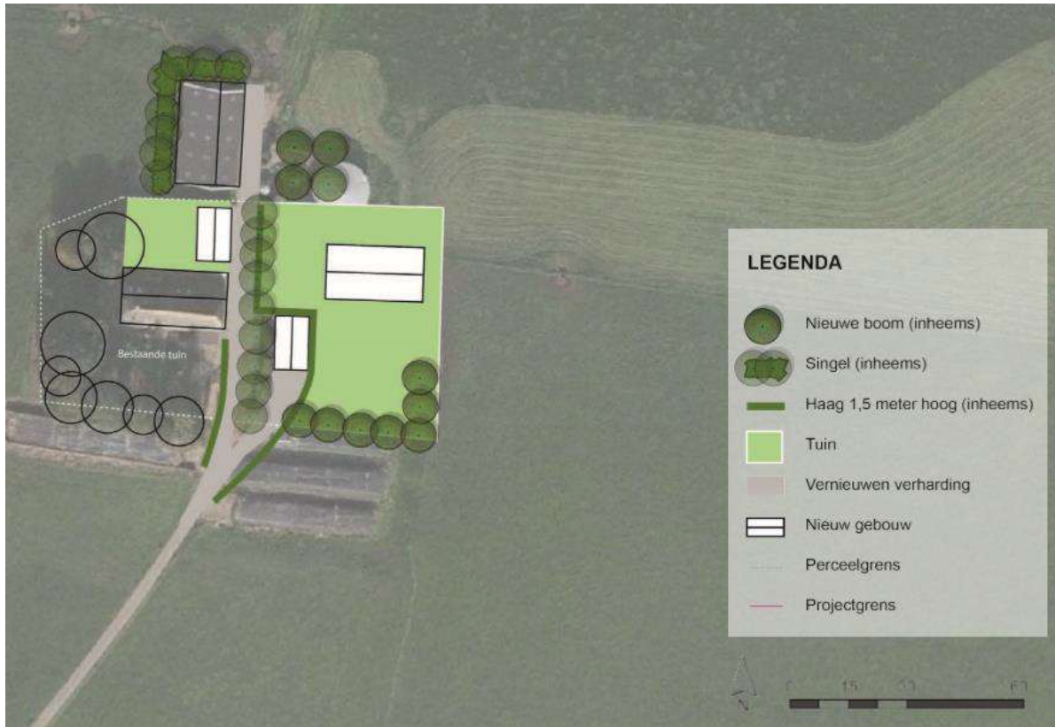
Inrichtingsschets toekomstige situatie

afscheiding voor beide woningen. De haag bestaat uit veldesdoorn en heeft een lengte van 130 meter. De veldesdoorn wordt in een dubbele rij aangeplant. Hierdoor krijgt de haag een robuuste en gesloten vorm. Aan de west- en noordzijde van de kapschuur zal een singel van 4 meter breed worden aangeplant. Hierbij worden diverse soorten bosplantsoen gebruikt. De soorten worden aangeplant in groepen van 5-7 stuks. Hiermee wordt voorkomen dat plantsoorten elkaar weg concurreren. De plantafstand tussen de soorten betreft 1,50x1,50 meter. In het midden van de singel worden enkele boomvormers aangeplant.