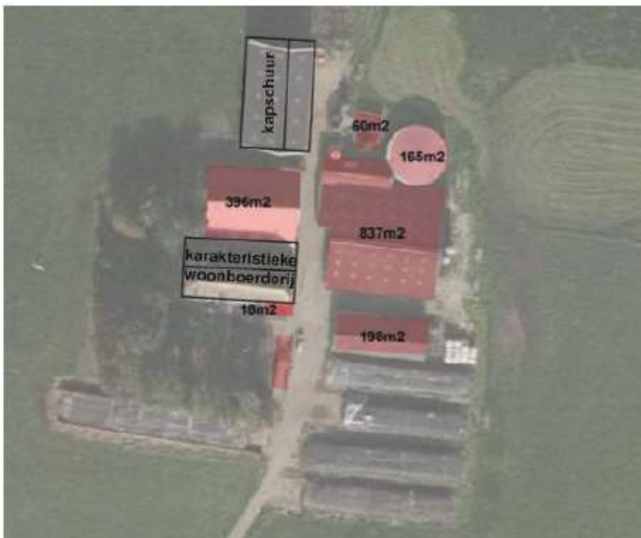
Plangebied met in rood de te verwijderen gebouwen

De initiatiefnemer is voornemens het erf aan de Bremmelstraat 13 te Wijhe her in te richten. Er worden twee koeienschuren, drie opslagruimtes en een meststalo gesloopt. Tevens wordt een nieuwe woning gerealiseerd. Op de onderstaande afbeelding zijn de te verwijderen gebouwen met rood aangegeven. De huidige bedrijfsvoering (veehouderij) wordt gestaakt op het erf.