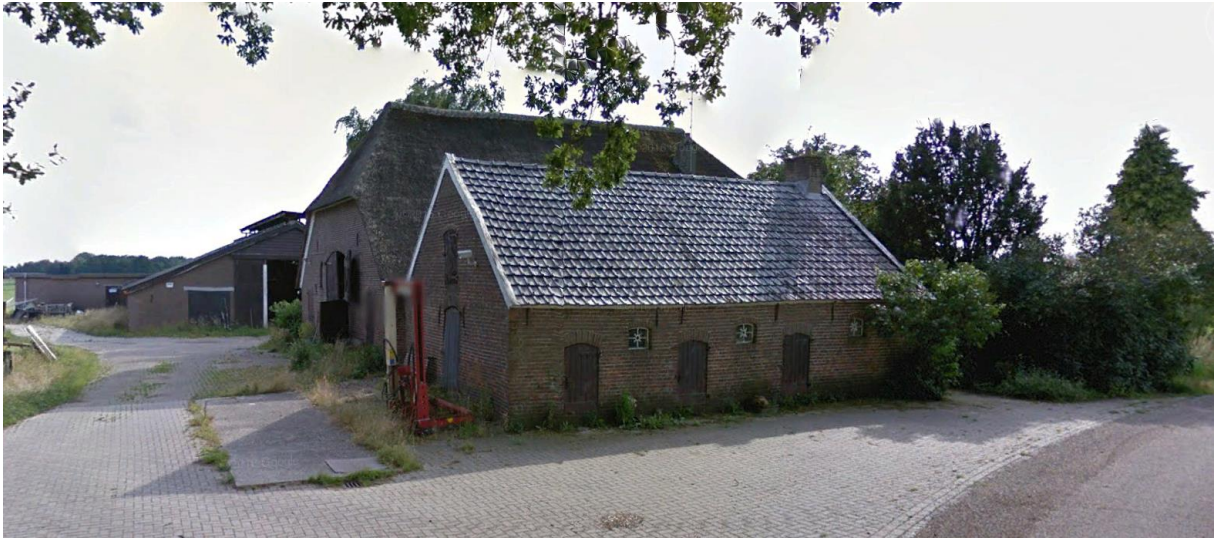
Figuur 5, foto boerderij met schuur