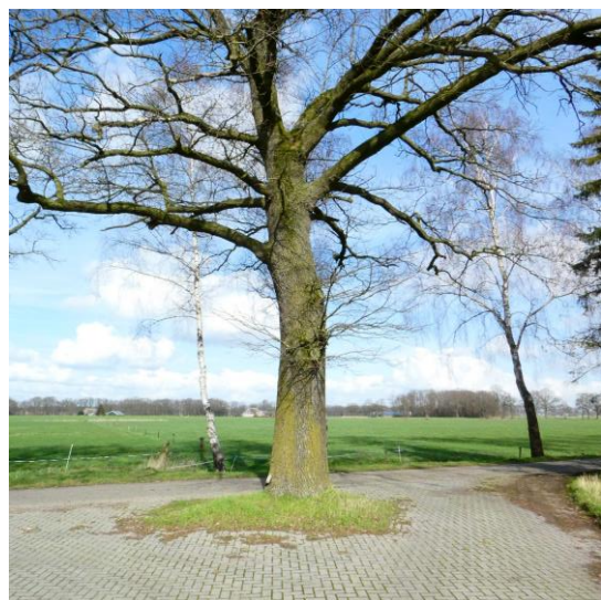
Figuur 6, solitaire beschermwaardige eik op het erf