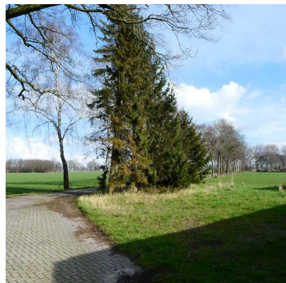
Figuur 9, te verwijderen kerstsparen