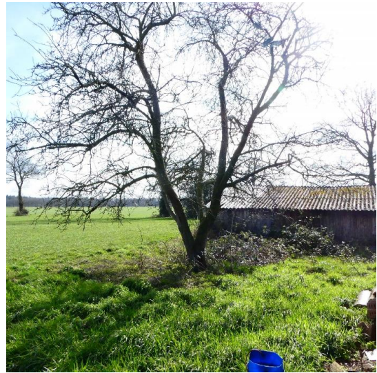
Figuur 8, perenboom op het achtererf

Direct langs de gevel van de te slopen ligboxenstal staan een aantal berkenbomen. Deze kunnen in verband met de sloop van de stal en de mestkelder niet behouden blijven. Ook staan op het erf een aantal doorgegroeide kerstbomen. Deze worden verwijderd.