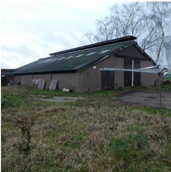
Figuur 10, ligboxenstal met berkenbomen

Direct langs de gevel van de te slopen ligboxenstal staan een aantal berkenbomen. Deze kunnen in verband met de sloop van de stal en de mestkelder niet behouden blijven. Ook staan op het erf een aantal doorgegroeide kerstbomen. Deze worden verwijderd.