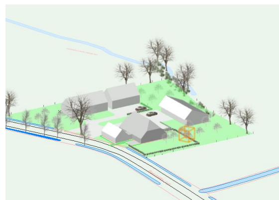
Figuur 7, 3D verbeelding nieuw erf