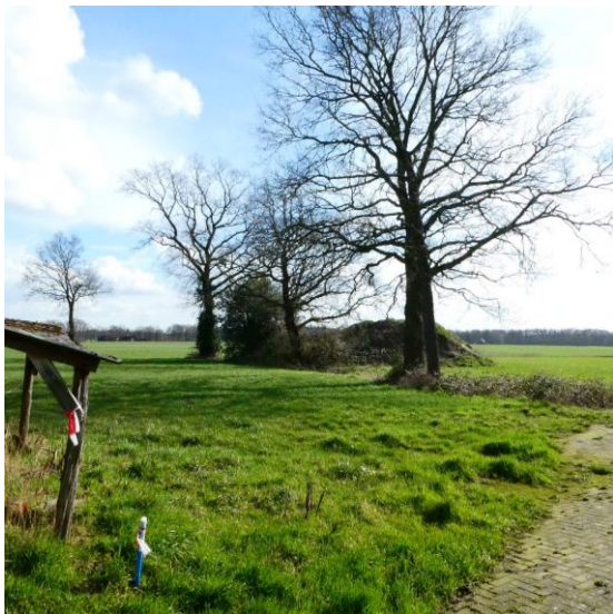
Figuur 5, oude eiken van de houtwal aan de zuidzijde

Achter de boerderij staan nog een aantal eiken van een oude houtwal. Deze blijven behouden en de houtwal wordt hersteld door nieuwe aanplant van inheems bosplantsoen toe te voegen. Op het achtererf staat een beschermwaardige eik ook deze blijft behouden en is zorgvuldig ingepast in de nieuwe situatie.