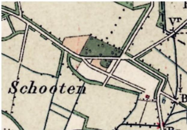
Figuur 6: uitsnede topografische kaart rond 1900

Aan een voorzijde wordt een gemengde haag toegevoegd ter verstrekking van het erfbeeld; voor- en achterzijde .