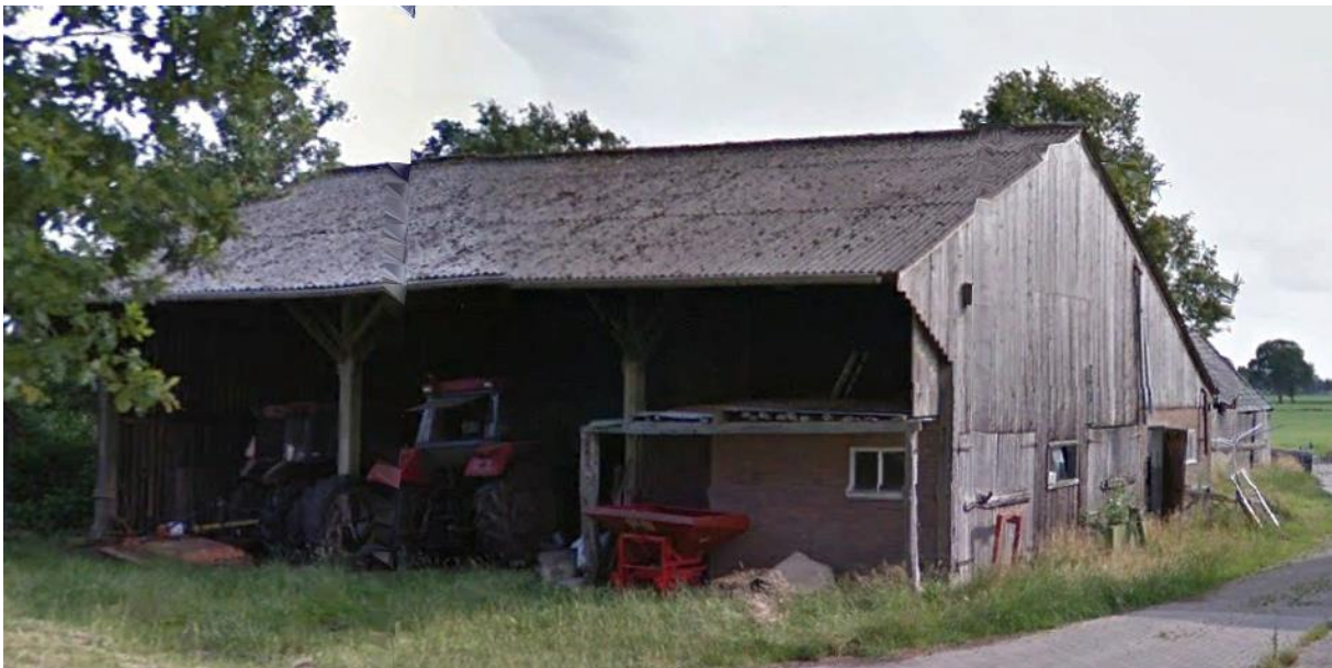
Figuur 4, te slopen kapschuur