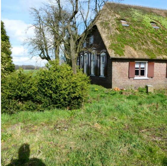
Figuur 7, fruitbomen in de voortuin

In de tuin van de boerderij staan een aantal hoogstam fruitbomen ook deze blijven behouden. Ook een hoogstam perenboom op het achtererf blijft behouden.