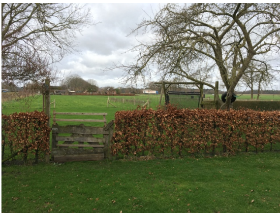
Figuur 4. Locatie nieuw bijgebouw nr. 7 (achter de heg).