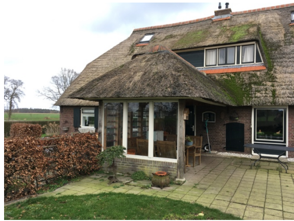
Figuur 3. Achterzijde woning met open uitbouw.