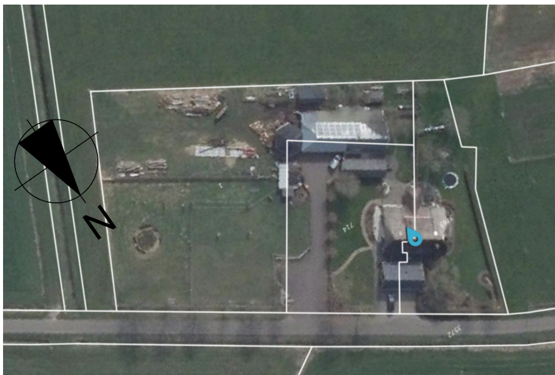
Fig. 1. Luchtfoto huidige situatie Bonekampsweg 7-9.

Het voornemen bestaat om de erven van Bonekampsweg 7-9 te reconstrueren (fig. 1). Onder meer bij ruimtelijke ingrepen dient rekening te worden gehouden met beschermde soorten en gebieden. Wet- en regelgeving omtrent deze soorten en gebieden is vastgelegd in de Wet Natuurbescherming (Wnb, 2017) en de provinciale ruimtelijke verordening (Natuurnetwerk/NNN).