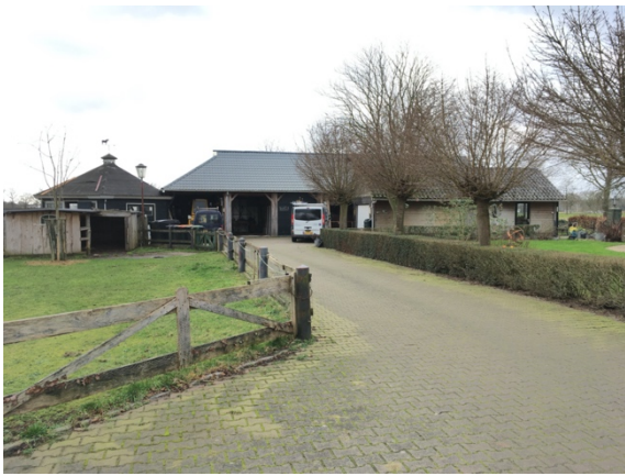
Figuur 2. Schuurcomplex met links de hobbystallen.