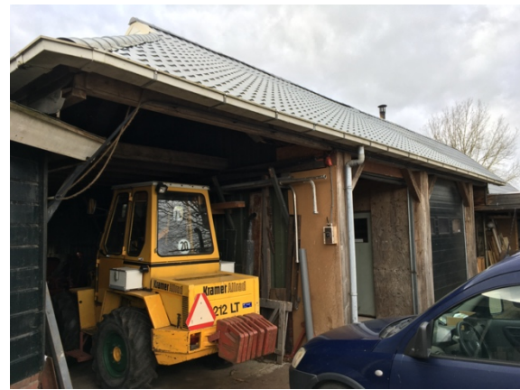
Figuur 5. Te verbouwen schuurgedeelte.