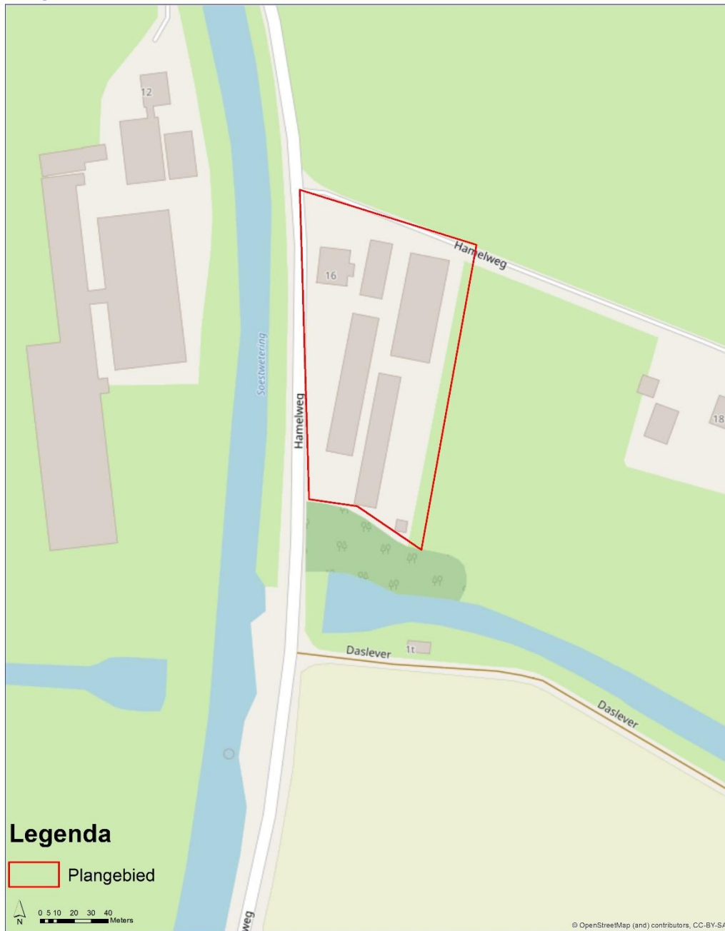
Afbeelding 1. Ligging plangebied.