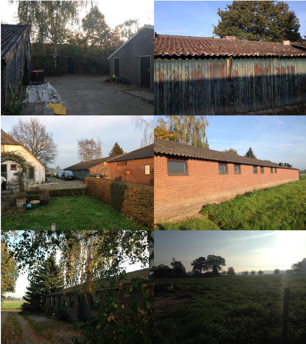
Afbeelding 2. Impressie plangebied, situatie op datum 18 oktober 2018.