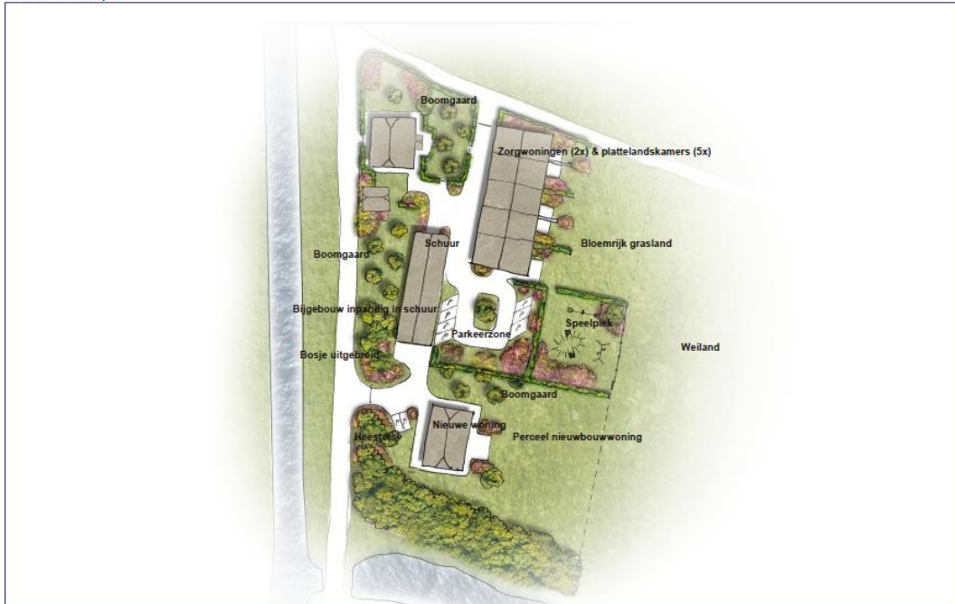
Afbeelding 3. Voorgenomen ontwikkeling.