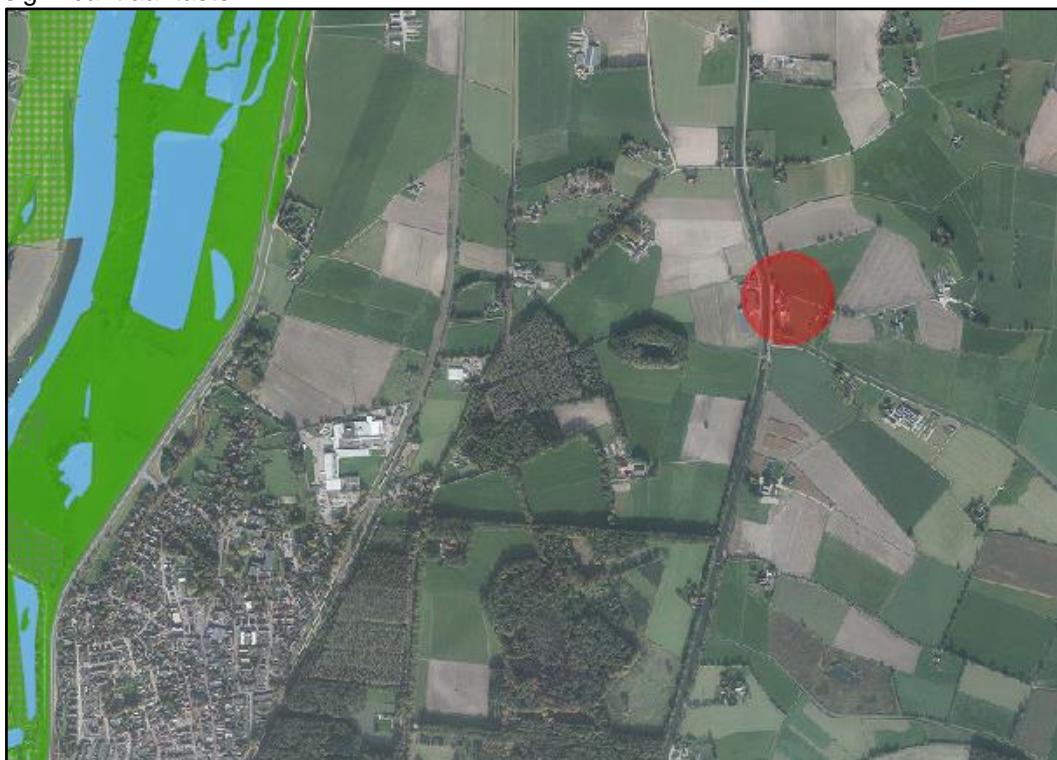
Afbeelding 4. Plangebied ten opzichte van NNN (groen/ blauwe vlakken), rode arcering geeft het plangebied weer.

Het plangebied en de directe omgeving maken (geen) onderdeel uit van het NNN. Het plangebied ligt op ongeveer 2 kilometer van begrensd NNN-gebied (afbeelding 4). Met de voorgenomen werkzaamheden worden geen negatieve effecten verwacht op de wezenlijke waarden en kenmerken van het NNN. Van afname van areaal is geen sprake, tevens worden geen effecten verwacht die de wezenlijke waarden en kenmerken van het NNN significant aantasten.