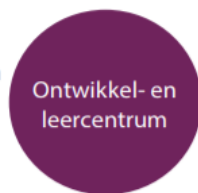
Figuur 2. Een vijfde model (Taskforce, 2017)

5 Ontwikkel- en leercentrum Organisatie: 1 Dienst: 1